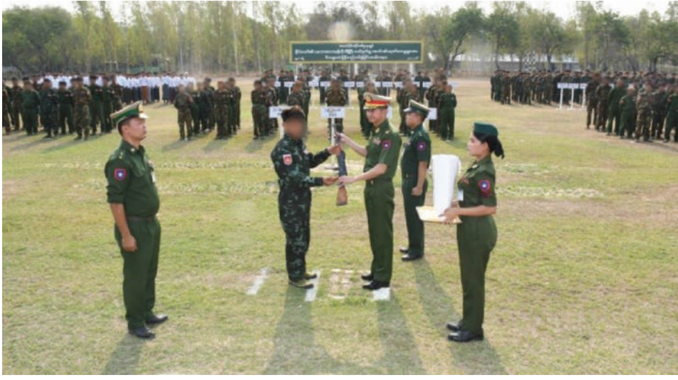
အလယ်ပိုင်းတိုင်း စစ်ဌာနချုပ် တိုင်းမှူး ဗိုလ်မှူးချုပ် အောင်ဌေးထံ ဥပဒေဘောင်အတွင်း ဝင်ရောက်လာသူ တစ်ဦးက လက်နက်အပ်နှံစဉ်။

ဦးစွာ တိုင်းဒေသကြီးဝန်ကြီးချုပ်က အမှာစကားပြောကြားပြီး တိုင်းမှူးက တရားဥပဒေပုဒ်မများနှင့် ပတ်သက်၍ အသိပညာပေးစကားများ ရှင်းလင်း ဆွေးနွေးပြောကြားသည်။ ထို့နောက် ဥပဒေဘောင်အတွင်း ပြန်လည်ဝင်ရောက်ခဲ့ကြသူများက ၎င်းတို့နှင့်အတူပါရှိ လာသည့် လက်နက်မျိုးစုံ ၃၁ လက်နှင့် လက်ပစ်ဗုံး၊ ဗုံးသီး ၄၈ လုံး၊ စကားပြောစက် တစ်လုံး၊ ကျည်အိမ်မျိုးစုံ ၃၅ ခု၊ ကျည်မျိုးစုံ ၁၂၉၈ တောင့်၊ မိုင်းမျိုးစုံ သုံးလုံး တို့ကို လွှဲပြောင်းအပ်နှံရာ တိုင်းမှူးက လက်ခံရယူသည်။ ၎င်းနောက် တိုင်းဒေသကြီးဝန်ကြီးချုပ်နှင့် တိုင်းမှူးတို့က မောင်းပြန်ရိုင်းဖယ်သေနတ် တစ်လက် အတွက် ဆုကြေးငွေကျပ်သိန်း ၅၀ နှုန်း၊ လက်လုပ်သေနတ် တစ်လက်နှုန်း အတွက် ဆုကြေးငွေကျပ် ငါးသိန်း နှုန်း၊ လက်ပစ်ဗုံး၊ ဗုံးသီး တစ်လုံးစီအတွက် ဆုကြေး ငွေကျပ် သုံးသိန်းနှုန်း၊ စကားပြောစက်တစ်လုံးအတွက် ဆုကြေးငွေကျပ် နှစ်သိန်းနှုန်းနှင့် အလင်းဝင်ရောက်လာသူများကို တစ်ဦးလျှင် ငွေကျပ် တစ်သိန်းဖြင့် စုစုပေါင်း ငွေကျပ် ၁၇၁၂ သိန်းနှင့် ထောက်ပံ့ပစ္စည်းများကို ပေးအပ်သည်။ ယင်းနောက် ဥပဒေဘောင်အတွင်း ပြန်လည်ဝင်ရောက်ခဲ့ကြသူများကို ခံဝန်ကတိလက်မှတ်ရေးထိုး