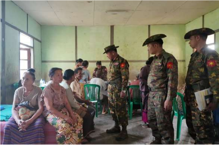
အရှေ့မြောက်တိုင်းစစ်ဌာနချုပ် တိုင်းမှူး ဗိုလ်ချုပ်အေးမင်းဦး ဒေသခံပြည်သူများကို ကျန်းမာရေးစောင့်ရှောက်မှုလုပ်ငန်းများ ဆောင်ရွက်ပေးနေမှုကို ကြည့်ရှုအားပေးစဉ်။

နေပြည်တော် ဧပြီ ၂၄ - တပ်မတော်အနေဖြင့် တိုင်းရင်းသား ပြည်သူများ၏ ကျန်းမာရေးစောင့်ရှောက်မှု လုပ်ငန်းများတွင် နိုင်ငံတော်အစိုးရနှင့်အတူ တစ်ဖက်တစ်လမ်းက ကူညီစောင့်ရှောက်မှု များ ဆောင်ရွက်ပေးလျက်ရှိရာ တိုင်း ဒေသကြီးနှင့် ပြည်နယ်အသီးသီးရှိ တပ်မတော်နယ်လှည့် ဆေးကုသရေး အဖွဲ့များက ဒေသအသီးသီးရှိ ဒေသခံ တိုင်းရင်းသားပြည်သူများကို ၎င်းတို့၏ မြို့နယ်၊ ကျေးရွာများအရောက် သွားရောက် ၍ လူမျိုး၊ ဘာသာမရွေး ဆေးကုသပေး ခြင်းများ ဆောင်ရွက်ပေးလျက်ရှိသည်။ ထိုသို့ဆောင်ရွက်ပေးလျက်ရှိရာ ယနေ့ တွင် အရှေ့မြောက်တိုင်းစစ်ဌာနချုပ် နယ်လှည့်ဆေးကုသရေးအဖွဲ့က တန့်ယန်း မြို့နယ် တန့်ယန်းကျေးရွာရှိ အခြေခံပညာ မူလတန်းကျောင်း၌ အခြေပြု၍ ကျေးရွာရှိ သံဃာတော်အပါး ၇၀ နှင့် ဒေသခံပြည်သူ ၇၂ ဦးတို့ကို အရေပြားရောဂါ၊ သွေးတိုး