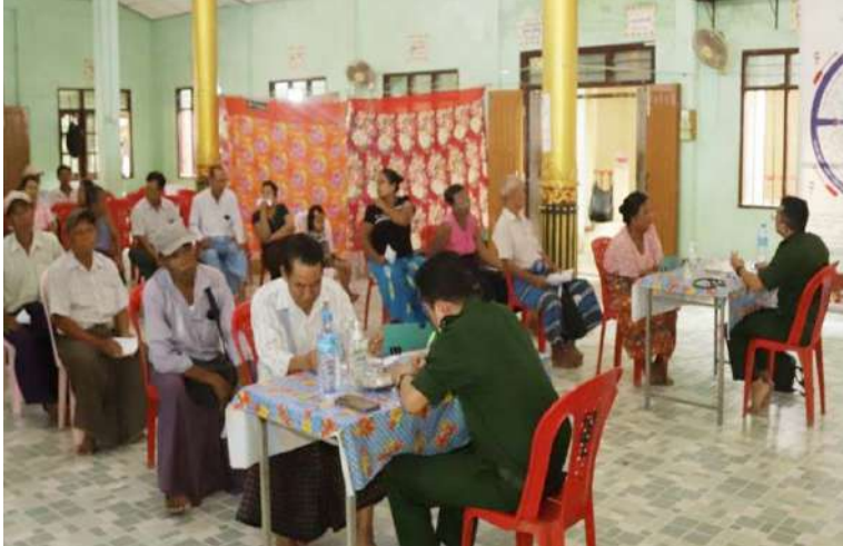
ရန်ကုန်တိုင်းစစ်ဌာနချုပ် နယ်လှည့်ဆေးကုသရေးအဖွဲ့က ဒေသခံပြည်သူများကို ကျန်းမာရေးစောင့်ရှောက်မှုလုပ်ငန်းများ ဆောင်ရွက်ပေးစဉ်။

ပြီး လိုအပ်သည်များ ပေါင်းစပ်ညှိနှိုင်း ဆောင်ရွက်ပေးသည်။ အလားတူ ရန်ကုန်တိုင်းစစ်ဌာနချုပ် နယ်လှည့်ဆေးကုသရေးအဖွဲ့က ရန်ကုန် တိုင်းဒေသကြီး သုံးခွမြို့နယ် ရဲနွဲ့ကျေးရွာ ရှိ ဒက္ခိဏာရုံကျောင်းတိုက်၌ အခြေပြု၍ အဆိုပါကျေးရွာနှင့် ပတ်ဝန်းကျင်ကျေးရွာ များရှိ ဒေသခံပြည်သူ ၁၁၉ ဦးတို့ကို အရိုး အကြောရောဂါ၊ ခွဲစိတ်ကုသမှုဆိုင်ရာ ရောဂါ၊ ကလေးရောဂါ၊ မျက်စိရောဂါ၊ နား၊ နှာခေါင်း၊ လည်ချောင်းရောဂါ၊ သွားနှင့် ခံတွင်းရောဂါ၊ သားဖွားမီးယပ်ရောဂါ၊ အထွေထွေရောဂါတို့နှင့် ပတ်သက်၍ ကျန်းမာရေး စစ်ဆေးကုသပေးခြင်းများ ဆောင်ရွက်ပေးသည်။ ယင်းသို့ ဆောင်ရွက်ပေးနေမှုများကို သန်လျင်တပ်နယ်မှ တာဝန်ရှိသူများက သွားရောက်ကြည့်ရှုအားပေးပြီး လိုအပ် သည်များ ပေါင်းစပ်ညှိနှိုင်းဆောင်ရွက်ပေး ခဲ့ကြောင်း သတင်းရရှိသည်။ (၅၀၁)