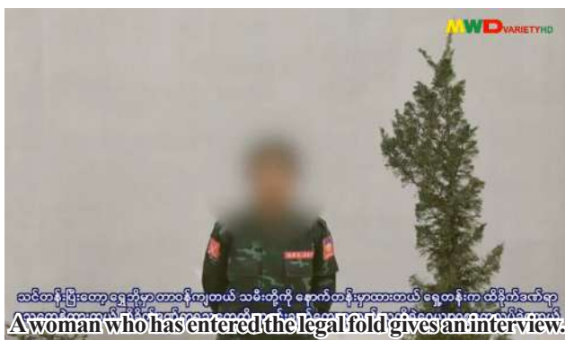
A woman who has entered the legal fold gives an interview.