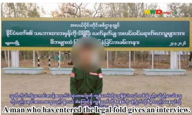
A man who has entered the legal fold gives an interview.