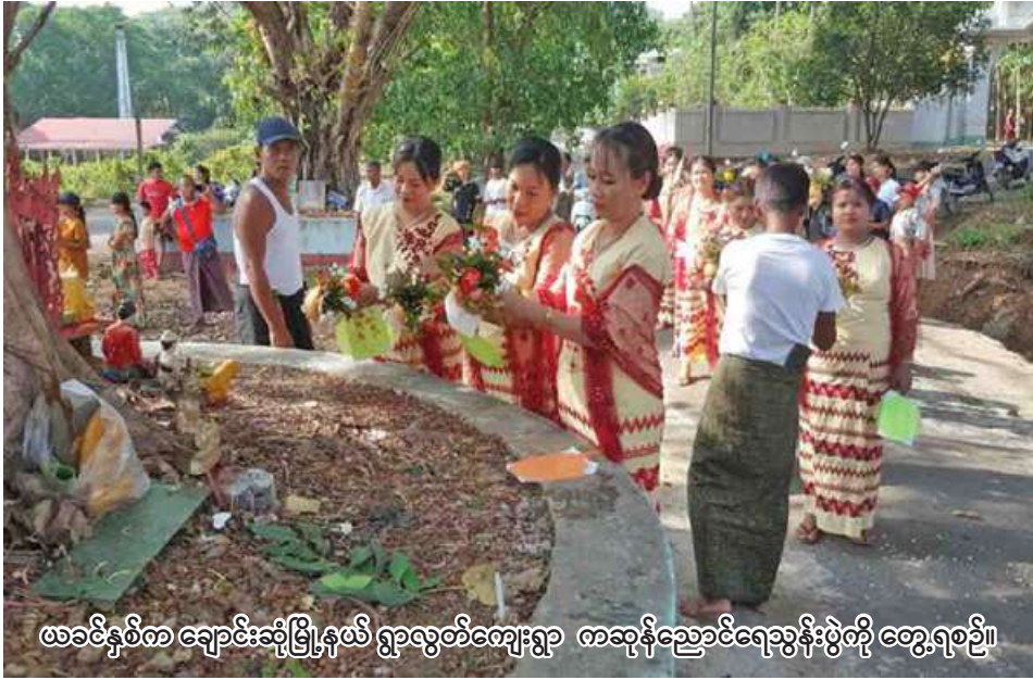
ဖခင်နှစ်က ချောင်းဆုံမြို့နယ် ရွာလွတ်ကျေးရွာ ကဆုန်ညောင်ရေသွန်းပွဲတော်ကို တွေ့ရစဉ်။

ချောင်းဆုံ ဧပြီ ၂၄ မွန်ပြည်နယ် ချောင်းဆုံမြို့နယ် ရွာလွတ်ကျေးရွာတွင် ကဆုန်ညောင်ရေသွန်းပွဲတော်ကို မွန်ရိုးရာထုံးတမ်းအစဉ်အလာများနှင့်အညီ အသင်းများဖြင့်ကျင်းပပြီး ပြိုင်ပွဲများကိုလည်းထည့်သွင်းကာ ဆုများ