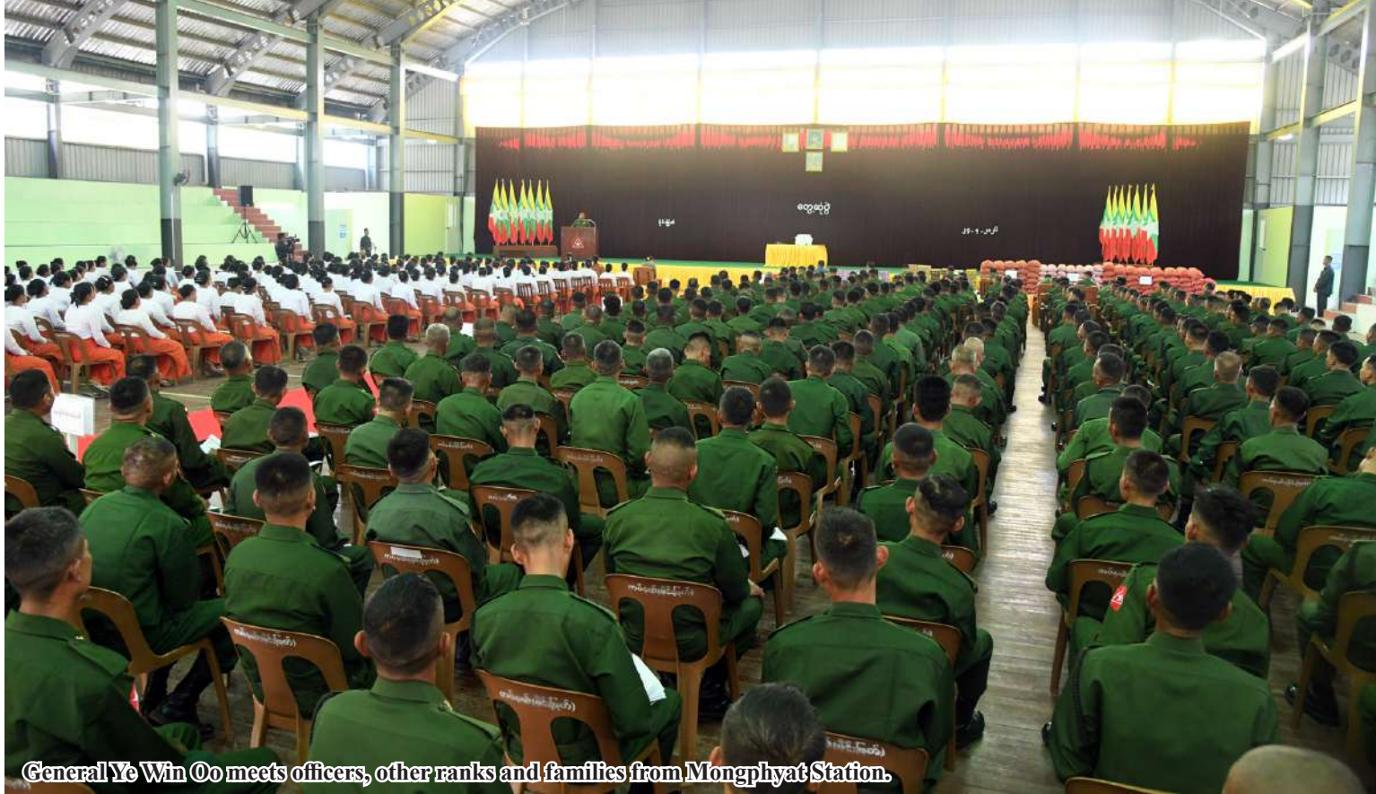
General Ye Win Oo meets officers, other ranks and families from Mongphyat Station.