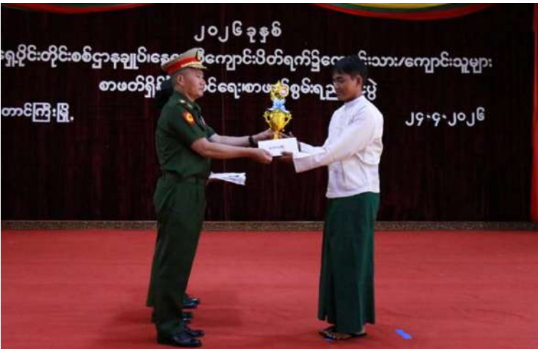
အရှေ့ပိုင်းတိုင်းစစ်ဌာနချုပ် တိုင်းမှူး ဗိုလ်မှူးချုပ်ကျော်နိုင်ဦး ဆုရရှိသည့် ကျောင်းသားတစ်ဦးကို ဆုပေးအပ်ချီးမြှင့်စဉ်။

နေပြည်တော် ဧပြီ ၂၄ - နွေရာသီ ကျောင်းပိတ်ရက်အတွင်း ကျောင်းသား၊ ကျောင်းသူများ စာဖတ်ရိုက် ဖြင့်တင်ရေး စာဖတ်စွမ်းရည်ပြိုင်ပွဲကို ယနေ့နံနက်ပိုင်းတွင် အရှေ့ပိုင်းတိုင်း စစ်ဌာနချုပ် သံလွင်ခန်းမ၌ ပြုလုပ်ရာ