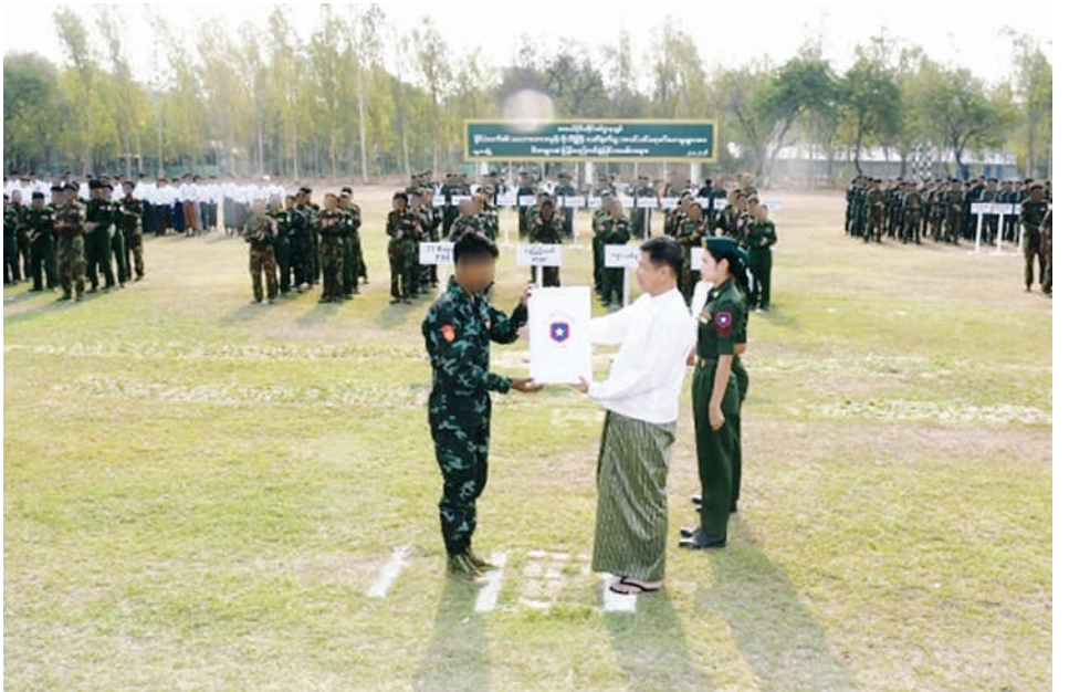
မန္တလေးတိုင်းဒေသကြီးဝန်ကြီးချုပ် ဦးမျိုးအောင် ဥပဒေဘောင်အတွင်း ဝင်ရောက်လာသူများကို ဆုကြေးငွေနှင့် ထောက်ပံ့ပစ္စည်းများပေးအပ်စဉ်။

နိုင်ငံတော်နှင့် တပ်မတော်၏ ငြိမ်းချမ်းရေးလုပ်ငန်းစဉ်များကို လက်ခံယုံကြည်လာသည့် KIA ၊ AA ၊ PLA အကြမ်းဖက်အဖွဲ့များမှ အဖွဲ့ဝင်အချို့အပါအဝင် PDF အမည်ခံ အကြမ်းဖက်အဖွဲ့အစည်း အသီးသီးမှ အဖွဲ့ဝင် အမျိုးသားဦးရေ ၄၇၀ နှင့် အမျိုးသမီး ၄၇ ဦး စုစုပေါင်း ၅၁၇ ဦးတို့ လက်နက်၊ ခဲယမ်းများနှင့်အတူ ဥပဒေဘောင်အတွင်းသို့ ထပ်မံဝင်ရောက်၊ မိဘအုပ်ထိန်းသူများထံ စနစ်တကျလွှဲပြောင်းအပ်နှံ