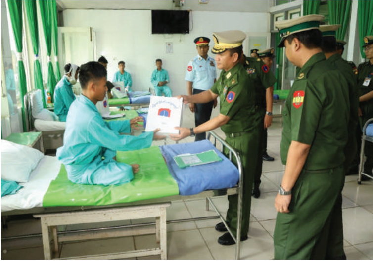
မြောက်ပိုင်းတိုင်း စစ်ဌာနချုပ် တိုင်းမှူး ဗိုလ်ချုပ် အောင်ဇော်ထွေး ဆေးကုသမှု ခံယူနေသူတစ်ဦးကို အာဟာရဖြည့်စားသောက်ဖွယ်ရာ များနှင့် ချီးမြှင့်ငွေများ ပေးအပ်စဉ်။