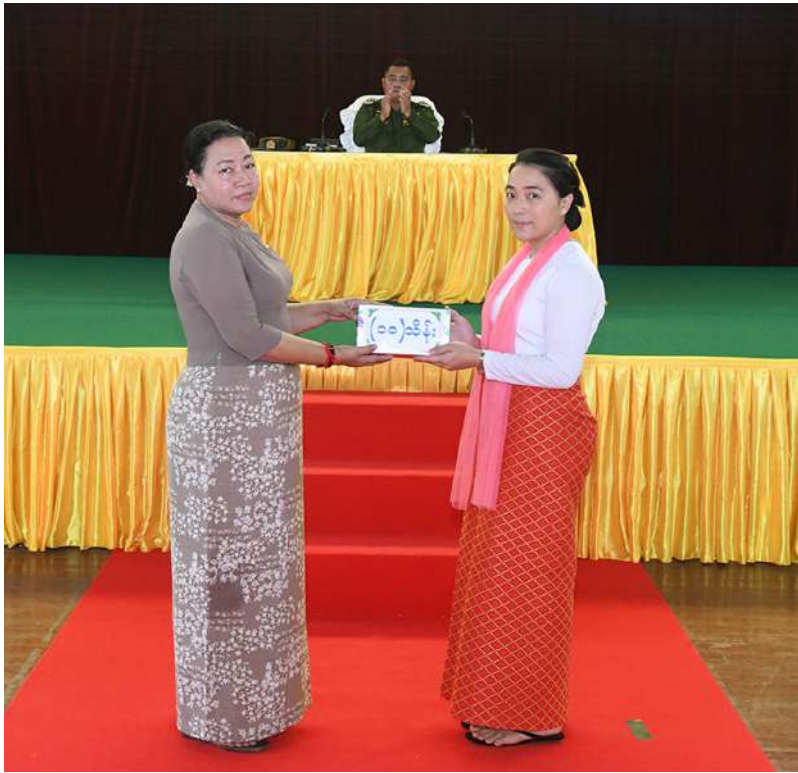
တပ်မတော်ကာကွယ်ရေးဦးစီးချုပ် ဗိုလ်ချုပ်ကြီးရဲဝင်းဦး၏ဇနီး ဒေါ်နီလာ တပ်နယ် များရှိ မိခင်နှင့်ကလေးစောင့်ရှောက်ရေးအသင်းအတွက် ချီးမြှင့်ငွေများ ပေးအပ်ရာ တပ်နယ်မှူး၏ဇနီးက လက်ခံရယူစဉ်။

ကျောဖုံးမှအဆက် တာဝန်ထမ်းဆောင်နေသူများဖြစ်ကြောင်း၊ အလားတူ တပ်မတော်သားများ၏ ဇနီးများ သည်လည်း ကောင်းတူဆိုးဖက်တာဝန်ကျ ရာနေရာတွင် ပါရမီဖြည့်ဖက်ကောင်းများ အဖြစ်လိုက်ပါနေထိုင်၍ တပ်ရေးတပ်ရာ ကိစ္စရပ်များတွင် ပူးပေါင်းပါဝင်လုပ်ကိုင် လျက်ရှိကြကြောင်း၊ ထို့ပြင် တပ်မတော် သည်ရဲဘော်စိတ်ကိုအခြေခံ၍တည်ဆောက် ထားကာ အထက်အောက်လေးစားသော စိတ်ဓာတ်၊ ရွယ်တူကိုလေးစားသော စိတ်ဓာတ်၊ ငယ်သူကို ညှာတာသော စိတ်ဓာတ်ရှိသည့် ခိုင်မာသောအဖွဲ့အစည်း ဖြစ်ကြောင်း၊ တစ်ဦးတစ်ယောက်ချင်းစီမှ အဖွဲ့၊ တပ်စိတ်၊ တပ်စုအဆင့်ဆင့်အဖွဲ့ အစည်းစိတ်ဓာတ်ဖြင့် ပူးပေါင်းလုပ်ကိုင် ခြင်းဖြင့် ရည်မှန်းချက်တာဝန်များကို အောင်မြင်အောင် ဆောင်ရွက်နိုင်ရန် လိုကြောင်း။ တပ်မတော်သားများအတွက် စောင့် ထိန်းလိုက်နာရမည့် စစ်သည်တော်ကျင့် ဝတ်အပါးဖိဝကိုပြဋ္ဌာန်းထားပြီးဖြစ်ကြောင်း၊ ကျင့်ဝတ်များကိုလိုက်နာခြင်းဖြင့် အထက် အောက်ဆက်ဆံရေး၊ လုပ်ဖော်ကိုင်ဖက် ဆက်ဆံရေး၊ ပြည်သူလူထုနှင့်ဆက်ဆံရေး များတွင် အဆင်ပြေနိုင်မည်ဖြစ်၍ ကျင့်ဝတ် အပါး ဖိဝ ကို ခါးဝတ်ပုဆိုးကဲ့သို့ မြဲမြံစွာ စောင့်ထိန်းလိုက်နာရန် လိုအပ်ကြောင်း၊ စည်းကမ်းသည် တပ်မတော်၏ အသက် သွေးကြောဖြစ်၍ စည်းကမ်းနှင့်ပတ်သက်၍ အလျော့ပေး၍မရကြောင်း၊ တပ်မတော်တွင် တာဝန်ထမ်းဆောင်မှုမှ စားသောက်နေထိုင် သွားလာမှုများအထိ ထောင့်စုံအောင် သတ်မှတ်ထားသည့် စည်းကမ်းများရှိပြီး အိမ်ထောင်သည်လိုင်းစည်းကမ်း၊ တပ်ပြင် ထွက်ခွင့်စည်းကမ်းစသည်ဖြင့် သတ်မှတ် ထားကာ လိုက်နာကြရန်လိုကြောင်း၊ စည်းကမ်းချိုးဖောက်မှုများနှင့် ပတ်သက်၍ လျစ်လျူရှု၍မရကြောင်း၊ အိမ်ထောင်တစ်ခု၊ အဖွဲ့အစည်းတစ်ခုအတွင်း စည်းကမ်း ချိုးဖောက်မှုကိုလျစ်လျူရှုခြင်းသည် ၎င်း အိမ်ထောင်နှင့် အဖွဲ့အစည်းအတွင်း ပျက်စီး ရာပျက်စီးကြောင်းကို ဖြစ်ပေါ်စေကြောင်း၊ တာဝန်ရှိသူများ၏ ဘာသာသနာရေး