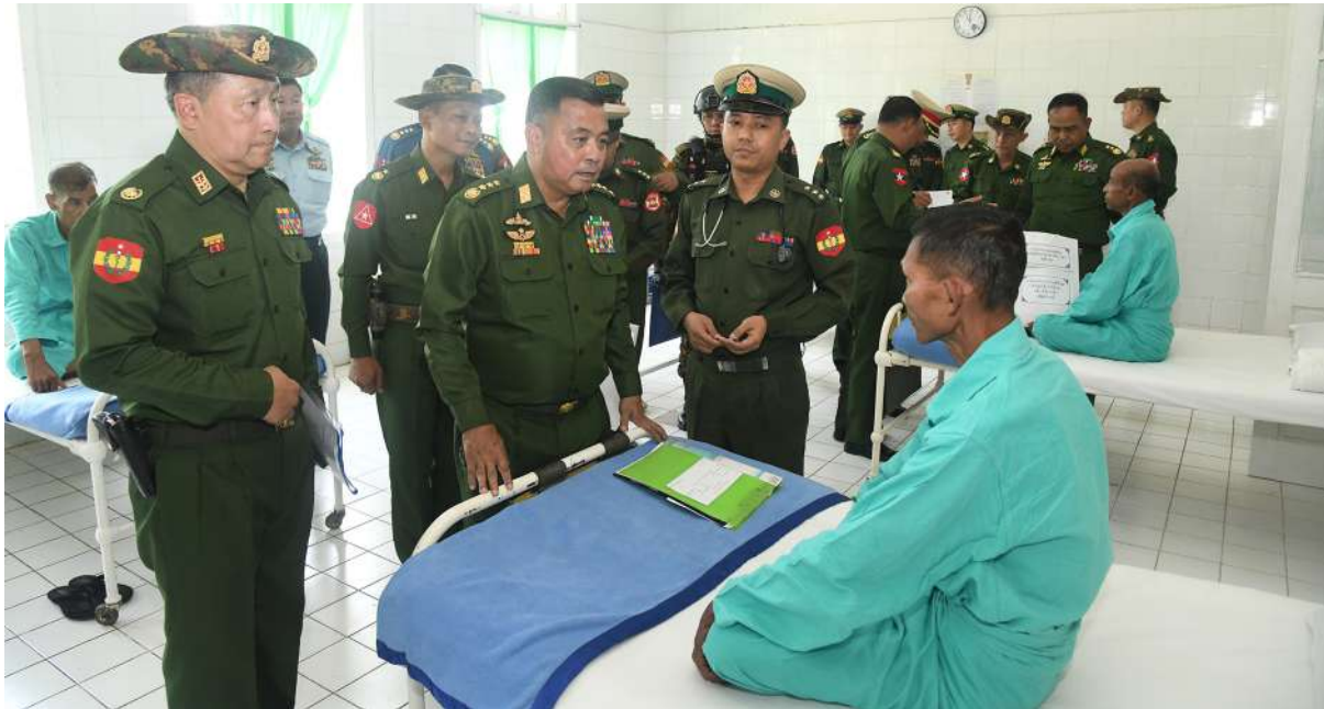
တပ်မတော်ကာကွယ်ရေးဦးစီးချုပ် ဗိုလ်ချုပ်ကြီးရဲဝင်းဦး ဆေးကုသမှုခံယူလျက်ရှိသည့် အရာရှိ၊ စစ်သည်၊ မြန်မာနိုင်ငံ ရဲတပ်ဖွဲ့ဝင်များ၊ ပြည်သူ့စစ်(ဌာန)တပ်ဖွဲ့ဝင်များ တစ်ဦးချင်း၏ ရောဂါဖြစ်ပွားမှုအခြေအနေများ၊ ဆေးဝါးကုသမှုပေးထားသည့်အခြေအနေများနှင့် ကျန်းမာရေးတိုးတက်ကောင်းမွန်မှုအခြေအနေများကို ရင်းရင်းနှီးနှီးမေးမြန်းအားပေးစကားပြောကြားစဉ်။