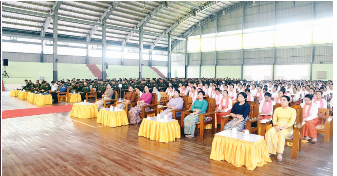
တပ်မတော်ကာကွယ်ရေးဦးစီးချုပ် ဗိုလ်ချုပ်ကြီးရဲဝင်းဦး မိုင်းဖြတ်၊ မိုင်းယောင်း၊ တာလေ၊ တာချီလိတ်တပ်နယ်များမှ အရာရှိ၊ စစ်သည်၊ မိသားစုများကို တွေ့ဆုံအမှာစကားပြောကြားစဉ်။