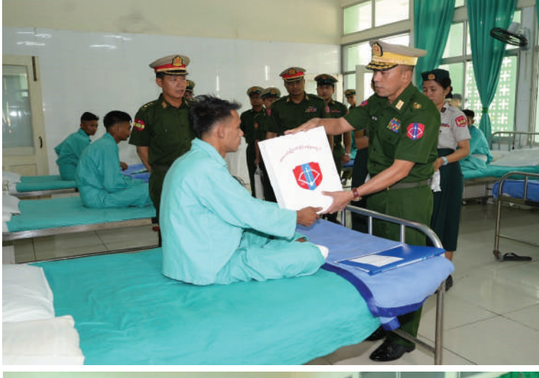
အနောက်မြောက် တိုင်းစစ်ဌာနချုပ် တိုင်းမှူး ဗိုလ်ချုပ်ကျော်သူရ ဆေးကုသမှု ခံယူနေသူတစ်ဦးကို အာဟာရဖြည့်စားသောက်ဖွယ်ရာ များနှင့် ချီးမြှင့်ငွေများ ပေးအပ်စဉ်။