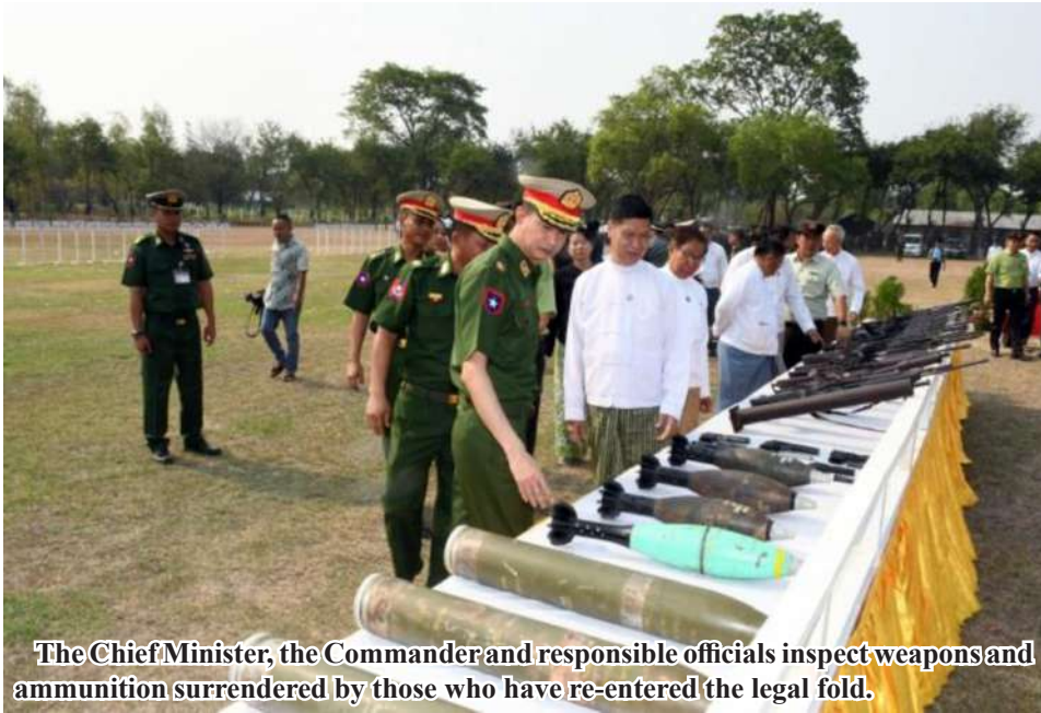
The Chief Minister, the Commander and responsible officials inspect weapons and ammunition surrendered by those who have re-entered the legal fold.

Nay Pyi Taw April 24 The government extends invitations to those from various armed opposition groups including PDF to return to the legal frame and provides necessary aid for those returnees.