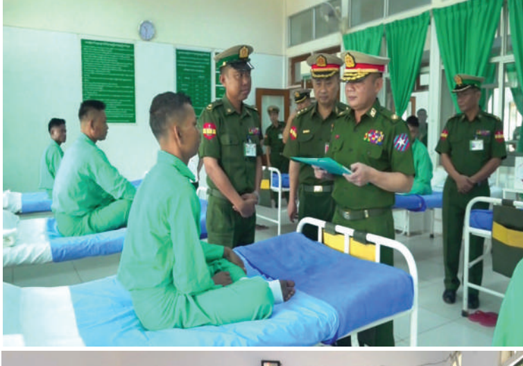
အရှေ့တောင် တိုင်းစစ်ဌာနချုပ် တိုင်းမှူး ဗိုလ်မှူးချုပ် သူရဇော်လွင်စိုး ဆေးကုသမှု ခံယူနေသူ တစ်ဦးကို ရင်းရင်းနှီးနှီးမေးမြန်း အားပေးစကား ပြောကြားစဉ်။