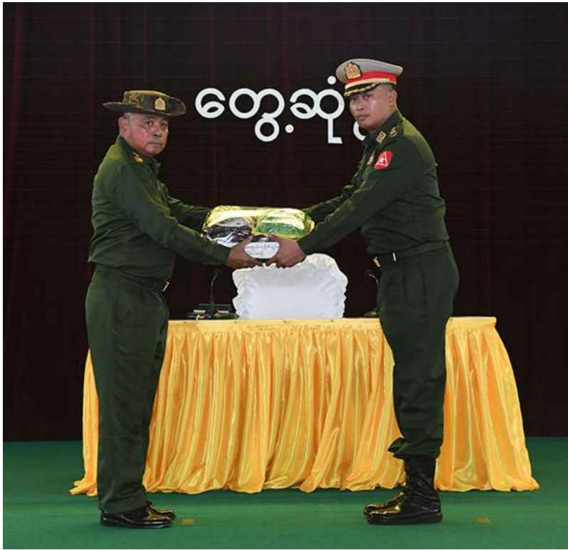
တပ်မတော်ကာကွယ်ရေးဦးစီးချုပ် ဗိုလ်ချုပ်ကြီးရဲဝင်းဦး တပ်နယ်များမှ အရာရှိ၊ စစ်သည်၊ မိသားစုများအတွက် စားသောက်ဖွယ်ရာပစ္စည်းများပေးအပ်ရာ တပ်နယ်မှူးက လက်ခံရယူစဉ်။