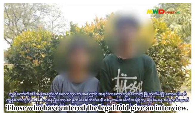
Those who have entered the legal fold give an interview.