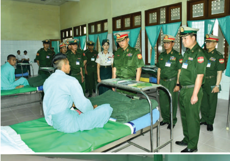
အရှေ့ပိုင်းတိုင်း စစ်ဌာနချုပ် တိုင်းမှူး ဗိုလ်မှူးချုပ် ကျော်နိုင်ဦး ဆေးကုသမှု ခံယူနေသူ တစ်ဦးကို ရင်းရင်းနှီးနှီးမေးမြန်း အားပေးစကား ပြောကြားစဉ်။