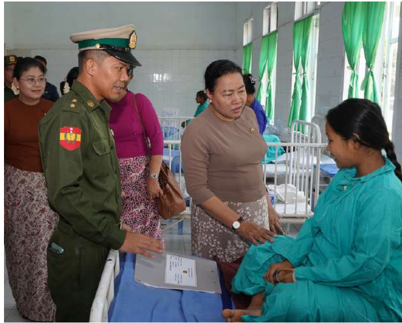
တပ်မတော်ကာကွယ်ရေးဦးစီးချုပ် ဗိုလ်ချုပ်ကြီးရဲဝင်းဦး၏ဇနီး ဒေါ်နီလာ အမျိုးသမီးနှင့် ကလေးကုသဆောင်၌ တက်ရောက်ကုသလျက်ရှိသည့်လူနာများကို ရင်းရင်းနှီးနှီးမေးမြန်းအားပေးစကားပြောကြားစဉ်။

နေပြည်တော် ဧပြီ ၂၄ - တပ်မတော် ကာကွယ်ရေးဦးစီးချုပ် ဗိုလ်ချုပ်ကြီးရဲဝင်းဦးသည် ဇနီး ဒေါ်နီလာ၊ ကာကွယ်ရေးဦးစီးချုပ်ရုံးမှ အဆင့်မြင့် တပ်မတော်အရာရှိကြီးများနှင့် ဇနီးများ၊ ကြိုဂံဒေသတိုင်းစစ်ဌာနချုပ် တိုင်းမှူးနှင့် တာဝန်ရှိသူများလိုက်ပါ၍ ယနေ့နံနက် ပိုင်းတွင် မိုင်းဖြတ်မြို့ရှိ နယ်မြေခံ တပ်မတော်ဆေးရုံ၌ တက်ရောက်ကုသမှု ခံယူလျက်ရှိသည့် အရာရှိ၊ စစ်သည်များ၊ မိသားစုဝင်များ၊ မြန်မာနိုင်ငံရဲတပ်ဖွဲ့ဝင်များ နှင့် ပြည်သူ့စစ်(ဌာန)တပ်ဖွဲ့ဝင်များကို ဦးစီးချုပ်နှင့်အဖွဲ့ဝင်များသည် နယ်မြေခံ သွားရောက်ကြည့်ရှု အားပေးစကားပြော ကြားသည်။