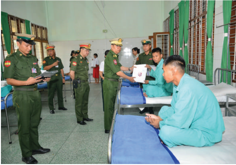
နေပြည်တော် တိုင်းစစ်ဌာနချုပ် တိုင်းမှူး ဗိုလ်ချုပ်ကြည်သိုက် ဆေးကုသမှု ခံယူနေသူတစ်ဦးကို အာဟာရဖြည့်စားသောက်ဖွယ်ရာ များနှင့် ချီးမြှင့်ငွေများ ပေးအပ်စဉ်။