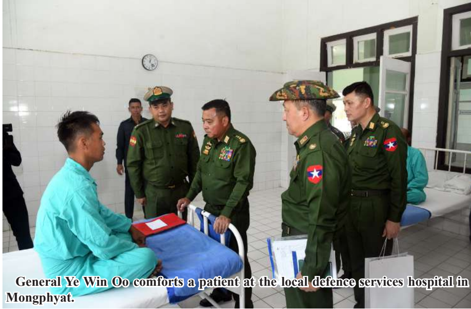
General Ye Win Oo comforts a patient at the local defence services hospital in Mongphyat.