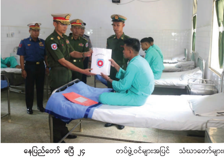
အနောက်ပိုင်း တိုင်းစစ်ဌာနချုပ် တိုင်းမှူး ဗိုလ်မှူးချုပ် ကျော်ဇော ဆေးကုသမှု ခံယူနေသူတစ်ဦးကို အာဟာရဖြည့်စားသောက်ဖွယ်ရာ များနှင့် ချီးမြှင့်ငွေများ ပေးအပ်စဉ်။