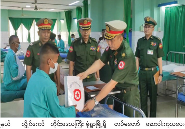
ရန်ကုန်တိုင်း စစ်ဌာနချုပ် တိုင်းမှူး ဗိုလ်မှူးချုပ် တင်မင်းလတ် ဆေးကုသမှု ခံယူနေသူတစ်ဦးကို အာဟာရဖြည့်စားသောက်ဖွယ်ရာ များနှင့် ချီးမြှင့်ငွေများ ပေးအပ်စဉ်။

နေပြည်တော် ဧပြီ ၂၄ တပ်မတော်အနေဖြင့် တိုင်းရင်းသား ပြည်သူများ၏ ကျန်းမာရေးစောင့်ရှောက်မှု လုပ်ငန်းများတွင် နိုင်ငံတော်အစိုးရနှင့် အတူ တစ်ဖက်တစ်လမ်းမှ ကူညီစောင့်ရှောက်မှုများ ဆောင်ရွက်ပေးလျက်ရှိရာ တိုင်းဒေသကြီးနှင့် ပြည်နယ်အသီးသီးရှိ တပ်မတော်ဆေးရုံများ၌ အရာရှိ၊ စစ်သည်၊ မိသားစုများ၊ ပြည်သူ့စစ်မှုထမ်းများ၊ စစ်မှုထမ်းဟောင်းအဖွဲ့ဝင်များ၊ မြန်မာနိုင်ငံရဲတပ်ဖွဲ့ဝင်များ၊ ပြည်သူ့စစ်(ဌာန)