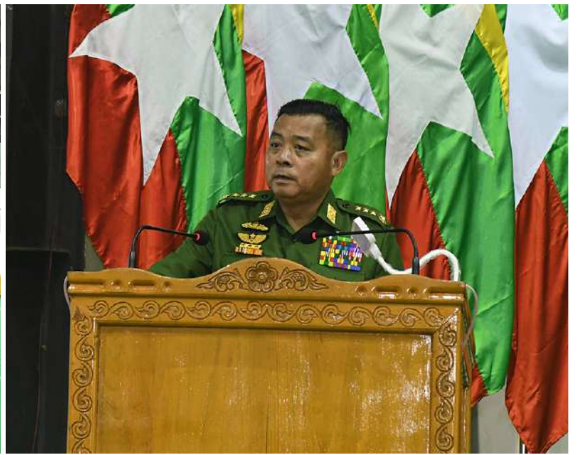
တပ်မတော်ကာကွယ်ရေးဦးစီးချုပ် ဗိုလ်ချုပ်ကြီးရဲဝင်းဦး မိုင်းခတ်နှင့်မိုင်းယန်းတပ်နယ်တို့မှ အရာရှိ၊ စစ်သည်၊ မိသားစုများကို တွေ့ဆုံအမှာစကားပြောကြားစဉ်။