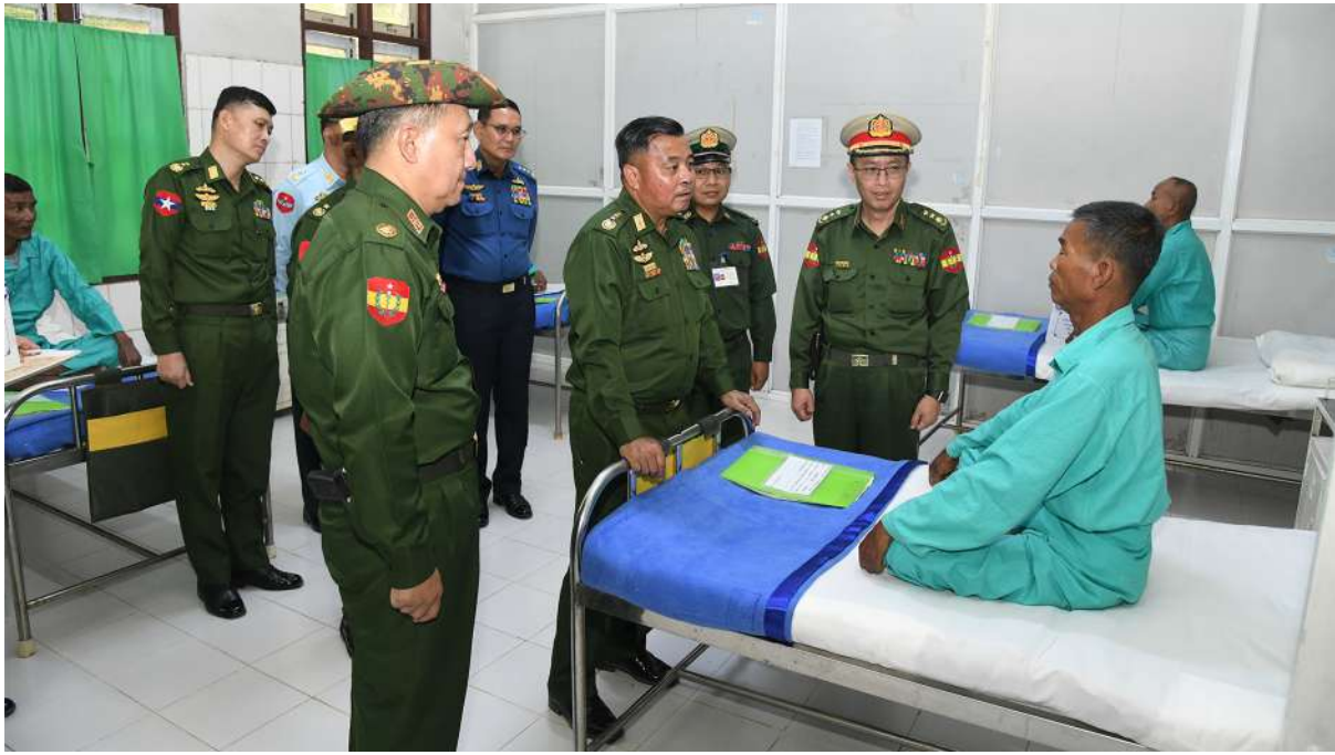
တပ်မတော်ကာကွယ်ရေးဦးစီးချုပ် ဗိုလ်ချုပ်ကြီးရဲဝင်းဦး ဆေးကုသမှုခံယူလျက်ရှိသည့် အရာရှိ၊ စစ်သည်၊ မြန်မာနိုင်ငံ ရဲတပ်ဖွဲ့ဝင်များ၊ ပြည်သူ့စစ်(ဌာန)တပ်ဖွဲ့ဝင်များ တစ်ဦးချင်း၏ ရောဂါဖြစ်ပွားမှုအခြေအနေများ၊ ဆေးဝါးကုသမှုပေးထားသည့်အခြေအနေများနှင့် ကျန်းမာရေးတိုးတက်ကောင်းမွန်မှုအခြေအနေများကို ရင်းရင်းနှီးနှီးမေးမြန်းအားပေးစကားပြောကြားစဉ်။