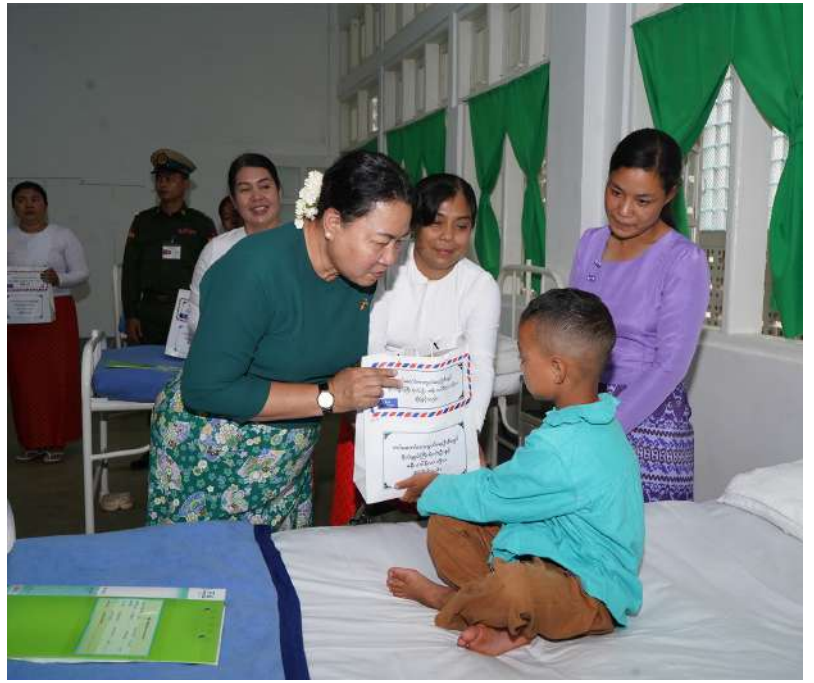
တပ်မတော်ကာကွယ်ရေးဦးစီးချုပ် ဗိုလ်ချုပ်ကြီးရဲဝင်းဦး၏ဇနီး ဒေါ်နီလာ အမျိုးသမီးနှင့် ကလေးကုသဆောင်၌ တက်ရောက်ကုသလျက်ရှိသည့်လူနာများကို ရင်းရင်းနှီးနှီး မေးမြန်းအားပေးစကားပြောကြားပြီး ထောက်ပံ့ပစ္စည်းများပေးအပ်စဉ်။

○ ကြည့်ရှုအားပေးမှအဆက် ထို့နောက် တပ်မတော်ကာကွယ်ရေးဦးစီးချုပ်နှင့်အဖွဲ့ဝင်များသည် နယ်မြေခံတပ်မတော် ဆေးရုံတွင် တက်ရောက်ဆေးကုသမှုခံယူလျက်ရှိသည့် အရာရှိ၊ စစ်သည်၊ မိသားစုများ၊