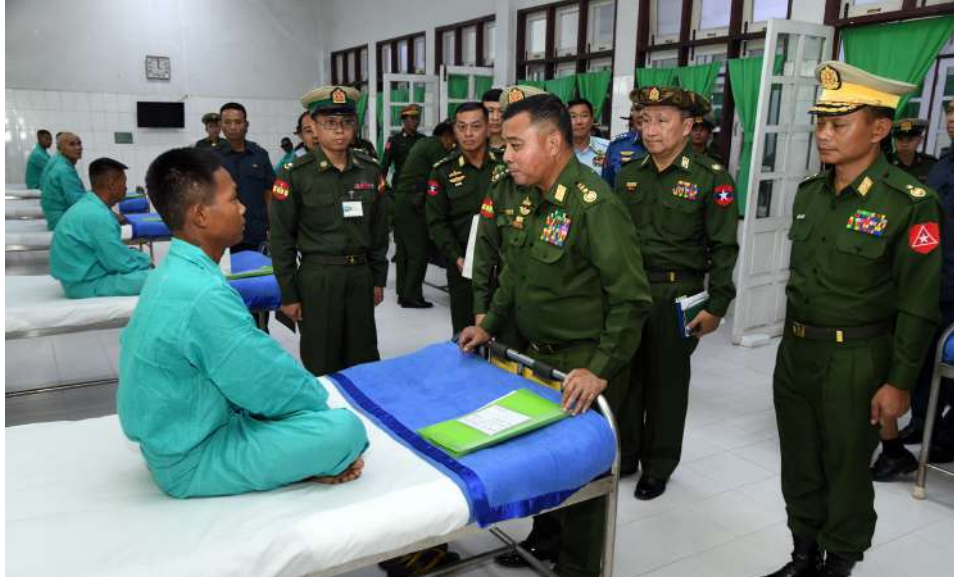
General Ye Win Oo comforts a patient at the local military hospital in Kengtung.