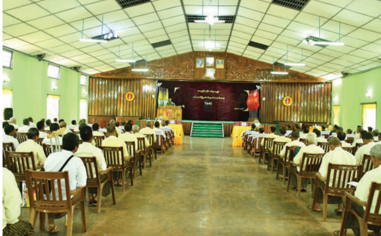
အရှေ့ပိုင်းတိုင်းစစ်ဌာနချုပ် တိုင်းမှူး ဗိုလ်မှူးချုပ်ကျော်နိုင်ဦး ရပ်စောက် မြို့နယ်ရှိ စစ်မှုထမ်းဟောင်းအဖွဲ့ဝင်များကို တွေ့ဆုံအမှာစကားပြောကြားစဉ်။

နေပြည်တော် ဧပြီ ၂၃ ရမ်းပြည်နယ်(တောင်ပိုင်း) ရပ်စောက် မြို့နယ်ရှိ စစ်မှုထမ်းဟောင်းအဖွဲ့ဝင် များတွေ့ဆုံပွဲကို ယနေ့နံနက်ပိုင်းတွင် ဗဟူးတပ်နယ် အောင်ဆန်းခန်းမ၌ ပြုလုပ်ရာ အရှေ့ပိုင်းတိုင်းစစ်ဌာနချုပ်