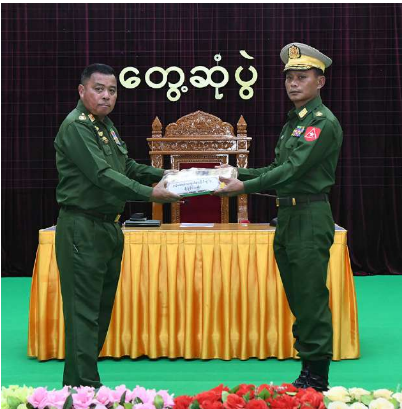
တပ်မတော်ကာကွယ်ရေးဦးစီးချုပ် ဗိုလ်ချုပ်ကြီးရဲဝင်းဦး ကျင်းပတုံတပ်နယ်မှ အရာရှိ၊ စစ်သည်၊ မိသားစုများအတွက် စားသောက်ဖွယ်ရာပစ္စည်းများပေးအပ်ရာ တိုင်းမှူးက လက်ခံရယူစဉ်။