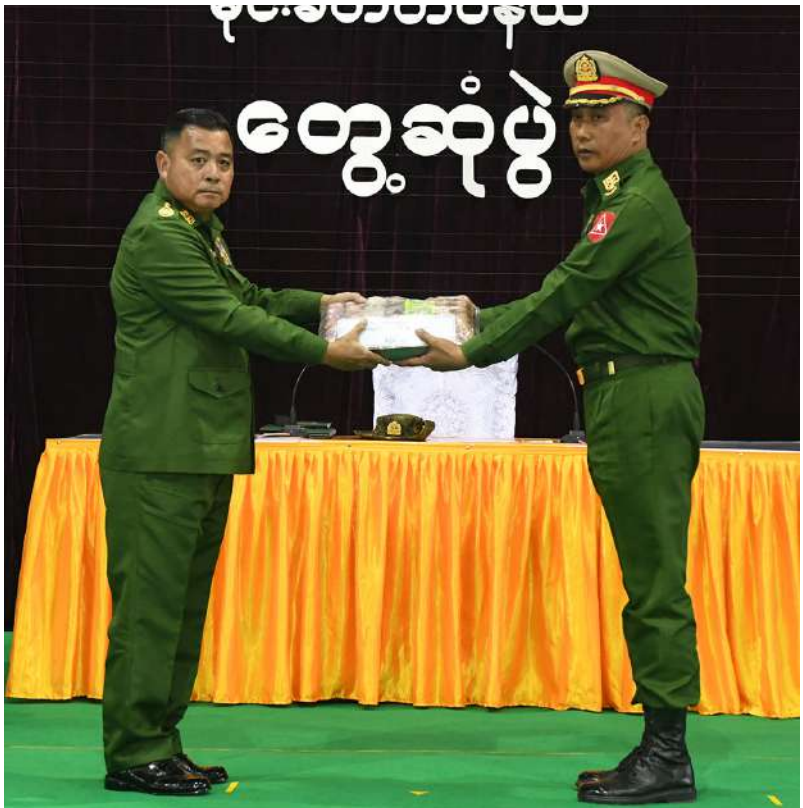
တပ်မတော်ကာကွယ်ရေးဦးစီးချုပ် ဗိုလ်ချုပ်ကြီးရဲဝင်းဦး တပ်နယ်များမှ အရာရှိ၊ စစ်သည်၊ မိသားစုများအတွက် စားသောက်ဖွယ်ရာပစ္စည်းများပေးအပ်ရာ တပ်နယ်မှူးက လက်ခံရယူစဉ်။

လာမည်ဖြစ်ကြောင်း။ အရာရှိ၊ စစ်သည်များအနေဖြင့် မိမိဝင်ငွေနှင့်ထွက်ငွေကို မျှတစွာသုံးစွဲတတ်ရန် လိုအပ်ပြီး တာဝန်ရှိသူများကလည်း သက်သာချောင်ချိမှုများ ဖြည့်ဆည်းဆောင်ရွက်ပေးရန် လိုအပ်မည်ဖြစ်ကြောင်း၊ ဝင်ငွေနှင့်ထွက်ငွေ မျှတစေရေး၊ ခြိုးခြံချွေတာရန် လိုအပ်သကဲ့သို့ မလိုလားအပ်ဘဲ အပိုကုန်ကျနိုင်မည့် အပျော်အပါး၊ လောင်းကစားမှုဆိုင်ရာကိစ္စစသည့် ဆောင်ရန်၊ ရှောင်ရန်အချက်များကို လည်း အရာရှိ၊ စစ်သည်၊ မိသားစုများ လိုက်နာရန်လိုအပ်ကြောင်း။