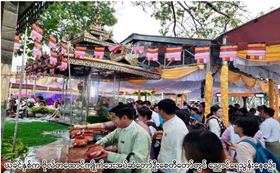
ယခင်နှစ်က ဗိုလ်တထောင်ကျိုက်ဒေးအပ်ဆံတော်ဦးစေတီတော်တွင် ညောင်ရေသွန်းနေစဉ်။

ရန်ကုန် ဧပြီ ၂၃ - ရန်ကုန်တိုင်းဒေသကြီး ဗိုလ်တထောင်မြို့နယ်ရှိ ဗိုလ်တထောင်ကျိုက်ဒေးအပ် ဆံတော်ဦးစေတီတော်တွင် ၅၅ ကြိမ်မြောက် ညောင်ရေသွန်းပွဲတော်ကို ကဆုန်လပြည့်နေ့ (ဧပြီ ၃၀ ရက်) တွင် စည်ကားသိုက်မြိုက်စွာ ကျင်းပမည်ဖြစ်ကြောင်း ဗိုလ်တထောင်ကျိုက်ဒေးအပ် ဆံတော်ဦးစေတီတော် ဘဏ္ဍာတော်ထိန်းဂေါပက အဖွဲ့မှ သိရသည်။ အဆိုပါ ဗိုလ်တထောင်ကျိုက်ဒေးအပ် ဆံတော်ဦးစေတီတော်၏ ၅၅ ကြိမ်မြောက် ညောင်ရေသွန်းပွဲတော်ကို စေတီတော်ရင်ပြင်ရှိ မဟာဗောဓိညောင်ပင်တွင် ကျင်းပပြုလုပ်သွားမည် ဖြစ်ကြောင်း သိရသည်။ "အစီအစဉ်ကတော့ မနက်ပိုင်းမှာ စေတီတော်နဲ့ စေတီတော်ရင်ပြင်မှာရှိတဲ့ ဗုဒ္ဓရုပ်ပွားတော်တွေကို အရုဏ်ဆွမ်းဆက်ကပ်မှာ ဖြစ်ပါတယ်။ အဲဒီနေ့မှာ စေတီတော်ရဲ့ ဩဝါဒါစရိယဆရာတော်တွေနဲ့ ဗိုလ်တထောင်မြို့နယ်အတွင်း ကျောင်းတိုက်အသီးသီးက ဩဝါဒါစရိယ ပဓာနနာယက ဆရာတော် စုစုပေါင်း ၂၂ ပါးကို အရုဏ်ဆွမ်း ဆက်ကပ်ပါမယ်။