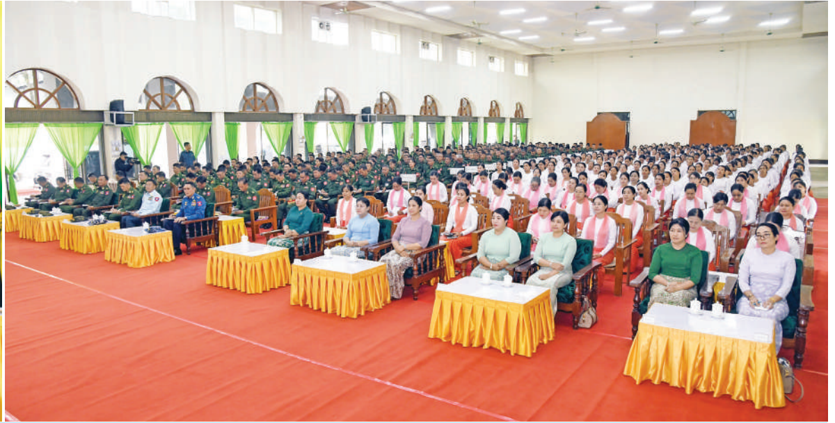
တပ်မတော်ကာကွယ်ရေးဦးစီးချုပ် ဗိုလ်ချုပ်ကြီးရဲဝင်းဦး ကျိုင်းတုံတပ်နယ်မှ အရာရှိ၊ စစ်သည်၊ မိသားစုများကို တွေ့ဆုံအမှာစကားပြောကြားစဉ်။

နေပြည်တော် ဧပြီ ၂၃ ပိုင်းတွင် ကျိုင်းတုံတပ်နယ်မှ အရာရှိ၊ ယနေ့မွန်းလွဲပိုင်းတွင် မိုင်းခတ်နှင့် မိုင်းယန်း သီးခြားစီ တွေ့ဆုံအမှာစကားပြောကြား ကာကွယ်ရေးဦးစီးချုပ်၏ ဇနီး ဒေါ်နီလာ၊ တပ်မတော်ကာကွယ်ရေးဦးစီးချုပ် စစ်သည်၊ မိသားစုများကို တိုင်းစစ်ဌာနချုပ် တပ်နယ်မှ အရာရှိ၊ စစ်သည်၊ မိသားစုများ သည်။ ကာကွယ်ရေးဦးစီးချုပ်(ရေ) ဗိုလ်ချုပ်ကြီးရဲဝင်းဦးသည် ယမန်နေ့မွန်းလွဲ ပြည်ငြိမ်းအေးခန်းမ၌ လည်းကောင်း၊ ကိုမိုင်းခတ်တပ်နယ်ခန်းမ၌လည်းကောင်း အဆိုပါတွေ့ဆုံပွဲသို့ တပ်မတော် စာမျက်နှာ ၁၆ ကော်လံ ၁ ☆