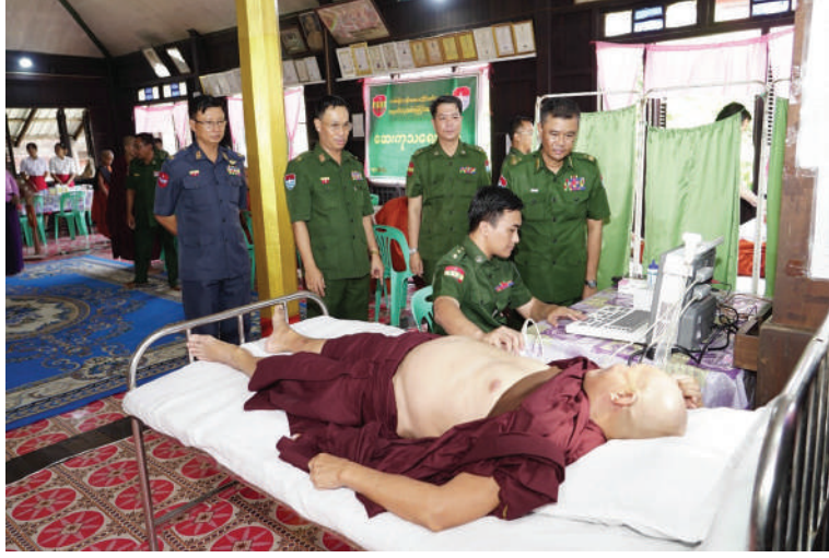
သံဃာတော်များအား ကျန်းမာရေးစောင့်ရှောက်မှုလုပ်ငန်းများ ဆောင်ရွက်နေမှုကို ကမ်းရိုးတန်းဒေသတိုင်းစစ်ဌာနချုပ် တိုင်းမှူး ဗိုလ်ချုပ်ကျော်ကျော်ဟန် ကြည့်ရှု အားပေးစဉ်။