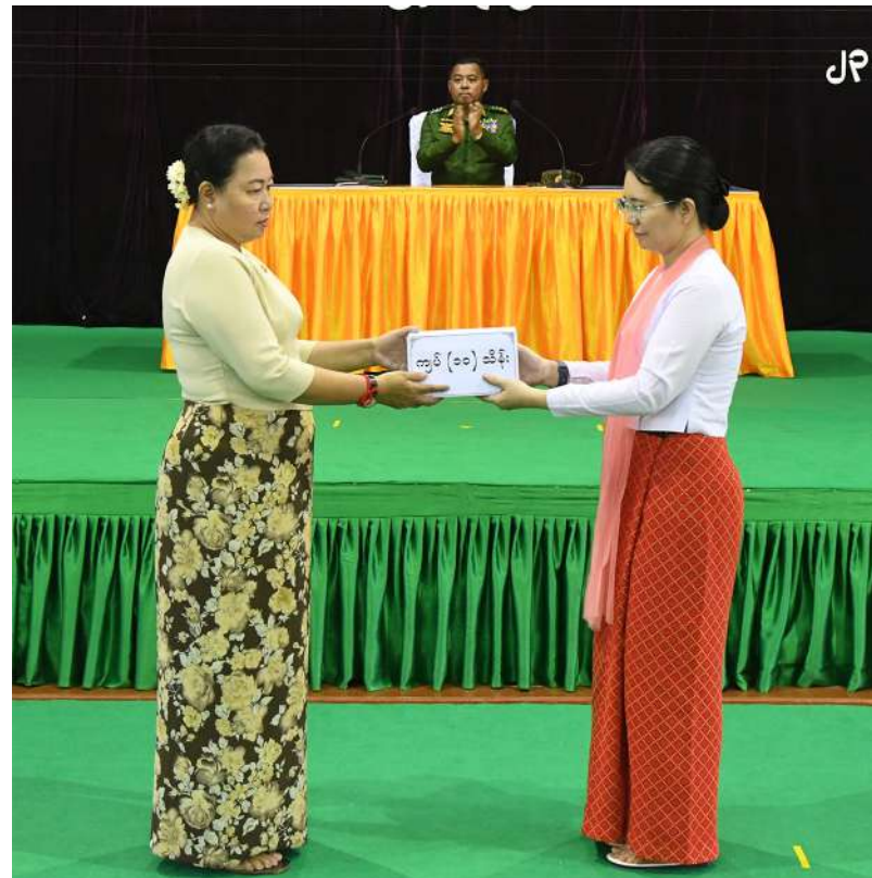
တပ်မတော်ကာကွယ်ရေးဦးစီးချုပ် ဗိုလ်ချုပ်ကြီးရဲဝင်းဦး၏ဇနီး ဒေါ်နီလာ တပ်နယ်များရှိ မိခင်နှင့်ကလေးစောင့်ရှောက်ရေးအသင်းအတွက် ချီးမြှင့်ငွေများပေးအပ်ရာ တပ်နယ်မှူး၏ဇနီးက လက်ခံရယူစဉ်။

ရေးအတွက် နေရေး၊ စားရေး၊ ဝတ်ရေး၊ ကျန်းမာရေးနှင့် အခြားအထွေထွေလိုအပ်ချက်များကို တတ်စွမ်းသရွေ့အမြဲမပြတ် ဖြည့်ဆည်းပေးလျက်ရှိပြီး ထိုက်သင့်သည့် ချီးမြှင့်မှုများနှင့် လိုအပ်သည့်သက်သာ