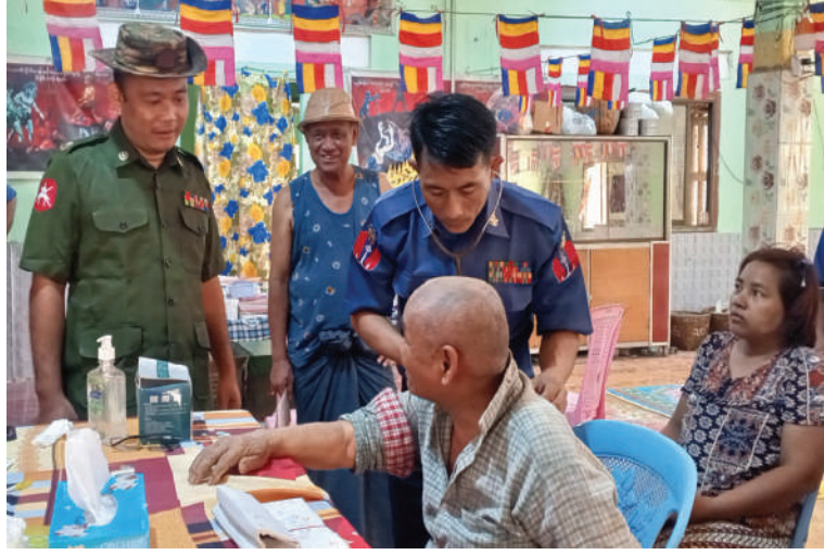
ဒေသခံပြည်သူများအား ကျန်းမာရေးစောင့်ရှောက်မှုလုပ်ငန်းများ ဆောင်ရွက် နေမှုကို ရန်ကုန်တိုင်းစစ်ဌာနချုပ် ဒလတပ်နယ်မှ တာဝန်ရှိသူများက ကြည့်ရှု အားပေးစဉ်။

တိုင်းမှူး ဗိုလ်ချုပ်ကျော်ကျော်ဟန်နှင့် တာဝန်ရှိသူများက သွားရောက်ကြည့်ရှု အားပေးပြီး လိုအပ်သည်များ ပေါင်းစပ် ညှိနှိုင်းဆောင်ရွက်ပေးကာ စာသင် တိုက်ဆရာတော်အား ဖူးမြော်ကြည့်ညို၍ လှူဖွယ်ပစ္စည်းများ ဆက်ကပ်လှူဒါန်း ကြသည်။