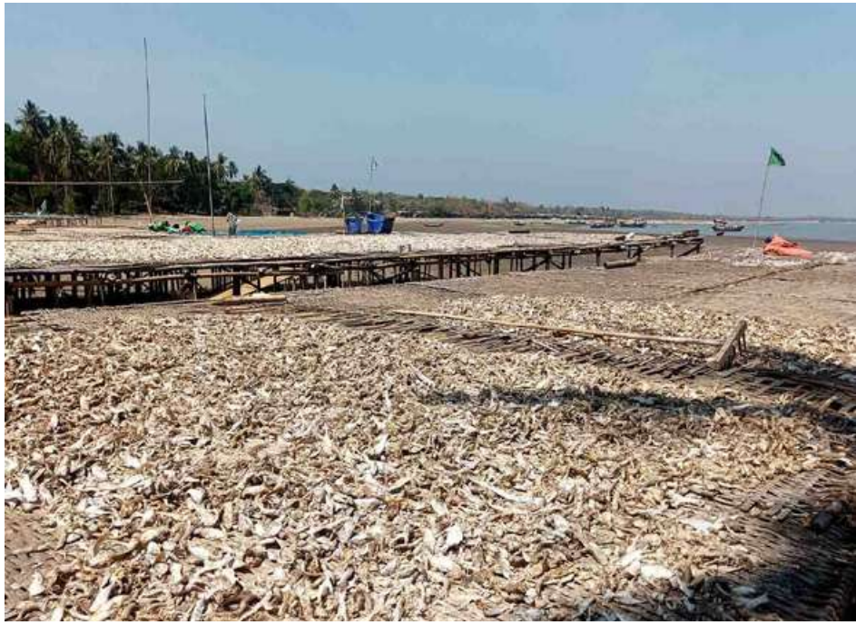
ပင်လယ်ကမ်းစပ်၌ ငါးခြောက်များလှန်းထားမှုကို တွေ့ရစဉ်။

နဲ့သာပြုလုပ်နေကြရတယ်။ ငါးပိတွေ၊ ငံပြာရည် တွေဆိုတာ ပုစွန်လေးတွေကနေ ရရှိကြတာဖြစ် ကြောင်း ဗဟုသုတအဖြစ်သိရှိလိုက်ရတယ်။ ဒါ့ပြင် ပုစွန်ခြောက်တွေက ဘာကြောင့် ဈေးကောင်းနေ တယ်ဆိုတာကိုလဲ ထပ်မံတွေးတောသိရှိလိုက်ရ တယ်။ ကမ်းခြေတစ်လျှောက် သဲသောင်ပြင်တွေမှာ အခြောက်လှန်းထားတဲ့ ငါးတွေ၊ ပုစွန်တွေ အလွန် များပြားနေကြပေမဲ့ ထိန်းသိမ်းစောင့်ကြည့်နေကြ တဲ့ ပိုင်ရှင်တွေမရှိ၊ ခွေးတွေ၊ ကျီးတွေ၊ ငှက်တွေက လာရောက်ဆွဲယူစားသောက်မှုမရှိ၊ ယင်ကောင်တွေ ရစ်ဝဲအုံ့နေတာမျိုးတွေမရှိတာကလဲ အံ့ဩစရာ ကောင်းနေတယ်။ ဒါပေမဲ့ အခြောက်လှန်းထားတဲ့