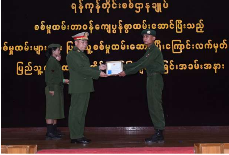
ရန်ကုန်တိုင်း စစ်ဌာနချုပ် တိုင်းမှူး ဗိုလ်မှူးချုပ် တင်မင်းလတ် သတ်မှတ်စစ်မှုထမ်း ကာလပြည့်မြောက် ခဲ့သည့် ပြည်သူ့ စစ်မှုထမ်းများကို ပြည်သူ့စစ်မှုထမ်း တံဆိပ်၊ ဂုဏ်ပြု မှတ်တမ်းလွှာနှင့် ဂုဏ်ပြုချီးမြှင့်ငွေများ ချီးမြှင့်ပေးအပ်စဉ်။

★ ကျောဖုံးမှအဆက် သက်ဆိုင်ရာတိုင်းစစ်ဌာနချုပ် အသီးသီးမှ တိုင်းမှူးများနှင့်တာဝန်ရှိသူများ၊ဌာနဆိုင်ရာ တာဝန်ရှိသူများနှင့် သတ်မှတ်စစ်မှုထမ်း ကာလကို တာဝန်ကျေပွန်စွာထမ်းဆောင်ပြီး မြောက်ခဲ့သည့် ပြည်သူ့စစ်မှုထမ်းများနှင့် ၎င်းတို့၏မိသားစုဝင်များ တက်ရောက် ကြသည်။ အခမ်းအနားများတွင် တိုင်းဒေသကြီး နှင့်ပြည်နယ်ဝန်ကြီးချုပ်များ၊ ကာကွယ်ရေး ဦးစီးချုပ်ရုံး(ကြည်း)မှ တပ်မတော်အရာရှိ