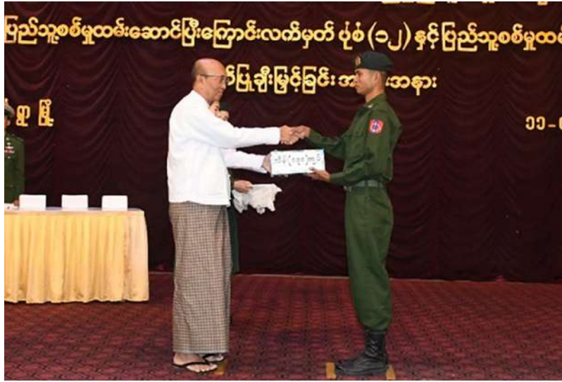
စစ်ကိုင်းတိုင်း ဒေသကြီး ဝန်ကြီးချုပ် ဦးကိုလေး သတ်မှတ်စစ်မှုထမ်း ကာလပြည့်မြောက် ခဲ့သည့် ပြည်သူ့ စစ်မှုထမ်းများကို ပြည်သူ့စစ်မှုထမ်း တံဆိပ်၊ ဂုဏ်ပြု မှတ်တမ်းလွှာနှင့် ဂုဏ်ပြုချီးမြှင့်ငွေများ ချီးမြှင့်ပေးအပ်စဉ်။