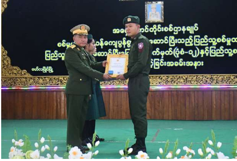
ကာကွယ်ရေး ဦးစီးချုပ်ရုံး(ကြည်း)မှ ဗိုလ်ချုပ် ကျော်လင်းမောင် သတ်မှတ်စစ်မှုထမ်း ကာလပြည့်မြောက် ခဲ့သည့် ပြည်သူ့ စစ်မှုထမ်းများကို ပြည်သူ့စစ်မှုထမ်း တံဆိပ်နှင့်ဂုဏ်ပြု မှတ်တမ်းလွှာများ ချီးမြှင့်ပေးအပ်စဉ်။