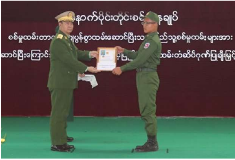
အနောက်ပိုင်း တိုင်းစစ်ဌာနချုပ် တိုင်းမှူး ဗိုလ်ချုပ်ကျော်စွာဦး သတ်မှတ်စစ်မှုထမ်း ကာလပြည့်မြောက် ခဲ့သည့် ပြည်သူ့ စစ်မှုထမ်းများကို ပြည်သူ့စစ်မှုထမ်း တံဆိပ်၊ ဂုဏ်ပြု မှတ်တမ်းလွှာနှင့် ဂုဏ်ပြုချီးမြှင့်ငွေများ ချီးမြှင့်ပေးအပ်စဉ်။