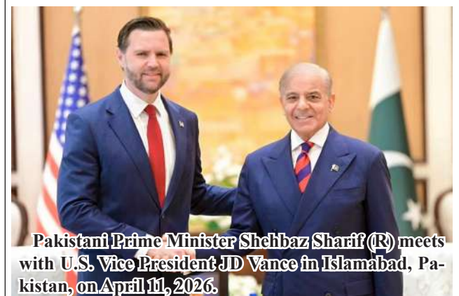
Pakistani Prime Minister Shehbaz Sharif (R) meets with U.S. Vice President JD Vance in Islamabad, Pakistan, on April 11, 2026.

Islamabad April 11 expressed the hope that these Pakistani Prime Minister Shehbaz Sharif on Saturday met with U.S. Vice President JD Vance, according to a statement from the Prime Minister's Office. Vance arrived here on Saturday for talks with the Iranian team to end the recent hostilities in the Middle East region. Commending the commitment of both delegations to engage constructively, Sharif Saturday. On the same day, the prime minister met with the Iranian team arrived earlier Saturday. Xinhua