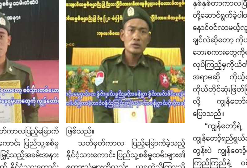
ရန်ကုန်တိုင်းစစ်ဌာနချုပ် ဗိုလ်မှူးချုပ်သူရဇော်လွင်စိုး သတ်မှတ်စစ်မှုထမ်းကာလပြည့် မြောက်ခဲ့သည့် ပြည်သူ့စစ်မှုထမ်းများကို ပြည်သူ့စစ်မှုထမ်းတံဆိပ်၊ဂုဏ်ပြုမှတ်တမ်းလွှာ နှင့် ဂုဏ်ပြုချီးမြှင့်ငွေများ ချီးမြှင့်ပေးအပ်စဉ်။

အတွက် သက်ဆိုင်ရာ တာဝန်ရှိသူများက ပြည်တွင်း၊ပြည်ပ အလုပ်အကိုင်ခန့်အပ် ပေးနိုင်ရေး လုပ်ငန်းကော်မတီများနှင့် ချိတ်ဆက် ၍ လိုအပ်သည်များ ဆက်လက် ဆောင်ရွက်ပေးသွားမည်ဖြစ်ကြောင်း သိရှိ ရသည်။ ထို့ပြင် နိုင်ငံ့တာဝန်ကို ကျေပွန်စွာထမ်း ဆောင်ခဲ့ကြသည့် နိုင်ငံ့သားကောင်းပြည်သူ့ စစ်မှုထမ်းအချို့သည်လည်း နိုင်ငံတော် ကာကွယ်ရေးနှင့် လုံခြုံရေးတာဝန်များ ကို ဆက်လက်ထမ်းဆောင်လိုသည့် အတွက် ကိုယ်တိုင်ဆန္ဒပြု၍ တပ်မတော် တွင် ဆက်လက်တာဝန်ထမ်းဆောင်ကြ သည်များလည်းရှိကြကြောင်း သိရှိ ရသည်။ ယခုကဲ့သို့ နိုင်ငံ့တာဝန်ကို ကျေပွန်စွာ