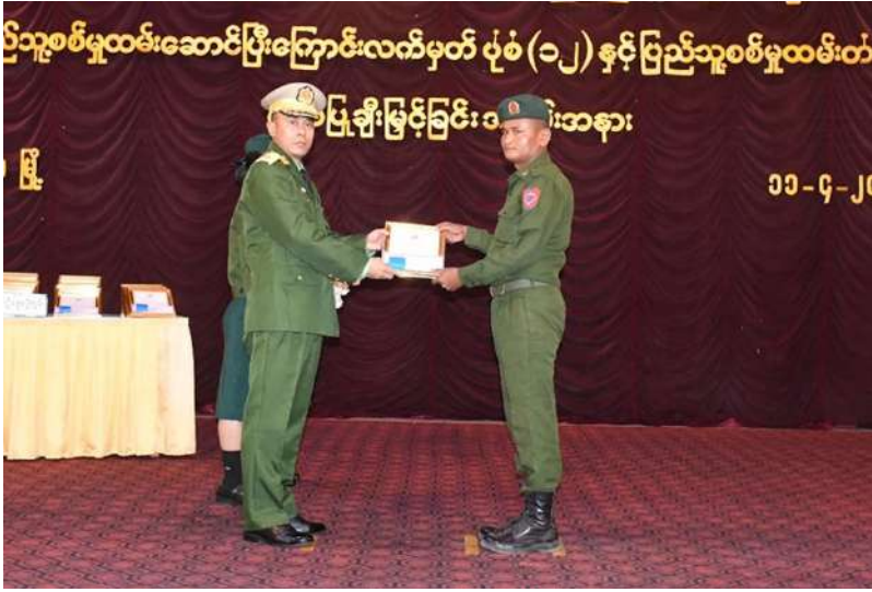
အနောက်မြောက် တိုင်းစစ်ဌာနချုပ် တိုင်းမှူး ဗိုလ်ချုပ်ကျော်သူရ သတ်မှတ်စစ်မှုထမ်း ကာလပြည့်မြောက် ခဲ့သည့် ပြည်သူ့ စစ်မှုထမ်းများကို ပြည်သူ့စစ်မှုထမ်း တံဆိပ်၊ ဂုဏ်ပြု မှတ်တမ်းလွှာနှင့် ဂုဏ်ပြုချီးမြှင့်ငွေများ ချီးမြှင့်ပေးအပ်စဉ်။