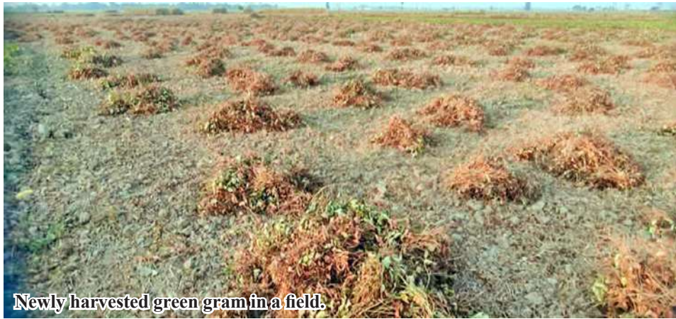
Newly harvested green gram in a field.