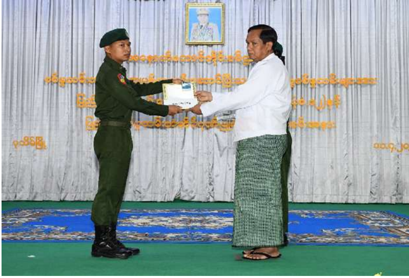
ဧရာဝတီ တိုင်းဒေသကြီး ဝန်ကြီးချုပ် ဦးအေးကျော် သတ်မှတ်စစ်မှုထမ်း ကာလပြည့်မြောက် ခဲ့သည့် ပြည်သူ့ စစ်မှုထမ်းများကို ပြည်သူ့စစ်မှုထမ်း တံဆိပ်၊ ဂုဏ်ပြု မှတ်တမ်းလွှာနှင့် ဂုဏ်ပြုချီးမြှင့်ငွေများ ချီးမြှင့်ပေးအပ်စဉ်။