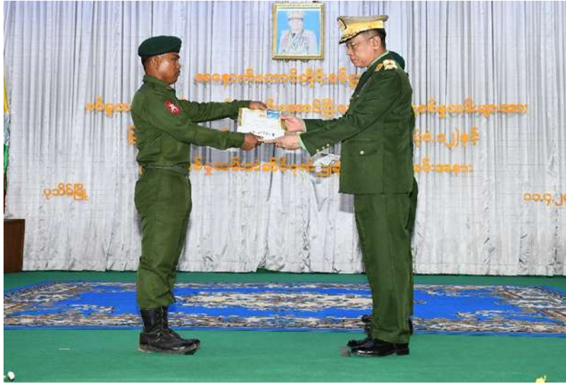
အနောက်တောင် တိုင်းစစ်ဌာနချုပ် တိုင်းမှူး ဗိုလ်ချုပ်စိုးကျော်ထက် သတ်မှတ်စစ်မှုထမ်း ကာလပြည့်မြောက် ခဲ့သည့် ပြည်သူ့ စစ်မှုထမ်းများကို ပြည်သူ့စစ်မှုထမ်း တံဆိပ်၊ ဂုဏ်ပြု မှတ်တမ်းလွှာနှင့် ဂုဏ်ပြုချီးမြှင့်ငွေများ ချီးမြှင့်ပေးအပ်စဉ်။