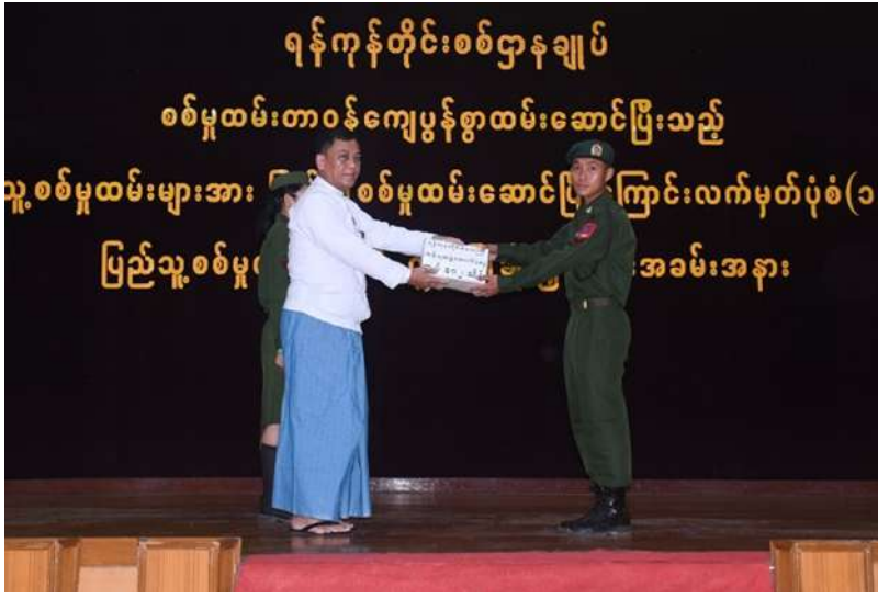
ရန်ကုန်တိုင်း ဒေသကြီး ဝန်ကြီးချုပ် ဦးအောင်နိုင်သူ သတ်မှတ်စစ်မှုထမ်း ကာလပြည့်မြောက် ခဲ့သည့် ပြည်သူ့ စစ်မှုထမ်းများကို ပြည်သူ့စစ်မှုထမ်း တံဆိပ်၊ ဂုဏ်ပြု မှတ်တမ်းလွှာနှင့် ဂုဏ်ပြုချီးမြှင့်ငွေများ ချီးမြှင့်ပေးအပ်စဉ်။