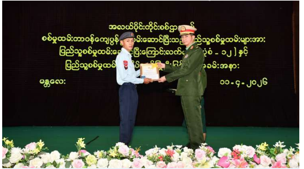
အလယ်ပိုင်းတိုင်းစစ်ဌာနချုပ် တိုင်းမှူး ဗိုလ်မှူးချုပ်အောင်ဌေး သတ်မှတ်စစ်မှုထမ်းကာလပြည့်မြောက်ခဲ့သည့် ပြည်သူ့စစ်မှုထမ်းများကို ပြည်သူ့စစ်မှုထမ်းတံဆိပ်၊ ဂုဏ်ပြုမှတ်တမ်းလွှာနှင့် ဂုဏ်ပြုချီးမြှင့်ငွေများ ချီးမြှင့်ပေးအပ်စဉ်။

နေပြည်တော် ဧပြီ ၁၁ - သမ္မတမြန်မာနိုင်ငံတော် ဖွဲ့စည်းပုံအခြေခံ ခန္ဓာအလျောက် စိတ်အားထက်သန်စွာ ထိုသို့ တာဝန်ကျေပွန်စွာထမ်းဆောင် ဌာနချုပ်အသီးသီး၌ ကျင်းပပြုလုပ်ရာ “နိုင်ငံတစ်နိုင်ငံ၏ လွတ်လပ်ရေး၊ ဥပဒေ (၂၀၀၈ ခုနှစ်)ပါ ပြဋ္ဌာန်းချက်များ ပါဝင်စာရင်းပေးပြီး တာဝန်ထမ်းဆောင်ခဲ့ ခဲ့ကြသည့် နိုင်ငံ့သားကောင်းပြည်သူ့စစ်မှု တိုင်းဒေသကြီးနှင့် ပြည်နယ်များမှ အချုပ်အခြာအာဏာနှင့် နယ်မြေတည်တံ့ ကို လက်တွေ့အကောင်အထည်ဖော်ခဲ့ပြီး ကြသော ပြည်သူ့စစ်မှုထမ်းများသည် ထမ်းများအား ပြည်သူ့စစ်မှုထမ်းဆောင် ဝန်ကြီးချုပ်များ၊ ကာကွယ်ရေးဦးစီးချုပ်ရုံး၊ ခိုင်မြဲရေးအတွက် နိုင်ငံ့သားတိုင်းတွင် ပြည်သူ့စစ်မှုထမ်းဥပဒေအရ ပြည်သူ့ ယခုအခါ သတ်မှတ်စစ်မှုထမ်းကာလ ပြီးကြောင်းလက်မှတ်ချီးမြှင့်ပေးအပ်ခြင်း (ကြည်း)မှ တပ်မတော်အရာရှိကြီးများ၊ တာဝန်ရှိသည်”ဟူသည့် ပြည်ထောင်စု စစ်မှုထမ်း အမှတ်စဉ်(၁/၂၀၂၄)တွင် မိမိ ပြည့်မြောက်ခဲ့ပြီဖြစ်သည်။ အခမ်းအနားများကို ယနေ့တွင် တိုင်းစစ် စာမျက်နှာ ၁၆ ကော်လံ ၁ ☆