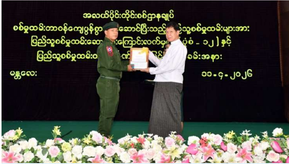
မန္တလေးတိုင်းဒေသကြီးဝန်ကြီးချုပ် ဦးမျိုးအောင် သတ်မှတ်စစ်မှုထမ်းကာလပြည့်မြောက်ခဲ့သည့် ပြည်သူ့စစ်မှုထမ်းများကို ပြည်သူ့စစ်မှုထမ်းတံဆိပ်၊ ဂုဏ်ပြုမှတ်တမ်းလွှာနှင့် ဂုဏ်ပြုချီးမြှင့်ငွေများ ချီးမြှင့်ပေးအပ်စဉ်။