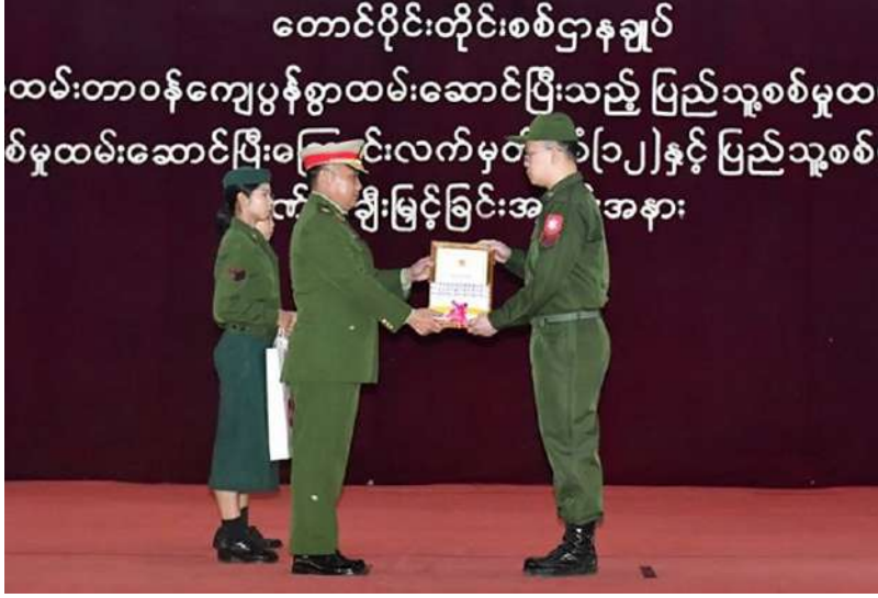
တောင်ပိုင်းတိုင်းစစ်ဌာနချုပ် ဗိုလ်မှူးချုပ်သူရဇော်လွင်စိုး သတ်မှတ်စစ်မှုထမ်းကာလပြည့် မြောက်ခဲ့သည့် ပြည်သူ့စစ်မှုထမ်းများကို ပြည်သူ့စစ်မှုထမ်းတံဆိပ်၊ဂုဏ်ပြုမှတ်တမ်းလွှာ နှင့် ဂုဏ်ပြုချီးမြှင့်ငွေများ ချီးမြှင့်ပေးအပ်စဉ်။