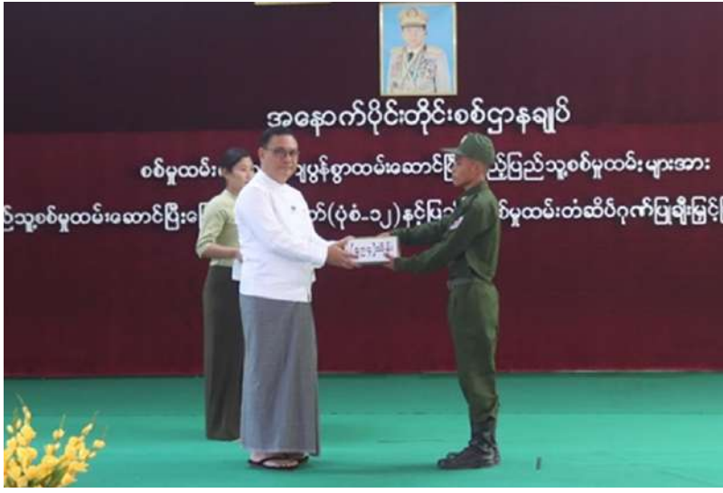
ရခိုင်ပြည်နယ် ဝန်ကြီးချုပ် ဦးနိုင်ဦး သတ်မှတ်စစ်မှုထမ်း ကာလပြည့်မြောက် ခဲ့သည့် ပြည်သူ့ စစ်မှုထမ်းများကို ပြည်သူ့စစ်မှုထမ်း တံဆိပ်၊ ဂုဏ်ပြု မှတ်တမ်းလွှာနှင့် ဂုဏ်ပြုချီးမြှင့်ငွေများ ချီးမြှင့်ပေးအပ်စဉ်။