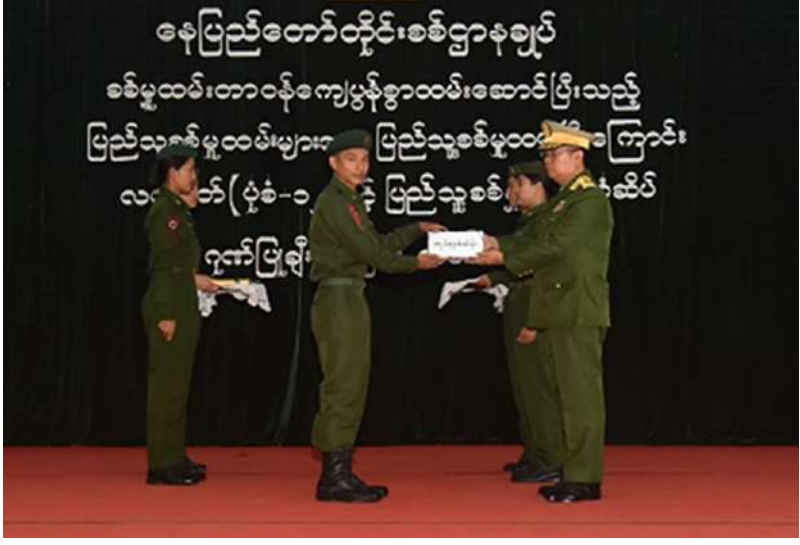
နေပြည်တော် တိုင်းစစ်ဌာနချုပ် တိုင်းမှူး ဗိုလ်ချုပ်ကြည်သိုက် သတ်မှတ်စစ်မှုထမ်း ကာလပြည့်မြောက် ခဲ့သည့် ပြည်သူ့ စစ်မှုထမ်းများကို ပြည်သူ့စစ်မှုထမ်း တံဆိပ်၊ ဂုဏ်ပြု မှတ်တမ်းလွှာနှင့် ဂုဏ်ပြုချီးမြှင့်ငွေများ ချီးမြှင့်ပေးအပ်စဉ်။