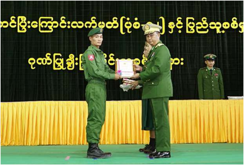
ကမ်းရိုးတန်းဒေသ တိုင်းစစ်ဌာနချုပ် တိုင်းမှူး ဗိုလ်ချုပ် ကျော်ကျော်ဟန် သတ်မှတ်စစ်မှုထမ်း ကာလပြည့်မြောက် ခဲ့သည့် ပြည်သူ့ စစ်မှုထမ်းများကို ပြည်သူ့စစ်မှုထမ်း တံဆိပ်၊ ဂုဏ်ပြု မှတ်တမ်းလွှာနှင့် ဂုဏ်ပြုချီးမြှင့်ငွေများ ချီးမြှင့်ပေးအပ်စဉ်။