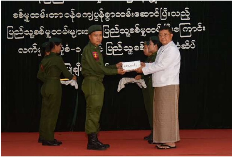
နေပြည်တော် ကောင်စီဥက္ကဋ္ဌ ဦးကဲမြင့်သန်း သတ်မှတ်စစ်မှုထမ်း ကာလပြည့်မြောက် ခဲ့သည့် ပြည်သူ့ စစ်မှုထမ်းများကို ပြည်သူ့စစ်မှုထမ်း တံဆိပ်၊ ဂုဏ်ပြု မှတ်တမ်းလွှာနှင့် ဂုဏ်ပြုချီးမြှင့်ငွေများ ချီးမြှင့်ပေးအပ်စဉ်။