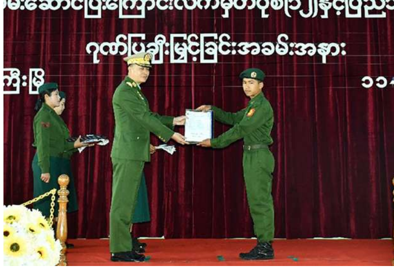
ကာကွယ်ရေး ဦးစီးချုပ်ရုံး(ကြည်း)မှ ဒုတိယဗိုလ်ချုပ်ကြီး ဇော်မင်းလတ် သတ်မှတ်စစ်မှုထမ်း ကာလပြည့်မြောက် ခဲ့သည့် ပြည်သူ့ စစ်မှုထမ်းများကို ပြည်သူ့စစ်မှုထမ်း တံဆိပ်နှင့်ဂုဏ်ပြု မှတ်တမ်းလွှာများ ချီးမြှင့်ပေးအပ်စဉ်။