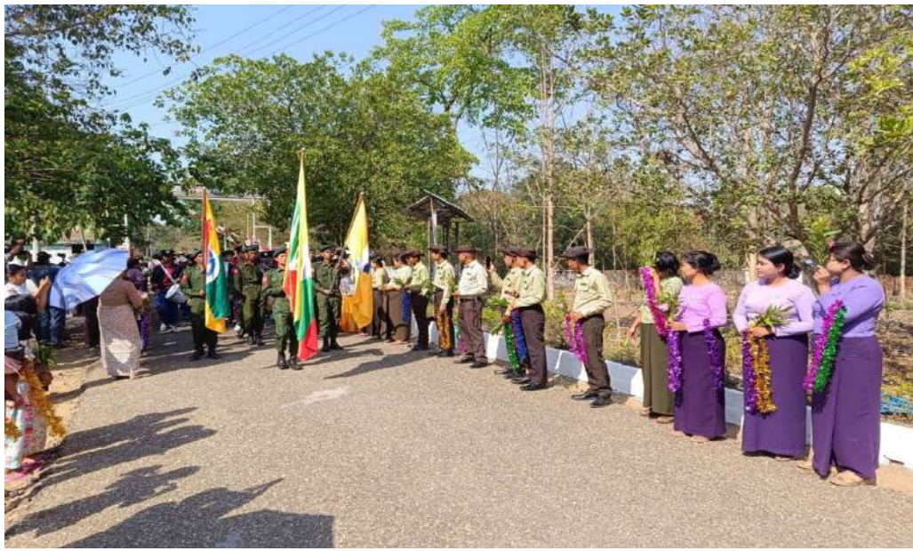
နိုင်ငံတော်တည်ငြိမ်ရေးနှင့် နယ်မြေအေးချမ်းသာယာရေးအတွက် စစ်ဆင်ရေးတာဝန်များကို ထမ်းဆောင်ခဲ့သည့် ရှေ့တန်းပြန် နိုင်ငံ့သားကောင်းတပ်မတော်သားများကို သောင်းသောင်းဖြဖြဂုဏ်ပြုကြိုဆိုစဉ်။

နေပြည်တော် ဧပြီ ၁၁ - နိုင်ငံတော်တည်ငြိမ်ရေးနှင့် နယ်မြေအေးချမ်း သာယာရေးတိုင်းရင်းသားပြည်သူများ စိတ်အေးချမ်း သာစွာ နေထိုင်လုပ်ကိုင်စားသောက်နိုင်ရေးနှင့် အသက်အိုးအိမ်စည်းစိမ်ဥစ္စာ လုံခြုံမှုရှိစေရေး အတွက်ဧရာဝတီတိုင်းဒေသကြီးသားပေါင်းကလေး ဒေသတစ်ဝိုက် နယ်မြေလုံခြုံရေးတာဝန်များနှင့် စစ်ဆင်ရေးတာဝန်များကို နေ့မအားညမအား စွမ်းစွမ်းတမ်းတမ်းဆောင်ခဲ့သော ရှေ့တန်း ပြန် နိုင်ငံ့သားကောင်းတပ်မတော်သားများ ဂုဏ်ပြု ကြိုဆိုခြင်းကို ယနေ့ညနေပိုင်းတွင် ဧရာဝတီ တိုင်းဒေသကြီး မြန်အောင်မြို့နယ်ရှိ နယ်မြေခံ တပ်ရင်း၌ပြုလုပ်ရာ အနောက်တောင်တိုင်းစစ်ဌာန ချုပ်မှ တာဝန်ရှိသူများ၊ ဌာနဆိုင်ရာတာဝန်ရှိသူများ၊ လူမှုရေးအသင်းအဖွဲ့များနှင့် ဒေသခံပြည်သူများက အောင်သပြေခက်များအိုးစည်ဒိုးပတ်အတီးအမှုတ်၊ အက၊အခုန်များဖြင့် ဝမ်းမြောက်စွာသောင်းသောင်း ဖြဖြတက်ရောက်ကြိုဆိုဂုဏ်ပြုခဲ့ကြကြောင်း သတင်း ရရှိသည်။ (၅၀၁)