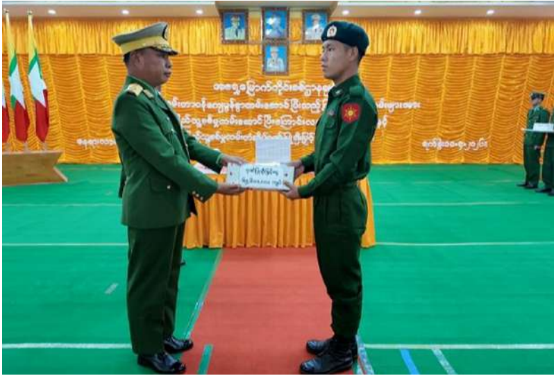
အရှေ့မြောက် တိုင်းစစ်ဌာနချုပ် တိုင်းမှူး ဗိုလ်ချုပ်အေးမင်းဦး သတ်မှတ်စစ်မှုထမ်း ကာလပြည့်မြောက် ခဲ့သည့် ပြည်သူ့ စစ်မှုထမ်းများကို ပြည်သူ့စစ်မှုထမ်း တံဆိပ်၊ ဂုဏ်ပြု မှတ်တမ်းလွှာနှင့် ဂုဏ်ပြုချီးမြှင့်ငွေများ ချီးမြှင့်ပေးအပ်စဉ်။