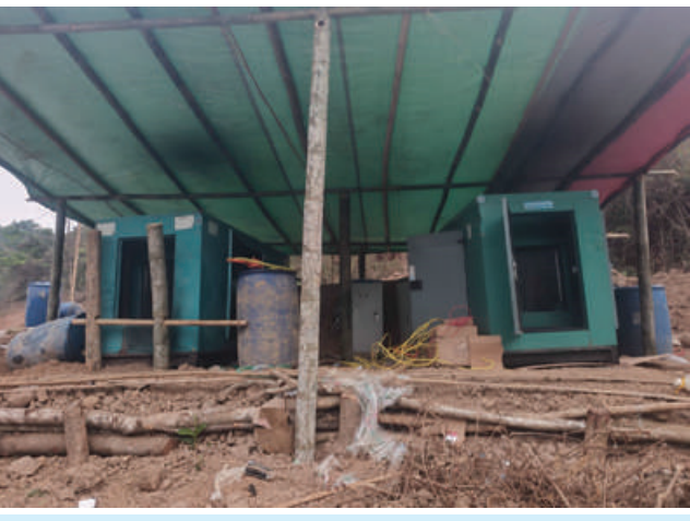
တန့်ယန်းမြို့နယ်အတွင်း အွန်လိုင်းလိမ်လည်လောင်းကစားမှု ကျူးလွန်ရာတွင် အသုံးပြုသည့် မီးစက်နှစ်လုံး သိမ်းဆည်းရမိမှု မှတ်တမ်းဓာတ်ပုံ။