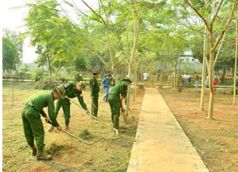
အရှေ့ပိုင်းတိုင်းစစ်ဌာနချုပ်မှ နယ်မြေခံတပ်မတော်သားများက ပြည်သူ့ဆေးရုံ၌ စုပေါင်း သန့်ရှင်းရေးဆောင်ရွက်ကြစဉ်။

ကျန်းမာရေး အသိပညာပေးလက်ကမ်း များနှင့် တပ်နယ်အသီးသီးမှ တာဝန်ရှိ စာစောင်များ ဖြန့်ဝေပေးခြင်းများကို စုပေါင်း သူများက သွားရောက်ကြည့်ရှုအားပေးပြီး လိုအပ်သည်များ ညှိနှိုင်းဆောင်ရွက်ပေးခဲ့ ဆောင်ရွက်ကြသည်။ ယင်းသို့ ဆောင်ရွက်နေမှုများကို ကြောင်း သတင်းရရှိသည်။ (၅၀၁)