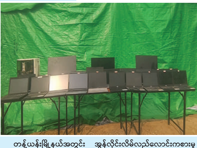
တန့်ယန်းမြို့နယ်အတွင်း အွန်လိုင်းလိမ်လည်လောင်းကစားမှု ကျူးလွန်ရာတွင် အသုံးပြုသည့် All in one ကွန်ပျူတာ နှစ်လုံး၊ Desktop တစ်စုံ၊ Laptop ၂၁ လုံး သိမ်းဆည်းရမိသည့် မှတ်တမ်းဓာတ်ပုံ။