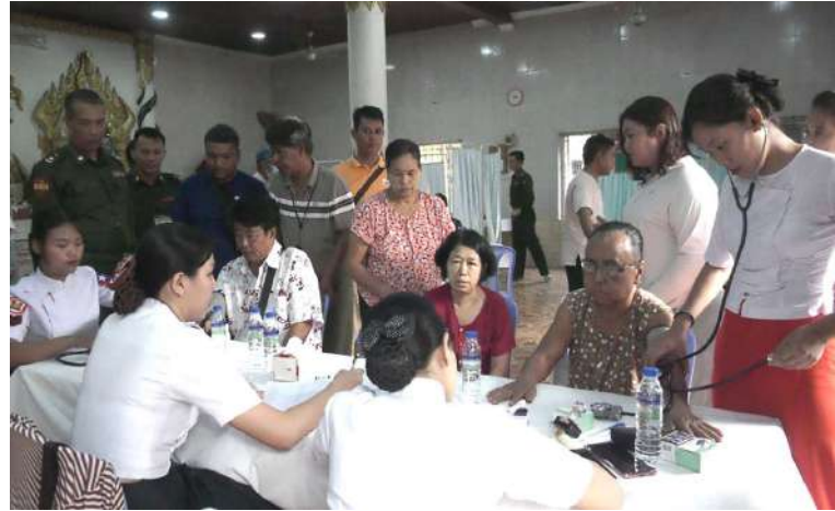
အလယ်ပိုင်းတိုင်းစစ်ဌာနချုပ် နယ်မြေခံဆေးကုသရေးအဖွဲ့က ဒေသခံပြည်သူများကို ကျန်းမာရေးစောင့်ရှောက်မှုလုပ်ငန်းများ ဆောင်ရွက်ပေးစဉ်။

နေပြည်တော် ဧပြီ ၄ တပ်မတော်အနေဖြင့် ပြည်သူ့လူထု၏ ကျန်းမာရေးကဏ္ဍ တိုးတက်မြှင့်တင်ပေးရန်အတွက် ကျန်းမာရေးစောင့်ရှောက်မှုလုပ်ငန်းများတွင် တစ်ဖက်တစ်လမ်းမှ ကူညီစောင့်ရှောက်မှုများ ဆောင်ရွက်ပေးလျက်ရှိရာ ယနေ့နံနက်ပိုင်းတွင် အရှေ့ပိုင်းတိုင်းစစ်ဌာနချုပ် နယ်လှည့်ဆေးကုသရေးအဖွဲ့က ရှမ်းပြည်နယ် (တောင်ပိုင်း) တောင်ကြီးမြို့ မင်္ဂလာဦးရပ်ကွက် အရိယာသံဃာ့ကျောင်းတိုက်ရှိ သံဃာတော်များအား အဆိုပါကျောင်းတိုက်၌ အခြေပြု၍ ကျန်းမာရေးစောင့်ရှောက်မှုလုပ်ငန်းများ ဆောင်ရွက်ပေးသည်။