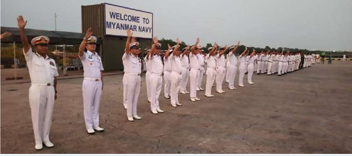
ချစ်ကြည်ရေးခရီးအလည်အပတ်ရောက်ရှိနေသည့် ထိုင်းဘုရင့်ရေတပ်မှ စစ်ရေယာဉ် HTMS Kraburi (FFG-457) ကို တပ်မတော်(ရေ)မှ အရာရှိကြီးများ၊ အရာရှိ၊ စစ်သည်များနှင့် မြန်မာနိုင်ငံဆိုင်ရာ ထိုင်းရေတပ်စစ်သံမှူးတို့က ပို့ဆောင်နှုတ်ဆက်စဉ်။