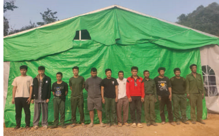
တန့်ယန်းမြို့နယ်အတွင်း အွန်လိုင်းလိမ်လည်လောင်းကစားမှုကျူးလွန်သူ မြန်မာနိုင်ငံသား အမျိုးသား ၁၂ ဦး ဖမ်းဆီးရမိမှုမှတ်တမ်းဓာတ်ပုံ။

အဆိုပါ အွန်လိုင်းလိမ်လည်လောင်း ကစားမှုများ လုပ်ကိုင်လျက်ရှိသည့် ဖမ်းဆီးရမိသူများကို လိုအပ်သည့် စစ်ဆေးမှုများ ဆောင်ရွက်ပြီးစီးပါက တည်ဆဲဥပဒေများနှင့်အညီ ထိရောက် ပြင်းထန်စွာ အရေးယူဆောင်ရွက်သွားမည် ဖြစ်ပြီး သိမ်းဆည်းရမိဆက်စပ်ပစ္စည်း များကို လုပ်ထုံးလုပ်နည်းများနှင့်အညီ ဆက်လက်ဆောင်ရွက် သွားမည်ဖြစ် ကြောင်း သိရသည်။