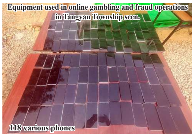
Equipment used in online gambling and fraud operations in Tangyan Township seen.