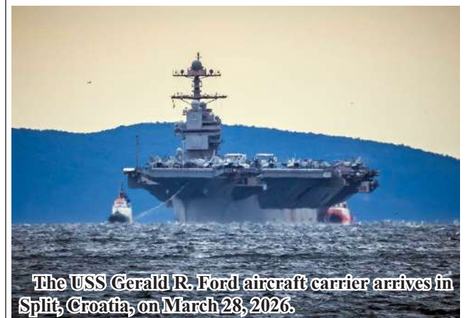
The USS Gerald R. Ford aircraft carrier arrives in Split, Croatia, on March 28, 2026.

During this year's winter crop planting season, the relevant township agriculture department has been working with farmers to provide them with good quality seeds, inputs, and post-harvest technology to improve the yield and quality of green grams. 206