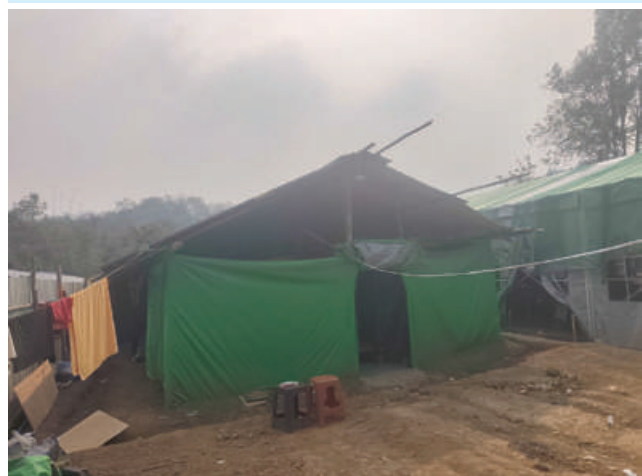
တန့်ယန်းမြို့နယ်အတွင်း အွန်လိုင်းလိမ်လည်လောင်းကစားမှု ကျူးလွန်ရာတွင်အသုံးပြုသည့် လူနေအိပ်ဆောင်ကို တွေ့ရစဉ်။

နိုင်ငံတော်အနေဖြင့် အွန်လိုင်း လိမ်လည် လောင်းကစားမှုကျူးလွန်ခြင်း များပျောက်စေရေးနှင့် မြန်မာနိုင်ငံ အတွင်း အခြေချလုပ်ကိုင်နိုင်မှုမရှိစေရေး အတွက် အိမ်နီးချင်းနိုင်ငံများ၊ ဒေသတွင်း နိုင်ငံများ၊ နိုင်ငံတကာအဖွဲ့အစည်း များနှင့်ပူးပေါင်း၍ အွန်လိုင်းလိမ်လည် လောင်းကစားမှု တိုက်ဖျက်ရေးလုပ်ငန်းစဉ် များကို တက်ကြွစွာဆက်လက်ဆောင်ရွက် လျက်ရှိကြောင်း သတင်းရရှိသည်။ (၅၀၁)