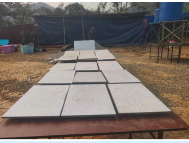
တန့်ယန်းမြို့နယ်အတွင်း အွန်လိုင်းလိမ်လည်လောင်းကစားမှု ကျူးလွန်ရာတွင် အသုံးပြုသည့် Starlink ၁၆ ခု သိမ်းဆည်းရမိမှု မှတ်တမ်းဓာတ်ပုံ။