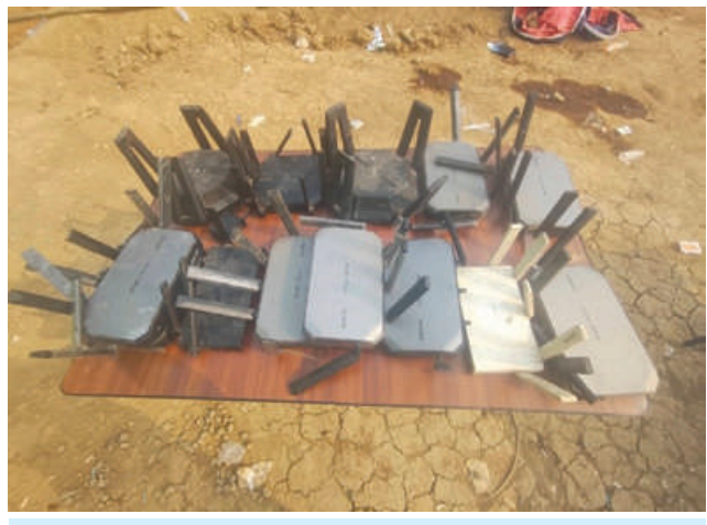
တန့်ယန်းမြို့နယ်အတွင်း အွန်လိုင်းလိမ်လည်လောင်းကစားမှု ကျူးလွန်ရာတွင် အသုံးပြုသည့် Wireless Router ၁၃ လုံး သိမ်းဆည်း ရမိမှု မှတ်တမ်းဓာတ်ပုံ။