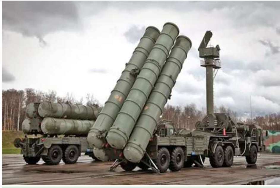
S - 400 လေကြောင်းရန်ကာကွယ်ရေးစနစ်ကို တွေ့ရစဉ်။