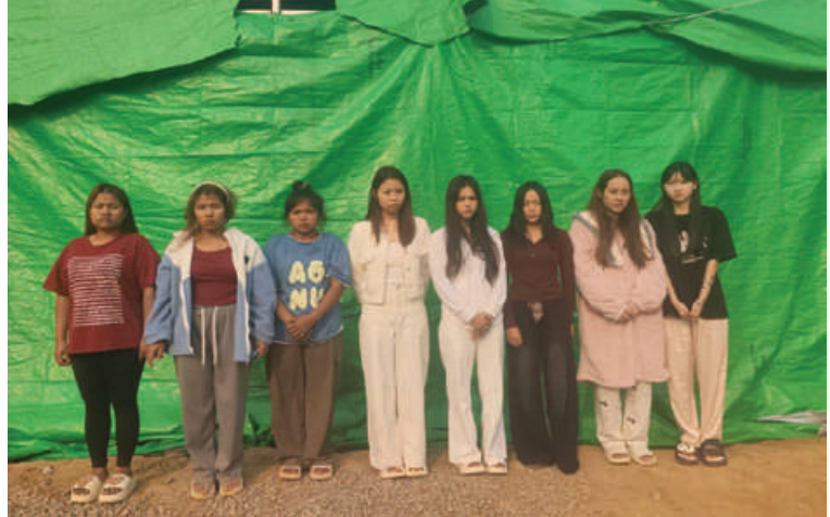
တန့်ယန်းမြို့နယ်အတွင်း အွန်လိုင်းလိမ်လည်လောင်းကစားမှုကျူးလွန်သူ မြန်မာနိုင်ငံသား အမျိုးသမီး ရှစ်ဦး ဖမ်းဆီးရမိမှုမှတ်တမ်းဓာတ်ပုံ။