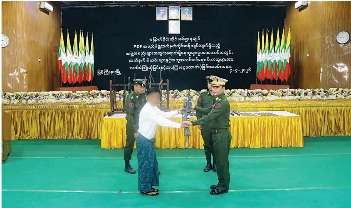
မြောက်ပိုင်းတိုင်းစစ်ဌာနချုပ် တိုင်းမှူး ဗိုလ်ချုပ်အောင်ဇော်ထွေးထံ ဥပဒေဘောင်အတွင်း ပြန်လည်ဝင်ရောက်လာသူတစ်ဦးက လက်နက်အပ်နှံစဉ်။

နေပြည်တော် ဧပြီ ၄ များကို ဥပဒေဘောင်အတွင်းသို့ ပြန်လည် တပ်မတော်၏ ငြိမ်းချမ်းရေးလုပ်ငန်းစဉ် နိုင်ငံတော်အစိုးရသည် PDF အပါဝင်ရောက်ရန် ဖိတ်ခေါ်၍ ဥပဒေဘောင် များကို နားလည်သဘောပေါက်လာသည့် အဝင် အဖွဲ့အစည်းအမျိုးမျိုးအမည်ခံ၍ အတွင်းသို့ ပြန်လည်ဝင်ရောက်လာကြသူ KIA၊ KPDF နှင့် PDF အမည်ခံအဖွဲ့မှ အဖွဲ့ဝင် လက်နက်ကိုင် ဆန့်ကျင်လျက်ရှိသည့် များကိုလည်း လိုအပ်သည့်ကူညီပံ့ပိုးမှုများ အမျိုးသား ရှစ်ဦးတို့သည် အဖွဲ့အစည်းများအတွင်း ရောက်ရှိနေသူ ဆောင်ရွက်ပေးလျက်ရှိရာ နိုင်ငံတော်နှင့် စာမျက်နှာ ၁၆ ကော်လံ ၁ ☆