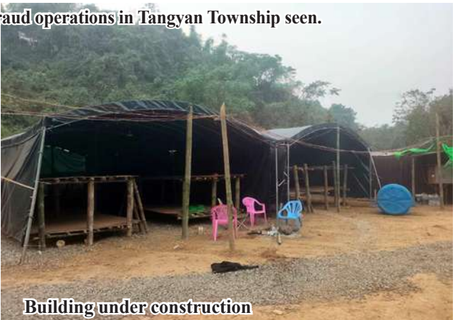
Building under construction