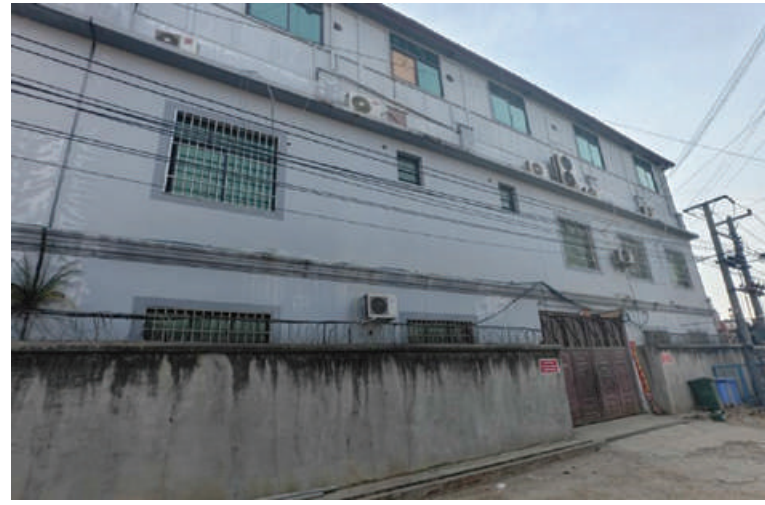
မူဆယ်မြို့ စွမ်းစော်ရပ်ကွက်အတွင်း အွန်လိုင်းလိမ်လည်လောင်းကစားမှု ကျူးလွန်သူများ ဖမ်းဆီးရမိသည့်နေအိမ်ကို တွေ့ရစဉ်။