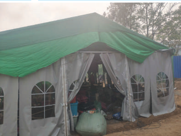
တန့်ယန်းမြို့နယ်အတွင်း အွန်လိုင်းလိမ်လည်လောင်းကစားမှု ကျူးလွန်ရာတွင်အသုံးပြုသည့် အလုပ်ရုံကို တွေ့ရစဉ်။