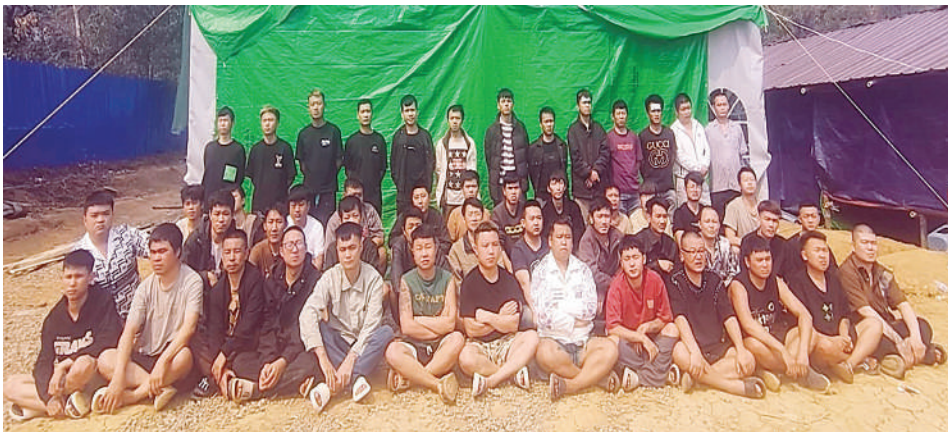
တန့်ယန်းမြို့နယ်အတွင်း အွန်လိုင်းလိမ်လည်လောင်းကစားမှုကျူးလွန်သူ တရုတ်နိုင်ငံသား အမျိုးသား ဦးရေ ၅၀ ဖမ်းဆီးရမိမှုမှတ်တမ်းဓာတ်ပုံ။

နေပြည်တော် ဧပြီ ၄ ဆောင်ရွက်လျက်ရှိပြီး မြန်မာနိုင်ငံအတွင်း လုံးဝ အခြေမပြုနိုင်ရေးအတွက် ပြည်တွင်းအင်အားစုများ အပြင် အိမ်နီးချင်းနိုင်ငံအစိုးရများနှင့်လည်း ပေါင်းစပ် ညှိနှိုင်း၍ အဆိုပါဒုစရိုက်မှုနှိမ်နင်းရေးလုပ်ငန်းများကို တက်ကြွစွာဆောင်ရွက်လျက်ရှိသည်။ စာမျက်နှာ ၂၆ ကော်လံ ၁ ❖