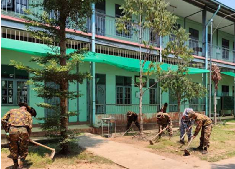
ရန်ကုန်တိုင်းစစ်ဌာနချုပ်မှ နယ်မြေခံတပ်မတော်သားများက အခြေခံပညာကျောင်း၌ စုပေါင်းသန့်ရှင်းရေးဆောင်ရွက်ကြစဉ်။