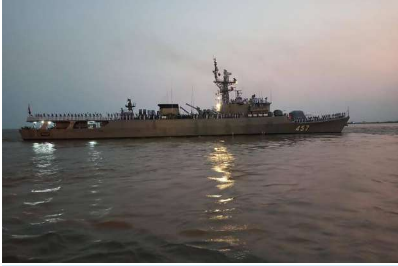
ထိုင်းဘုရင့်ရေတပ်မှ ချစ်ကြည်ရေးခရီးအလည်အပတ်ရောက်ရှိနေသည့် စစ်ရေယာဉ် HTMS Kraburi (FFG-457) ရန်ကုန်မြို့ သီလဝါဆိပ်ကမ်းမှ ပြန်လည်ထွက်ခွာစဉ်။

နေပြည်တော် ဧပြီ ၄ - HTMS Kraburi (FFG-457) သည် ယနေ့ မြန်မာနိုင်ငံဆိုင်ရာ ထိုင်းရေတပ်စစ်သံမှူး ညနေပိုင်းတွင် ရန်ကုန်မြို့ သီလဝါဆိပ်ကမ်း တို့က ပို့ဆောင်နှုတ်ဆက်ကြသည်။ မှ ပြန်လည်ထွက်ခွာရာ တပ်မတော်(ရေ)မှ အဆိုပါစစ်ရေယာဉ်ကို အဖွဲ့ခေါင်းဆောင် အရာရှိကြီးများ၊ အရာရှိ၊ စစ်သည်များနှင့် ဖြစ်သူ ထိုင်းဘုရင့်ရေတပ် 3 rd Naval Area