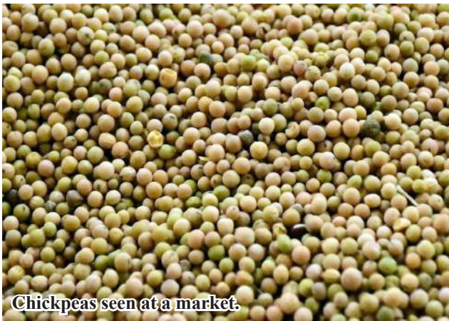
Chickpeas seen at a market.