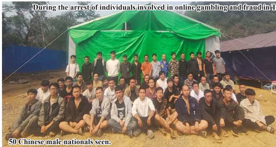
During the arrest of individuals involved in online gambling and fraud in Tangyan Township.