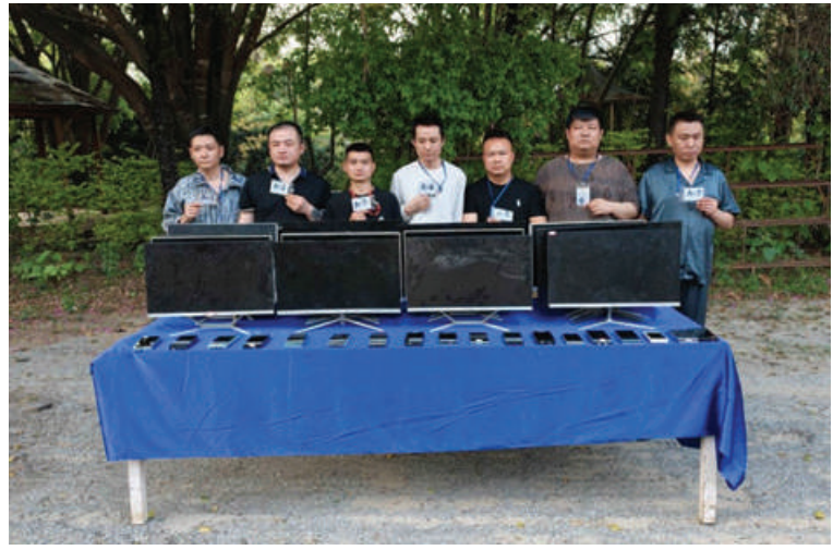
မူဆယ်မြို့ စွမ်းစော်ရပ်ကွက်အတွင်း အွန်လိုင်းလိမ်လည်လောင်းကစားမှု ကျူးလွန်သူများကို ဆက်စပ်ပစ္စည်းများနှင့်အတူ ဖမ်းဆီးရမိမှုမှတ်တမ်းဓာတ်ပုံ။

ဖုန်းမျိုးစုံ ၁၁၈ လုံး၊ Starlink ၁၆ ခု၊ Wire- less Router ၁၃ လုံး၊ မီးစက် နှစ်လုံးတို့နှင့် အတူ ဖမ်းဆီးရမိခဲ့သည်။ ထို့ပြင် နယ်မြေလုံခြုံရေးဆောင်ရွက် နေသော လုံခြုံရေးတပ်ဖွဲ့ဝင်များသည် ရှမ်းပြည်နယ်(မြောက်ပိုင်း) မူဆယ်မြို့ စွမ်းစော်ရပ်ကွက် မန်ဝိန်းနယ်မြေအတွင်း အွန်လိုင်းလိမ်လည် လောင်းကစားလုပ် ကိုင်သူများရောက်ရှိနေကြောင်း သတင်း အရ ယနေ့ညနေပိုင်းတွင် သွားရောက် ရှာဖွေစစ်ဆေးခဲ့ရာ မန်ဝိန်းနယ်မြေ အတွင်းမှ အွန်လိုင်းလိမ်လည်လောင်း ကစားလုပ်ကိုင်သူ တရုတ်နိုင်ငံသား အမျိုးသား ခုနစ်ဦးကို ဖုန်းမျိုးစုံ ၃၆ လုံး၊ ကွန်ပျူတာ ၂၃ လုံးတို့နှင့်အတူ ဖမ်းဆီး ရမိခဲ့သည်။