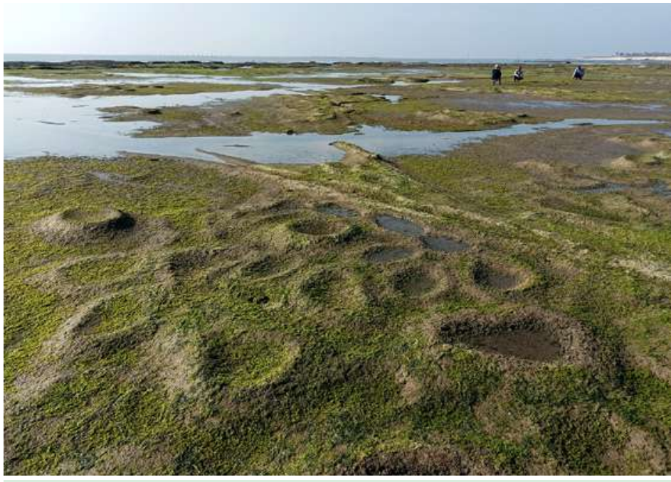
ကျောက်ခွက်များနှင့်ရေစီးကြောင်းရှုခင်းကို တွေ့ရစဉ်။

အရင်တစ်ခေါက်လာခဲ့တဲ့အချိန်တုန်းက ဒီလိုလှပသာယာတဲ့ကျောက်ခွက်တွေရေစီးကြောင်းတွေကို မတွေ့မမြင်ခဲ့ကြရပါဘူး။ ပင်လယ်ရေတွေ တက်နေတဲ့အချိန်၊ လှိုင်းလုံးကြီးတွေ တဝုန်းဝုန်းတိုင်းဒိုင်း