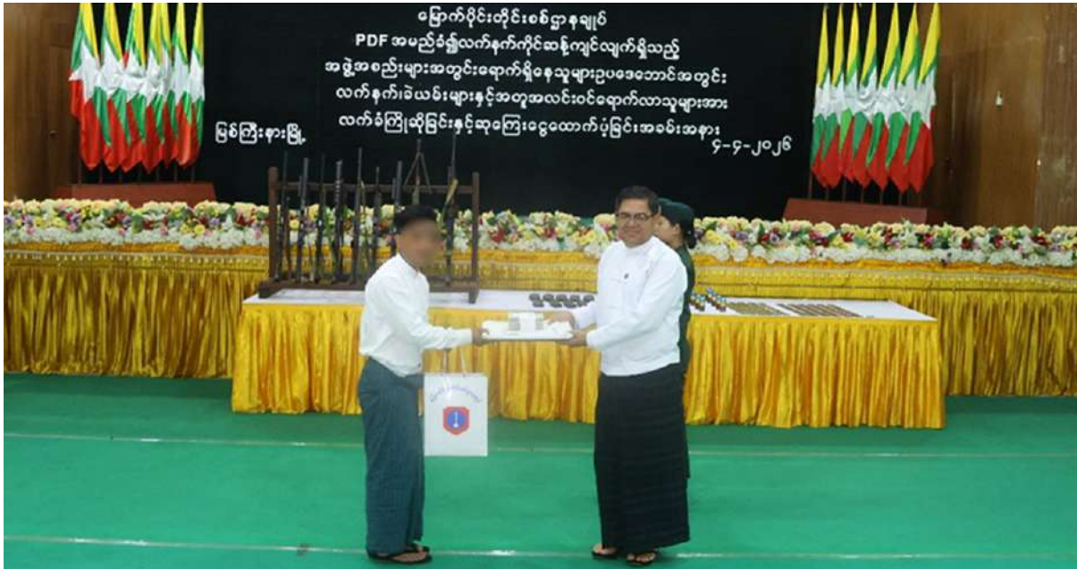
ကချင်ပြည်နယ်ဝန်ကြီးချုပ် ဦးခက်ထိန်နန် ဥပဒေဘောင်အတွင်းဝင်ရောက်လာသူတစ်ဦးကို လက်ဆောင်ပစ္စည်းများနှင့် ဆုကြေးငွေများ ပေးအပ်စဉ်။

★ ဥပဒေဘောင်အတွင်းဝင်ရောက်မှု လက်နက်ခဲယမ်းများနှင့်အတူ ဥပဒေဘောင် အတွင်းသို့ ထပ်မံဝင်ရောက်လာကြသည်။ ထိုသို့ ဥပဒေဘောင်အတွင်း ပြန်လည် ဝင်ရောက်လာကြသည့် KIA အဖွဲ့ဝင် အမျိုးသား တစ်ဦး၊ KPDF အဖွဲ့ဝင် အမျိုးသား တစ်ဦး၊ PDF အမည်ခံအဖွဲ့ဝင် အမျိုးသား ခြောက်ဦး စုစုပေါင်း အမျိုးသား ရှစ်ဦးတို့ကို တာဝန်ရှိသူများက ကြိုဆိုလက်ခံ၍ မိဘ အုပ်ထိန်းသူများထံ ပြန်လည်လွှဲပြောင်း အပ်နှံပို့ပေးရန်အတွက် ပြင်ဆင်ပေးခြင်း တိုင်းစစ်ဌာနချုပ် ဗလမင်းထင်ခန်းမ၌ ပြုလုပ်ရာ ကချင်ပြည်နယ်ဝန်ကြီးချုပ် ဦးခက် ထိန်နန်၊ တိုင်းမှူး၊ ဗိုလ်ချုပ်အောင်ဇော်ထွေး နှင့်အဖွဲ့ဝင်များ၊ ဌာနဆိုင်ရာတာဝန်ရှိသူများ၊ ဥပဒေဘောင်အတွင်း ပြန်လည်ဝင်ရောက် လာခဲ့ကြသူများနှင့် ၎င်းတို့၏မိဘများတက် ရောက်ကြသည်။ ဦးစွာ ပြည်နယ်ဝန်ကြီးချုပ်က အမှာစကား ပြောကြားပြီး တိုင်းမှူးက အလင်းဝင်ရောက် လာသူလူငယ်များကို အသိပညာပေးရှင်းလင်း ပြောကြားသည်။ ထို့နောက် ဥပဒေဘောင် အတွင်း ပြန်လည်ဝင်ရောက်ခဲ့ကြသူများက ၎င်းတို့နှင့်အတူပါရှိလာသည့် MA-1 သေနတ် တစ်လက်၊ MA-4 သေနတ် တစ်လက်၊ M-22 သေနတ် တစ်လက်၊ K-25 လောင်ချာနှစ်လက်၊ K-25 သေနတ် တစ်လက်၊ M-23 စက်လတ် တစ်လက်၊ M-80 တရုတ်စက်လတ် တစ်လက်၊ Type-81 သေနတ် တစ်လက်၊ MG-1 လက်ပစ် ဗုံး တစ်လုံး၊ ၄၀ မမဗုံးသီး ၁၀ လုံး၊ ၅ ဒဿမ ၅၆ မမကျည် ၃၂၆ တောင့်၊ ၇ ဒဿမ ၆၂ မမ