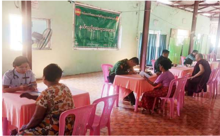
သံဃာတော်များနှင့် ဒေသခံပြည်သူများကို ရန်ကုန်တိုင်းစစ်ဌာနချုပ် နယ်မြေခံဆေးကုသရေးအဖွဲ့က ကျန်းမာရေးစောင့်ရှောက်မှုလုပ်ငန်းများ ဆောင်ရွက်ပေးစဉ်။

နေပြည်တော် ဧပြီ ၄ တပ်မတော်အနေဖြင့် ပြည်သူ့လူထု၏ ကျန်းမာရေးကဏ္ဍ တိုးတက်မြှင့်တင်ပေးရန်အတွက် ကျန်းမာရေးစောင့်ရှောက်မှုလုပ်ငန်းများတွင် တစ်ဖက်တစ်လမ်းမှ ကူညီစောင့်ရှောက်မှုများ ဆောင်ရွက်ပေးလျက်ရှိရာ ယနေ့နံနက်ပိုင်းတွင် အရှေ့ပိုင်းတိုင်းစစ်ဌာနချုပ် နယ်လှည့်ဆေးကုသရေးအဖွဲ့က ရှမ်းပြည်နယ် (တောင်ပိုင်း) တောင်ကြီးမြို့ မင်္ဂလာဦးရပ်ကွက် အရိယာသံဃာ့ကျောင်းတိုက်ရှိ သံဃာတော်များအား အဆိုပါကျောင်းတိုက်၌ အခြေပြု၍ ကျန်းမာရေးစောင့်ရှောက်မှုလုပ်ငန်းများ ဆောင်ရွက်ပေးသည်။