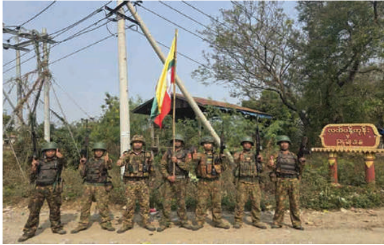
တပ်မတော်စစ်ကြောင်းများက အကြမ်းဖက်သောင်းကျန်းသူများ ယာယီ စိုးမိုးထားသည့် လက်ပန်ကုန်းကျေးရွာကို ပြန်လည်သိမ်းပိုက်ရရှိခဲ့သည့် မှတ်တမ်း ဓာတ်ပုံ။

ယာယီစိုးမိုးထားသည့် တကောင်း မြို့ကို ပြန်လည်သိမ်းပိုက်ထိန်းချုပ်နိုင် ရေးအတွက် လိုအပ်သည့်ပြင်ဆင်စုဖွဲ့မှု များဆောင်ရွက်၍ သပိတ်ကျင်းမြို့နှင့် တကောင်းမြို့အကြား ခိုအောင်းလှုပ်ရှား လျက်ရှိသည့် အကြမ်းဖက်သောင်းကျန်း သူများကို စစ်ကြောင်းများခွဲပြီး ယခုနှစ် ဖေဖော်ဝါရီ ၆ ရက်မှစ၍ နယ်မြေရှင်းလင်း ရေးလုပ်ငန်းများကို ဟန်ချက်ညီညီ ဆောင်ရွက်ခဲ့ရာ ဖေဖော်ဝါရီ ၁၃ ရက်တွင် အကြမ်းဖက်သောင်းကျန်းသူများ ထိန်းချုပ် ထားသည့် သပိတ်ကျင်းမြို့နယ်အတွင်းရှိ ရေချမ်းစဉ်ကျေးရွာ၊ ဖေဖော်ဝါရီ ၁၅ ရက် တွင် ရှားတောကျေးရွာ၊ ဖေဖော်ဝါရီ ၁၇