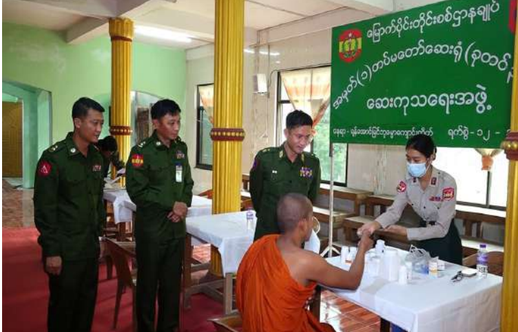
သံဃာတော်များအား ကျန်းမာရေးစောင့်ရှောက်မှုလုပ်ငန်းများ ဆောင်ရွက်ပေးနေမှုကို မြောက်ပိုင်းတိုင်းစစ်ဌာနချုပ် တိုင်းမှူး ဗိုလ်ချုပ်အောင်ဇော်ထွေး ကြည့်ရှုအားပေးစဉ်။

အထွေထွေရောဂါတို့နှင့်ပတ်သက်၍ လိုအပ်သည့် ဆေးဝါးကုသမှုများ ဆောင်ရွက်ပေးခြင်း၊ ECG စက်ဖြင့် နှလုံးစမ်းသပ်စစ်ဆေး