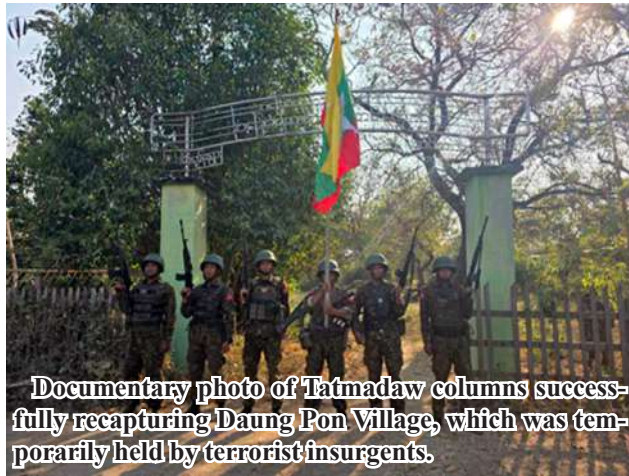
Documentary photo of Tatmadaw columns successfully recapturing Daung Pon Village, which was temporarily held by terrorist insurgents.