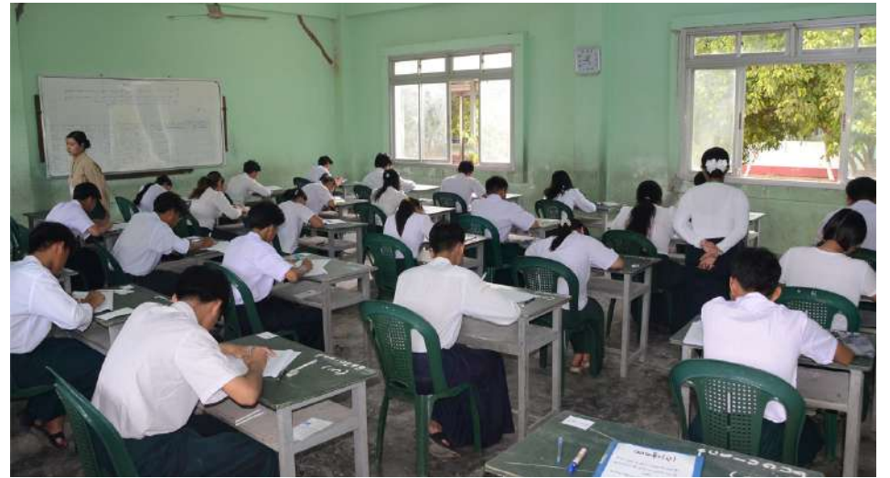
ပြည်ထောင်စုနယ်မြေနေပြည်တော် အမှတ်(၁၃) အခြေခံပညာအထက်တန်းကျောင်း၌ ၂၀၂၆ ခုနှစ် တက္ကသိုလ်ဝင်စာမေးပွဲ ဒုတိယနေ့ ကျောင်းသား၊ ကျောင်းသူများ အင်္ဂလိပ်စာဘာသာရပ် စိတ်အေးချမ်းစွာ ဖြေဆိုနေမှုကို တွေ့ရစဉ်။

☆ တက္ကသိုလ်ဝင်စာမေးပွဲမှ နေပြည်တော်ကောင်စီနယ်မြေ အပါအဝင် တိုင်းဒေသကြီးနှင့် ပြည်နယ်အလိုက် ခရိုင်၊ မြို့နယ်၊ စာစစ်ဌာနများနှင့် နိုင်ငံခြားစာစစ် ဌာနတို့၌ ဒုတိယနေ့ အင်္ဂလိပ်စာဘာသာရပ် ကိုဖြေဆိုရန် စာရင်းသွင်းအရေအတွက် မှာ ခရိုင် ၁၀၅ ခရိုင်၊ မြို့နယ် ၂၆၆ မြို့နယ်၊ စာစစ်ဌာန ၈၈၇ ဌာနတို့၌ ကျောင်းသား ၁၁၂၀၉၁ ဦး၊ ကျောင်းသူ ၁၅၆၅၆၂ ဦး စုစုပေါင်း ၂၆၈၇၅၃ ဦးဖြစ်ပြီး ဖြေဆိုမှု အနေဖြင့် ကျောင်းသား ၁၀၄၀၅၁ ဦး၊ ကျောင်းသူ ၁၅၀၈၉၅ ဦး စုစုပေါင်း ၂၅၄၉၄၆ ဦးဖြစ်သဖြင့် ဝင်ရောက်ဖြေဆို သည့် ကျောင်းသား၊ ကျောင်းသူ ရာခိုင်နှုန်း မှာ ၉၄ ဒသမ ၈၆ ရာခိုင်နှုန်းဖြစ်ကြောင်း၊ အလားတူ စက်မှု စိုက်ပျိုး၊ မွေးမြူရေး တက္ကသိုလ်ဝင်စာမေးပွဲ ဒုတိယနေ့ အင်္ဂလိပ်စာဘာသာရပ်ကို ဖြေဆိုရန် စာရင်းသွင်းအရေအတွက်မှာ ခရိုင် ၄၁ ခရိုင်၊ မြို့နယ် ၅၀၊ စာစစ်ဌာန ၅၃ ဌာနတို့၌ ကျောင်းသား ၂၀၀၅ ဦး၊ ကျောင်းသူ ၁၃၈၁ ဦး စုစုပေါင်း ၃၃၈၆ ဦးဖြစ်ပြီး ဖြေဆိုမှု အနေဖြင့် ကျောင်းသား ၁၉၉၂ ဦး၊ ကျောင်းသူ ၁၃၇၂ ဦး စုစုပေါင်း ၃၃၆၄ ဦး ဖြစ်သဖြင့် ဝင်ရောက်ဖြေဆိုသည့် ကျောင်းသား၊ ကျောင်းသူ ရာခိုင်နှုန်းမှာ ၉၉ ဒသမ ၃၅ ရာခိုင်နှုန်းဖြစ်ကြောင်း ပညာ ရေးဝန်ကြီးဌာနမှ သိရသည်။ ယင်းသို့ ကျောင်းသား၊ ကျောင်းသူများ စိတ်အေးချမ်းစွာနှင့် ဘေးအန္တရာယ် ကင်းရှင်းစွာ ဖြေဆိုနိုင်ရေးအတွက် သက်ဆိုင်ရာ လုံခြုံရေးအဖွဲ့ဝင်များ၊ ကျန်းမာရေးဝန်ထမ်းများ၊ မီးသတ်တပ်ဖွဲ့ ဝင်များ၊ ရပ်ကွက်၊ ကျေးရွာအုပ်ချုပ်ရေး အဖွဲ့ဝင်များက စနစ်တကျစောင့်ကြပ် ကြည့်ရှုပေးလျက်ရှိသည်။