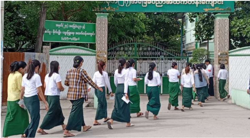
မန္တလေးတိုင်းဒေသကြီး ပြည်ကြီးတံခွန်မြို့နယ်ရှိ အမှတ်(၂၇) အခြေခံပညာအထက်တန်းကျောင်း၌ ၂၀၂၆ ခုနှစ် တက္ကသိုလ်ဝင်စာမေးပွဲ ဒုတိယနေ့ ကျောင်းသား၊ ကျောင်းသူများ အင်္ဂလိပ်စာဘာသာရပ် လာရောက်ဖြေဆိုနေမှုကို တွေ့ရစဉ်။