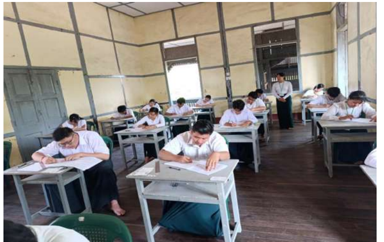
ပဲခူးတိုင်းဒေသကြီး တောင်ငူမြို့ရှိ အခြေခံပညာအထက်တန်းကျောင်းတွင် ကျောင်းသား၊ ကျောင်းသူများ ၂၀၂၆ ခုနှစ် တက္ကသိုလ်ဝင်စာမေးပွဲ ဒုတိယနေ့ အင်္ဂလိပ်စာဘာသာရပ် စိတ်အေးချမ်းစွာ ဖြေဆိုနေမှုကို တွေ့ရစဉ်။

ထိုသို့ ကျောင်းသား၊ ကျောင်းသူများ ၂၀၂၆ ခုနှစ် တက္ကသိုလ်ဝင်စာမေးပွဲ ဖြေဆို နေမှုများကို ပညာရေးဝန်ကြီးဌာန ပြည်ထောင်စုဝန်ကြီး ဒေါက်တာ ချောချောစိန်၊ တိုင်းဒေသကြီးနှင့် ပြည်နယ် များမှ ဝန်ကြီးချုပ်များ၊ တိုင်းမှူးများနှင့် တာဝန်ရှိသူများက သွားရောက်ကြည့်ရှု အားပေးခဲ့ကြသည်။ အဆိုပါ ၂၀၂၆ ခုနှစ် တက္ကသိုလ်ဝင် စာမေးပွဲကို မတ် ၁၁ ရက်တွင် မြန်မာစာ ဘာသာရပ်ကို စတင်ဖြေဆိုခဲ့ပြီး ယနေ့တွင် အင်္ဂလိပ်စာဘာသာရပ်ကို ဖြေဆိုလျက် ရှိကြောင်းနှင့် မတ် ၁၃ ရက် သောကြာနေ့ တွင် သင်္ချာဘာသာရပ်၊ မတ် ၁၄ ရက် စနေနေ့တွင် ဓာတုဗေဒဘာသာရပ်နှင့် ပထဝီဝင်ဘာသာရပ်၊ မတ် ၁၆ ရက် တနင်္လာနေ့တွင် ရူပဗေဒဘာသာရပ်နှင့် သမိုင်းဘာသာရပ်၊ မတ် ၁၇ ရက် အင်္ဂါနေ့ တွင် ဇီဝဗေဒဘာသာရပ်နှင့် ဘောဂဗေဒ ဘာသာရပ်တို့ကို ဖြေဆိုကြရမည်ဖြစ်ပြီး မတ် ၁၅ ရက် တနင်္ဂနွေနေ့ကို ပိတ်ရက် အဖြစ် သတ်မှတ်ကြောင်း သိရသည်။ အလားတူ စက်မှု စိုက်ပျိုး၊ မွေးမြူရေး တက္ကသိုလ်ဝင်စာမေးပွဲကို မတ် ၁၁ ရက်မှ စတင်ဖြေဆိုလျက်ရှိပြီး မတ် ၁၈ ရက်ထိ ဆက်လက်ဖြေဆိုကြမည်ဖြစ်ကာ မတ် ၁၅ ရက် တနင်္ဂနွေနေ့ကို ပိတ်ရက်အဖြစ် သတ်မှတ်ကြောင်း သိရသည်။ “၂၀၂၆ ခုနှစ် တက္ကသိုလ်ဝင်စာမေးပွဲမှာ ကြီးကြပ်ရေးမှူးတာဝန်အဖြစ် အမှတ် (၂) အခြေခံပညာအထက်တန်းကျောင်း စမ်းချောင်းမှာလာပြီးတော့ တာဝန် ထမ်းဆောင်နေပါတယ်။ စာဖြေသူဦးရေ ပေါင်း ၃၅၀ ရှိပါတယ်။ ဇီဝဗေဒအတွက် တော့ ခုံနံပါတ်(၁)ကနေ (၂၄၁)ထိ ၂၄၁ ယောက်ရှိပါတယ်။ ဘောဂဗေဒအတွက် တော့ ၉၈ ယောက်ရှိပါတယ်။ ပထဝီ သမိုင်း၊ ဘောဂကတော့ ၁၁ ယောက်ရှိပါ