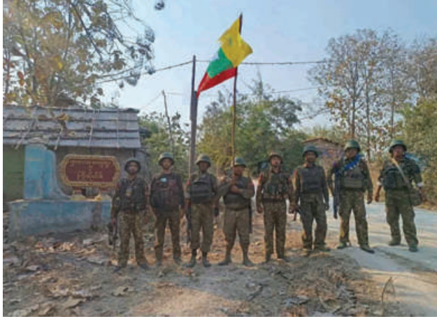
တပ်မတော်စစ်ကြောင်းများက အကြမ်းဖက်သောင်းကျန်းသူများ ယာယီစိုးမိုးထားသည့် ရှားတောကျေးရွာကို ပြန်လည်သိမ်းပိုက် ရရှိခဲ့သည့် မှတ်တမ်းဓာတ်ပုံ။