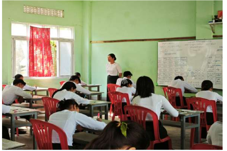
ရန်ကုန်တိုင်းဒေသကြီး လှည်းကူးမြို့နယ်ရှိ အခြေခံပညာကျောင်းတွင် ကျောင်းသား၊ ကျောင်းသူများ ၂၀၂၆ ခုနှစ် တက္ကသိုလ်ဝင်စာမေးပွဲ ဒုတိယနေ့ အင်္ဂလိပ်စာဘာသာရပ် စိတ်အေးချမ်းစွာ ဖြေဆိုနေမှုကို တွေ့ရစဉ်။