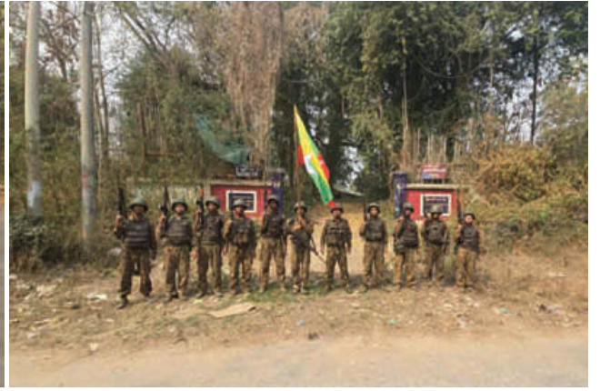
တပ်မတော်စစ်ကြောင်းများက အကြမ်းဖက်သောင်းကျန်းသူများ ယာယီစိုးမိုးထားသည့် တကောင်းမြို့ကို ပြန်လည်သိမ်းပိုက်ထိန်းချုပ်ခဲ့သည့် မှတ်တမ်းဓာတ်ပုံ။