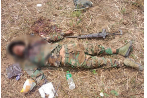
အကြမ်းဖက်သောင်းကျန်းသူများထံမှ သိမ်းပိုက်ရရှိခဲ့သည့် အလောင်းနှင့် လက်နက်၊ ခဲယမ်းများ မှတ်တမ်းဓာတ်ပုံ။

ရက်တွင် ဗန္ဓေးကျေးရွာ၊ ဖေဖော်ဝါရီ ၁၈ ရက်တွင် ဒေါင်းပုန်းကျေးရွာ၊ ဖေဖော်ဝါရီ ၂၁ ရက်တွင် ရွှေကျွန်းပင်ကျေးရွာ၊ ဖေဖော်ဝါရီ ၂၂ ရက်တွင် ပေါက်တပင် ကျေးရွာ၊ ဖေဖော်ဝါရီ ၂၄ ရက်တွင် သီးကုန်း ကျေးရွာ၊ ဖေဖော်ဝါရီ ၂၅ ရက်တွင် ဝါးရုံးကုန်းကျေးရွာ၊ ဖေဖော်ဝါရီ ၂၆ ရက် တွင် ရွှေစကားကျေးရွာ၊ ဖေဖော်ဝါရီ ၂၇ ရက်တွင် မြင်သာကျေးရွာနှင့် ကြာညှပ် ကျေးရွာ၊ ဖေဖော်ဝါရီ ၂၈ ရက်တွင် ကိုးပင် ကျေးရွာနှင့် ပုတီးမြို့ကျေးရွာ၊ မတ် ၂ ရက် တွင် မင်းကုန်းကျေးရွာ၊ မတ် ၄ ရက်တွင်