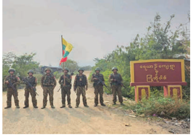
တပ်မတော်စစ်ကြောင်းများက အကြမ်းဖက်သောင်းကျန်းသူများ ယာယီစိုးမိုးထားသည့် ရေယာဉ်ကျေးရွာကို ပြန်လည်သိမ်းပိုက်ရရှိ ခဲ့သည့် မှတ်တမ်းဓာတ်ပုံ။