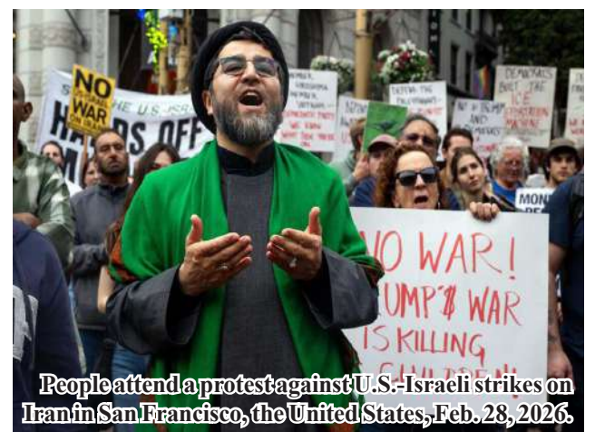
People attend a protest against U.S.-Israeli strikes on Iran in San Francisco, the United States, Feb. 28, 2026.

More than 1,300 civilians have been killed and 9,669 civilian sites destroyed in Iran in U.S.-Israeli strikes since Feb. 28, Amir Saeid Iravani, Iran's ambassador and permanent representative to the United Nations, said Tuesday. Xinhua