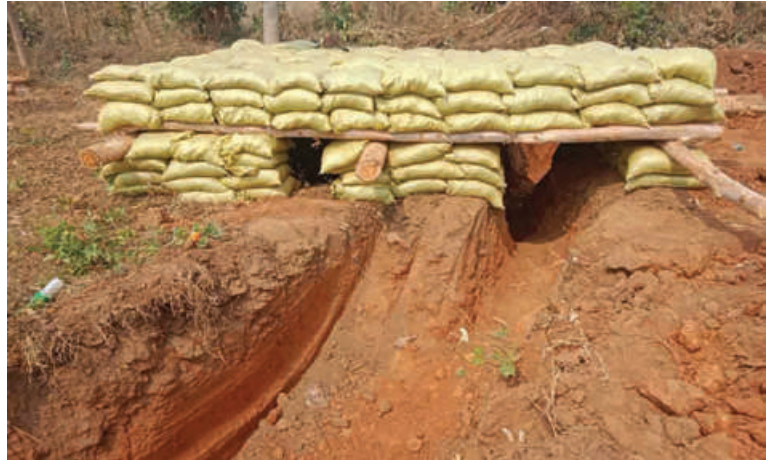
အကြမ်းဖက်သောင်းကျန်းသူများက ကျေးရွာများအတွင်း ယာယီခံစစ်စခန်း ပြုလုပ်ထားသည့် မှတ်တမ်းဓာတ်ပုံ။