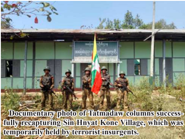
Documentary photo of Tatmadaw columns successfully recapturing Sin Hnyat Kone Village, which was temporarily held by terrorist insurgents.