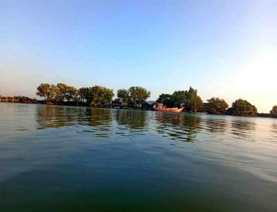
မယ်လဒ်ရွာနှင့် ကနုကမာရွာကြားရှိ ချောင်းတစ်ချောင်းကို တွေ့ရစဉ်။

သစ်တိုပင်ရွာမှာ ကုန်ဆုံဆိုင်အသေးလေး တွေသာရှိနေပြီး တခြားဘာဆိုင်မှမရှိကြပါဘူး။ သာမန်သစ်ခုတ်၊ ဝါးခုတ်ရွာလေးတစ်ရွာပါ။ ဒါပေမဲ့ သစ်တိုပင်ရွာရဲ့ နောက်ထပ်ခုနစ်မိုင်အကွာမှာ ငရုတ် ကောင်းတောင်ဆိုတဲ့ ရွာကြီးတစ်ရွာရှိနေတယ်။ ငရုတ်ကောင်းတောင်ရွာကိုတော့ မိနစ်ပိုင်းအတွင်း အချိန်အနည်းငယ်လောက်မှာ ရောက်လာခဲ့တယ်။ ငရုတ်ကောင်းတောင်က ငရုတ်ကောင်းမြောက်ကို သွားတဲ့လမ်းဆုံလမ်းခွဲတစ်ခုဖြစ်နေသလို ဈေးဆိုင်