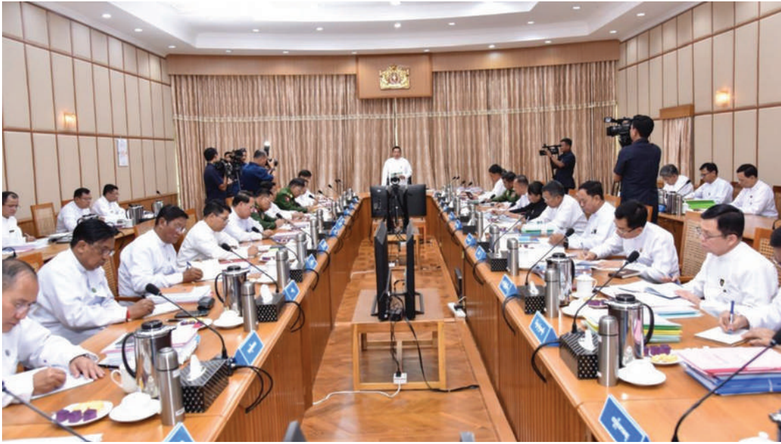
နိုင်ငံတော်ဝန်ကြီးချုပ် ဦးညိုစော ပြည်ထောင်စုသမ္မတမြန်မာနိုင်ငံတော် ပြည်ထောင်စုအစိုးရအဖွဲ့အစည်းအဝေး(၂/၂၀၂၆) တွင် အမှာစကားပြောကြားစဉ်။

မိမိတို့နိုင်ငံအတွင်းသို့ တရားမဝင် အွန်လိုင်း လိမ်လည်လောင်းကစားမှုများ နှင့် အွန်လိုင်းငွေကြေးလိမ်လည်မှုကျူးလွန် သူများသည် တစ်ဖက်နိုင်ငံများမှတစ်ဆင့် နည်းလမ်းမျိုးစုံဖြင့် တရားမဝင် ဝင်ရောက် လာကြသည်များရှိကြောင်း၊ ထိုသို့ နယ်စပ်