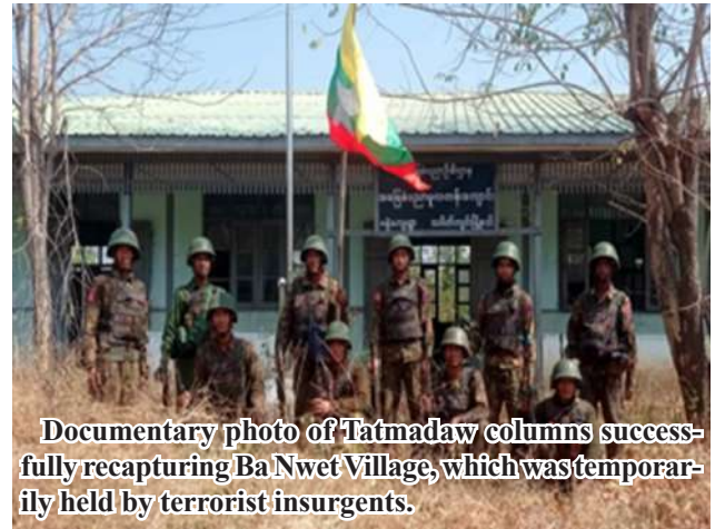
Documentary photo of Tatmadaw columns successfully recapturing Ba Nwet Village, which was temporarily held by terrorist insurgents.

Nay Pyi Taw March 12 Tatmadaw columns are conducting counter-terrorism operations as the terrorist insurgents under the so-called NUG-led PDF have been intruding into and occupying some towns and villages in Sagaing Region and Mandalay Region to commit violent destructive acts.