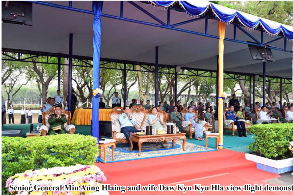
Senior General Min Aung Hlaing and wife Daw Kyu Kyu Hla view flight demonstration.