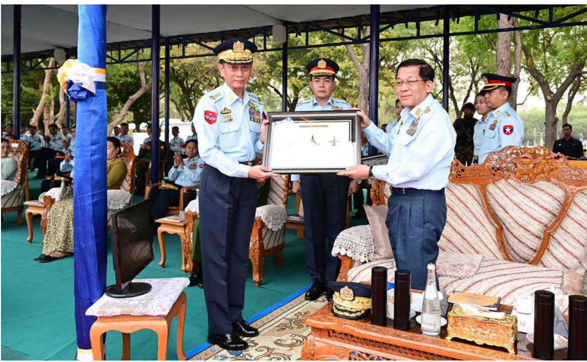
နိုင်ငံတော်လုံခြုံရေးနှင့်အေးချမ်းသာယာရေးကော်မရှင်ဥက္ကဋ္ဌ တပ်မတော်ကာကွယ်ရေးဦးစီးချုပ် ဗိုလ်ချုပ်မှူးကြီးမင်းအောင်လှိုင် ထံ ကာကွယ်ရေးဦးစီးချုပ်(လေ) ဗိုလ်ချုပ်ကြီးထွန်းအောင်က လေယာဉ်၊ ရဟတ်ယာဉ်များ တပ်တော်ဝင်အထိမ်းအမှတ် အမှတ်တရလက်ဆောင်ပစ္စည်းများကို ဂါရဝပြုပေးအပ်စဉ်။

များစွာအဓိကကျအရေးပါသည်ကို တွေ့ရှိရမည်ဖြစ်ကြောင်း၊ ထို့ကြောင့်ပင် ကမ္ဘာ့နိုင်ငံအသီးသီးသည် နိုင်ငံကြီးသည်ဖြစ်စေ၊ ငယ်သည်ဖြစ်စေ မိမိတို့၏လေကြောင်းစွမ်းအားကို တတ်နိုင်သမျှ မြင့်မားကောင်းမွန်အောင် အစဉ်ကြိုးပမ်းနေကြခြင်းဖြစ်ကြောင်း။