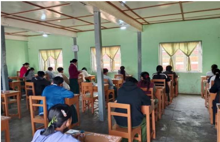
ရမ်းပြည်နယ်(တောင်ပိုင်း) တောင်ကြီးမြို့ အမှတ်(၄) အခြေခံပညာအထက်တန်း ကျောင်းတွင် ကျောင်းသား၊ ကျောင်းသူများ ၂၀၂၆ ခုနှစ် တက္ကသိုလ်ဝင်စာမေးပွဲ ဒုတိယ နေ့ အင်္ဂလိပ်စာဘာသာရပ် စိတ်အေးချမ်းစွာ ဖြေဆိုနေမှုကို တွေ့ရစဉ်။

☆ တက္ကသိုလ်ဝင်စာမေးပွဲမှ နေပြည်တော်ကောင်စီနယ်မြေ အပါအဝင် တိုင်းဒေသကြီးနှင့် ပြည်နယ်အလိုက် ခရိုင်၊ မြို့နယ်၊ စာစစ်ဌာနများနှင့် နိုင်ငံခြားစာစစ် ဌာနတို့၌ ဒုတိယနေ့ အင်္ဂလိပ်စာဘာသာရပ် ကိုဖြေဆိုရန် စာရင်းသွင်းအရေအတွက် မှာ ခရိုင် ၁၀၅ ခရိုင်၊ မြို့နယ် ၂၆၆ မြို့နယ်၊ စာစစ်ဌာန ၈၈၇ ဌာနတို့၌ ကျောင်းသား ၁၁၂၀၉၁ ဦး၊ ကျောင်းသူ ၁၅၆၅၆၂ ဦး စုစုပေါင်း ၂၆၈၇၅၃ ဦးဖြစ်ပြီး ဖြေဆိုမှု အနေဖြင့် ကျောင်းသား ၁၀၄၀၅၁ ဦး၊ ကျောင်းသူ ၁၅၀၈၉၅ ဦး စုစုပေါင်း ၂၅၄၉၄၆ ဦးဖြစ်သဖြင့် ဝင်ရောက်ဖြေဆို သည့် ကျောင်းသား၊ ကျောင်းသူ ရာခိုင်နှုန်း မှာ ၉၄ ဒသမ ၈၆ ရာခိုင်နှုန်းဖြစ်ကြောင်း၊ အလားတူ စက်မှု စိုက်ပျိုး၊ မွေးမြူရေး တက္ကသိုလ်ဝင်စာမေးပွဲ ဒုတိယနေ့ အင်္ဂလိပ်စာဘာသာရပ်ကို ဖြေဆိုရန် စာရင်းသွင်းအရေအတွက်မှာ ခရိုင် ၄၁ ခရိုင်၊ မြို့နယ် ၅၀၊ စာစစ်ဌာန ၅၃ ဌာနတို့၌ ကျောင်းသား ၂၀၀၅ ဦး၊ ကျောင်းသူ ၁၃၈၁ ဦး စုစုပေါင်း ၃၃၈၆ ဦးဖြစ်ပြီး ဖြေဆိုမှု အနေဖြင့် ကျောင်းသား ၁၉၉၂ ဦး၊ ကျောင်းသူ ၁၃၇၂ ဦး စုစုပေါင်း ၃၃၆၄ ဦး ဖြစ်သဖြင့် ဝင်ရောက်ဖြေဆိုသည့် ကျောင်းသား၊ ကျောင်းသူ ရာခိုင်နှုန်းမှာ ၉၉ ဒသမ ၃၅ ရာခိုင်နှုန်းဖြစ်ကြောင်း ပညာ ရေးဝန်ကြီးဌာနမှ သိရသည်။ ယင်းသို့ ကျောင်းသား၊ ကျောင်းသူများ စိတ်အေးချမ်းစွာနှင့် ဘေးအန္တရာယ် ကင်းရှင်းစွာ ဖြေဆိုနိုင်ရေးအတွက် သက်ဆိုင်ရာ လုံခြုံရေးအဖွဲ့ဝင်များ၊ ကျန်းမာရေးဝန်ထမ်းများ၊ မီးသတ်တပ်ဖွဲ့ ဝင်များ၊ ရပ်ကွက်၊ ကျေးရွာအုပ်ချုပ်ရေး အဖွဲ့ဝင်များက စနစ်တကျစောင့်ကြပ် ကြည့်ရှုပေးလျက်ရှိသည်။