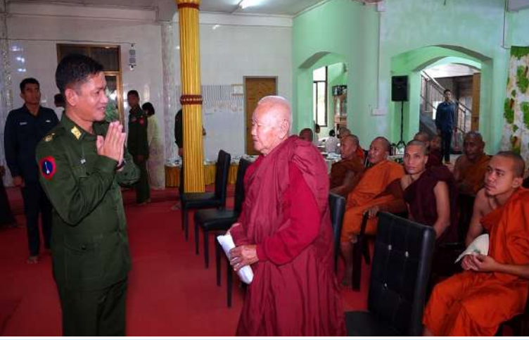
သံဃာတော်များအား ကျန်းမာရေးစောင့်ရှောက်မှုလုပ်ငန်းများ ဆောင်ရွက်ပေးနေမှုကို မြောက်ပိုင်းတိုင်းစစ်ဌာနချုပ် တိုင်းမှူး ဗိုလ်ချုပ်အောင်ဇော်ထွေး ကြည့်ရှုအားပေးစဉ်။

နေပြည်တော် မတ် ၁၂ တပ်မတော်အနေဖြင့် ပြည်သူ့လူထု၏ ကျန်းမာရေးကဏ္ဍ တိုးတက်မြှင့်တင်ပေးရန်အတွက် ကျန်းမာရေးစောင့်ရှောက်မှုလုပ်ငန်းများတွင် တစ်ဖက်တစ်လမ်းက ကူညီစောင့်ရှောက်ပေးမှုများ ဆောင်ရွက်ပေးလျက်ရှိရာ ယနေ့နံနက်ပိုင်းတွင် မြောက်ပိုင်းတိုင်းစစ်ဌာနချုပ် နယ်လှည့်ဆေးကုသရေးအဖွဲ့က ကချင်ပြည်နယ် မြစ်ကြီးနားမြို့ရှိ သံဃာတော်များအား ကျန်းမာရေးစောင့်ရှောက်မှုလုပ်ငန်းများ ဆောင်ရွက်ပေးသည်။ ထိုသို့ဆောင်ရွက်ပေးရာ ဆေးကုသရေးအဖွဲ့က သံဃာတော်အပါး ၃၀ တို့ကို ခွဲစိတ်ကုသမှုဆိုင်ရာရောဂါ၊ အရိုးအကြောရောဂါ၊ အာရုံကြောအားနည်းရောဂါ၊