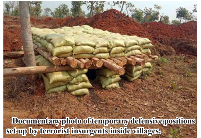
Documentary photo of temporary defensive positions set up by terrorist insurgents inside villages.

insurgents on February 13; Shar Taw Village on February 15; Ba Nwet Village on February 17; Daung Pon Village on February 18; Shwe Kyun Pin Village on February 21; Pauk Ta Pin Village on February 22; Thee Kone Village on February 24; War Yone Kone Village on February 25; Shwe Sa Kar Village on February 26; See Page 13