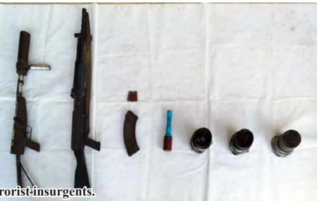
Documentary photo of bodies and weapons/ammunition seized from terrorist insurgents.