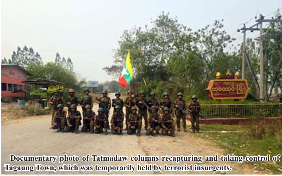
Documentary photo of Tatmadaw columns recapturing and taking control of Tagaung Town, which was temporarily held by terrorist insurgents.