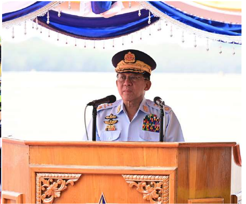
နိုင်ငံတော်လုံခြုံရေးနှင့် အေးချမ်းသာယာရေးကော်မရှင်ဥက္ကဋ္ဌ တပ်မတော်ကာကွယ်ရေးဦးစီးချုပ် ဗိုလ်ချုပ်မှူးကြီးမင်းအောင်လှိုင် တပ်မတော်(လေ) လေယာဉ်များ တပ်တော်ဝင်အခမ်းအနားတွင် အမှာစကားပြောကြားစဉ်။

ရေဖုံးမှအဆက် ဦးစွာ နိုင်ငံတော်လုံခြုံရေးနှင့် အေးချမ်းသာယာရေးကော်မရှင်ဥက္ကဋ္ဌ တပ်မတော်ကာကွယ်ရေးဦးစီးချုပ်က အမှာစကားပြောကြားရာတွင် မိမိတို့တပ်မတော်သည် လွတ်လပ်ရေးကြိုးပမ်းမှုသမိုင်းနှင့် အတူပေါက်ဖွားလာခဲ့သည့် မျိုးချစ်တပ်မတော်ဖြစ်ကြောင်း၊ ထို့ပြင် တိုင်းရင်းသားပြည်သူပေါင်းစုံပါဝင်ဖွဲ့စည်းထားသည့် ပြည်သူ့တပ်မတော်၊ ပြည်ထောင်စုတပ်မတော်လည်းဖြစ်ကြောင်း၊ သမိုင်းတစ်လျှောက်တိုင်းပြည်နှင့်လူမျိုးအပေါ် အန္တရာယ်အမျိုးမျိုးကျရောက်လာသည့်အချိန်တိုင်း၊ အချုပ်အခြာအာဏာကို ခြိမ်းခြောက်ထိပါးခံရသည့် အချိန်တိုင်းတွင် တပ်မတော်သည် ပြည်သူ့ရှေ့ကမားမားမတ်မတ်ရပ်တည်ပြီး ကာကွယ်စောင့်ရှောက်ပေးခဲ့သည်ကို အထင်အရှားတွေ့ရမည်ဖြစ်ကြောင်း။