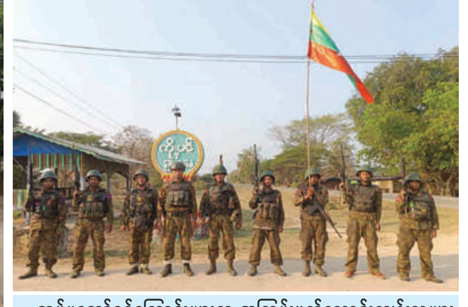
တပ်မတော်စစ်ကြောင်းများက အကြမ်းဖက်သောင်းကျန်းသူများ ယာယီစိုးမိုးထားသည့် တကောင်းမြို့ကို ပြန်လည်သိမ်းပိုက်ထိန်းချုပ် ခဲ့သည့် မှတ်တမ်းဓာတ်ပုံ။