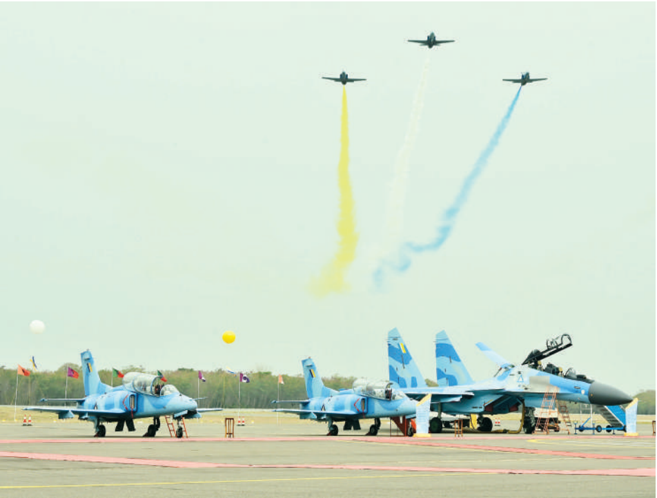
နိုင်ငံတော်လုံခြုံရေးနှင့်အေးချမ်းသာယာရေးကော်မရှင်ဥက္ကဋ္ဌ တပ်မတော်ကာကွယ်ရေးဦးစီးချုပ် ဗိုလ်ချုပ်မှူးကြီးမင်းအောင်လှိုင်အား တပ်မတော်(လေ) လေယာဉ်များ တပ်တော်ဝင်အခမ်းအနားတွင် လေယာဉ်များက သရုပ်ပြအုပ်ဖွဲ့ပျံသန်းအလေးပြုခြင်းဆောင်ရွက်ကြစဉ်။