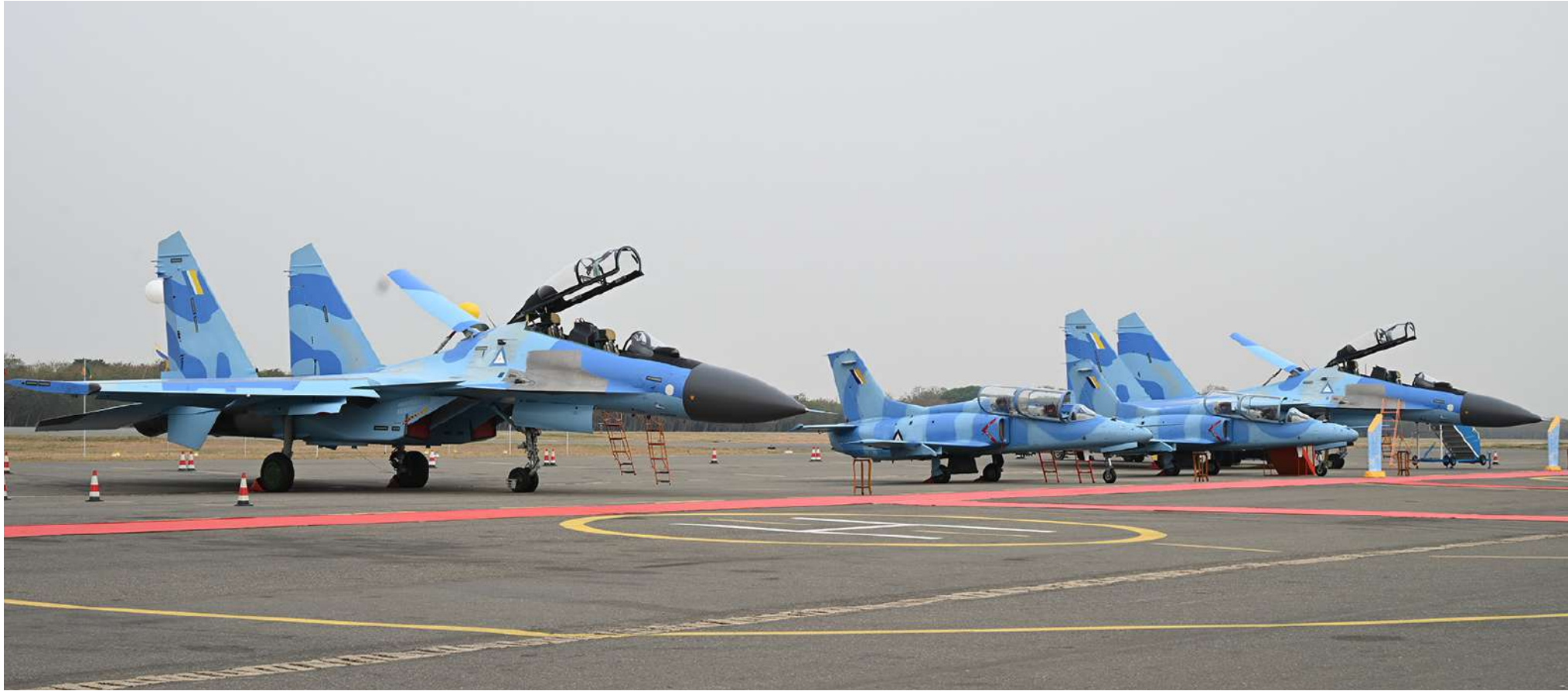
တပ်မတော်(လေ)မှ တပ်တော်ဝင်ခဲ့သည့် လေယာဉ်များကို တွေ့ရစဉ်။

တိုက်လေယာဉ် သုံးစင်းက Arrow Head Formation ဖြင့် အုပ်ဖွဲ့ပုံသန်းပြီး တိုက်လေယာဉ် တစ်စင်းက Barrel Roll Maneuver ဖြင့် သရုပ်ပြပုံသန်း၍လည်း ကောင်း၊ အလတ်စားသယ်ယူပို့ဆောင်ရေး လေယာဉ် တစ်စင်းနှင့် ဘက်စုံသုံးတိုက် လေယာဉ် နှစ်စင်းတို့က Composite Formation ဖြင့်လည်းကောင်း၊ တိုက်လေယာဉ် သုံးစင်းတို့က Arrow Head Formation ပုံစံ ဖြင့်လည်းကောင်း၊ ဘက်စုံသုံးတိုက် လေယာဉ် သုံးစင်းတို့က Arrow Head For- mation အုပ်ဖွဲ့ပုံစံဖြင့် လည်းကောင်း၊ တိုက်လေယာဉ် သုံးစင်းတို့က ရှုရပ်၏ရှေ့ တည့်တည့်မှ ပုံသန်းဝင်ရောက်ကာ တပ်မတော်(လေ) အလံကိုယ်စားပြုအဝါ ရောင်၊ အဖြူရောင်နှင့် အပြာရောင်မီးခိုးများ ထုတ်လွှတ်ပြီး Cross Turn Maneuver ဖြင့် ပုံသန်း၍လည်းကောင်း၊ တိုက်လေယာဉ် တစ်စင်းနှင့် စတုတ္ထမျိုးဆက်လွန်ဘက်စုံသုံး အကြီးစားဂျက်တိုက် လေယာဉ် တစ်စင်းတို့ က Composite Formation ဖြင့် ပုံသန်းပြီး မီးကျည်များပစ်လွှတ်၍ လည်းကောင်း နိုင်ငံတော်လုံခြုံရေးနှင့်အေးချမ်းသာယာရေး ကော်မရှင်ဥက္ကဋ္ဌ တပ်မတော်ကာကွယ်ရေး ဦးစီးချုပ်အား ပုံသန်းအလေးပြုခြင်းများ ဆောင်ရွက်ကြသည်။ ထို့နောက် နိုင်ငံတော်လုံခြုံရေးနှင့် အေးချမ်းသာယာရေးကော်မရှင် ဥက္ကဋ္ဌ တပ်မတော်ကာကွယ်ရေးဦးစီးချုပ်နှင့် အဖွဲ့ ဝင်များသည် တပ်တော်ဝင်လေယာဉ်များကို အမွှေးနံ့သာရည်များ ပတ်ဖျန်းပေးပြီး တပ်တော်ဝင်လေယာဉ်များကို လှည့်လည် ကြည့်ရှုကြပြီး စုပေါင်းမှတ်တမ်းတင်ဓာတ်ပုံ ရိုက်ကြသည်။ ၎င်းနောက် နိုင်ငံတော်လုံခြုံရေးနှင့် အေးချမ်းသာယာရေးကော်မရှင် ဥက္ကဋ္ဌ တပ်မတော် ကာကွယ်ရေးဦးစီးချုပ်သည် သရုပ်ပြအုပ်ဖွဲ့ပုံသန်းမှုတွင် ပါဝင်သော လေသူရဲများကို ဂုဏ်ပြုနှုတ်ဆက်စကား ပြောကြားပြီး ဂုဏ်ပြုချီးမြှင့်ငွေများ ပေးအပ် ခဲ့ကြောင်း သတင်းရရှိသည်။ (၅၀၁)