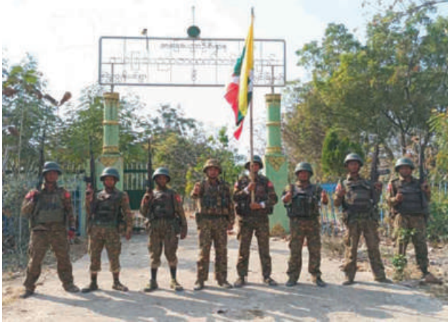
တပ်မတော်စစ်ကြောင်းများက အကြမ်းဖက်သောင်းကျန်းသူများ ယာယီစိုးမိုးထားသည့် ရွှေကျွန်းပင်ကျေးရွာကို ပြန်လည်သိမ်းပိုက် ရရှိခဲ့သည့် မှတ်တမ်းဓာတ်ပုံ။