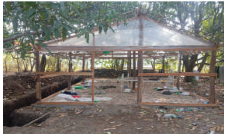
ဆယ်ဇင်းကုန်းကျေးရွာအနီး အကြမ်းဖက်သောင်းကျန်းသူများက ယာယီခံစစ် စခန်းပြုလုပ်ထားသည့် မှတ်တမ်းဓာတ်ပုံ။