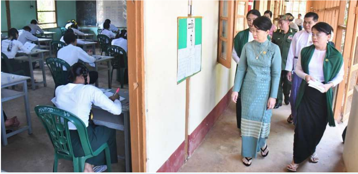
ပညာရေးဝန်ကြီးဌာန ပြည်ထောင်စုဝန်ကြီး ဒေါက်တာချောချောစိန် ၂၀၂၆ ခုနှစ် တက္ကသိုလ်ဝင်စာမေးပွဲ ဒုတိယနေ့ အင်္ဂလိပ်စာဘာသာရပ် ကျောင်းသား၊ ကျောင်းသူများ စိတ်အေးချမ်းစွာဖြေဆိုနေမှုကို ကြည့်ရှုအားပေးစဉ်။