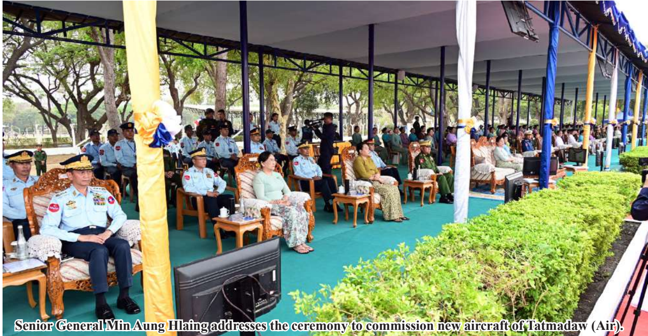
Senior General Min Aung Hlaing addresses the ceremony to commission new aircraft of Tatmadaw (Air).