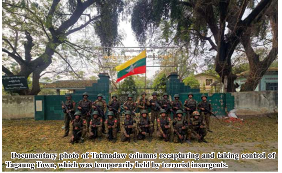
Documentary photo of Tatmadaw columns recapturing and taking control of Tagaung Town, which was temporarily held by terrorist insurgents.