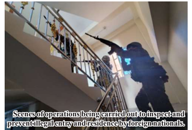
Scenes of operations being carried out to inspect and prevent illegal entry and residence by foreign nationals.