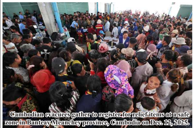
Cambodian evacuees gather to register for relief items at a safe zone in Banteay Meanchey province, Cambodia on Dec. 12, 2025.