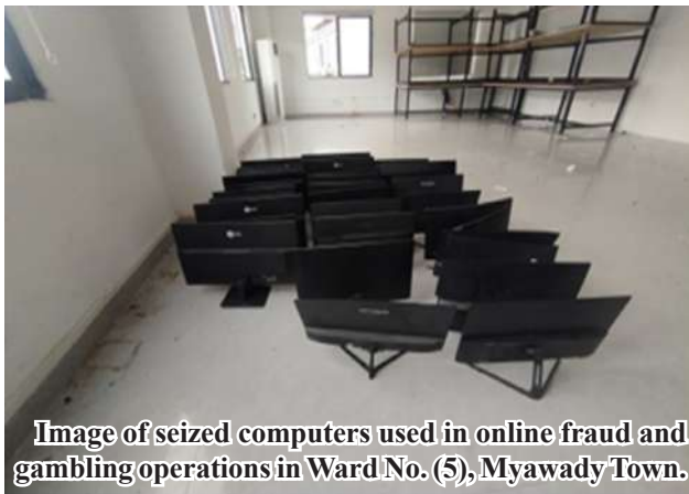
Image of seized computers used in online fraud and gambling operations in Ward No. (5), Myawady Town.

authorities systematically burned and destroyed additional seized items today. It is learned that the government, considering the fight against online scam and gambling a national duty, will continue its operations in coordination with domestic forces and neighboring governments to utterly prevent these activities from taking root within Myanmar. 100