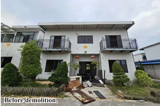
A two-story residential building illegally constructed in KK Park area (3).