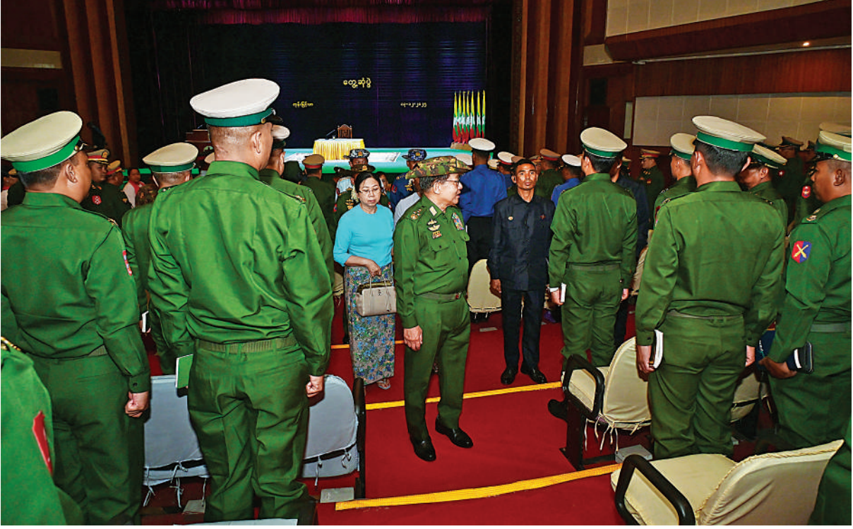
နိုင်ငံတော်လုံခြုံရေးနှင့်အေးချမ်းသာယာရေးကော်မရှင်ဥက္ကဋ္ဌ တပ်မတော်ကာကွယ်ရေးဦးစီးချုပ် ဗိုလ်ချုပ်မှူးကြီး မင်းအောင်လှိုင် အရာရှိ၊ စစ်သည်၊ မိသားစုများကို ရင်းရင်းနှီးနှီးလိုက်လံနှုတ်ဆက်စဉ်။

သိရှိနေရန်လိုကြောင်း၊ သို့ဖြစ်၍ နိုင်ငံ၏ ဥပဒေပြုရေးဖြစ်သည့် လွှတ်တော်တွင် ကိုယ်စားလှယ်များအဖြစ် တာဝန်ထမ်းဆောင်ကြမည့်သူများအနေဖြင့် ထိုက်သင့်သည့် အတန်းပညာရရှိရန်လိုကြောင်း၊ ထို့ကြောင့် ကိုယ်စားလှယ်လောင်းများအဖြစ် ဝင်ရောက်ယှဉ်ပြိုင်မည့်သူများအနေဖြင့် အနည်းဆုံး အဆင့်တက္ကသိုလ်ဝင်တန်းတက်ရောက်ပြီးဆုံးသူများဖြစ်ရန် သတ်မှတ်ထားရှိခြင်းဖြစ်ကြောင်း၊ ဒီမိုကရေစီစနစ်ကိုကျင့်သုံးရာတွင် ဥပဒေကို မဖြစ်မနေသိရှိနေရန်လိုကြောင်း၊ KG + 12 တက်ရောက်ပြီးသူများအနေဖြင့် အခြေခံပညာအဆင့် သင်ကြားပြီးချိန်တွင် အနည်းဆုံးအသက် ၁၈ နှစ်ပြည့်သူများဖြစ်လာမည်ဖြစ်သဖြင့် ဆန္ဒမဲပေးနိုင်သည့် အသက်အရွယ်များဖြစ်ကြောင်း၊ ထို့ကြောင့် ဥပဒေအသိပညာများသိရှိစေရေး မိမိတို့