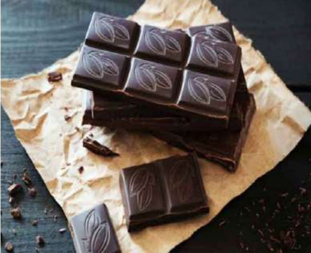
Ref : Xinhua News Trs : KKO

လန်ဒန် ဒီဇင်ဘာ ၁၃ သနပညာရှင်များက ပြောကြား အနက်ရောင် ချောကလက် စားသုံးမှုသည် ဇီဝသက်တမ်း ခါးသက်သည့်အရသာကိုပေး အိုမင်းမှုကို လျော့ချပေးနိုင် သော သီအိုဘရိုမိုင်းဓာတ်ဖြစ်ပေါင်း ကြောင်း ဗြိတိန်သုတေသနပညာ ရှင်များ၏ အဆိုကိုကိုးကား၍ ဒီဇင်ဘာ ၁၂ ရက်သတင်းများတွင် ရေးသားဖော်ပြထားသည်။ အနက်ရောင်ချောကလက် များတွင် အပင်များက သဘာဝ အလျောက်ထုတ်ပေးသည့် သီအို ဘရိုမိုင်း(theobromine) ခေါ် ဓာတ်ဖြစ်ပေါင်းတစ်မျိုး ကြယ်ဝ ကြောင်း ဗြိတိန်နိုင်ငံ လန်ဒန် ကောလိပ်တက္ကသိုလ်မှ သုတေသန ပညာရှင်များ၏ အဆိုအရ သိရသည်။ မိမိတို့၏ လေ့လာတွေ့ရှိချက် အရ သီအိုဘရိုမိုင်းဓာတ်ဖြစ်ပေါင်း သည့် ဇီဝသက်တမ်းအိုမင်းမှုအရှိန် ကို လျော့ချပေးနိုင်ကြောင်း သုတေ သနပညာရှင်များက ပြောကြား ခဲ့ကြောင်း သိရသည်။ ခါးသက်သည့်အရသာကိုပေး သော သီအိုဘရိုမိုင်းဓာတ်ဖြစ်ပေါင်း ကို ကိုကိုးပါဝင်မှုမြင့်မားသော အနက်ရောင်ချောကလက်များထဲ တွင် အဓိကတွေ့ရတတ်ကြောင်း သိရသည်။ ဗြိတိန် သုတေသနပညာရှင် များသည် အသက် ၆၀ ဝန်းကျင် အရွယ် လူဦးရေ ၁၆၆၀ ကျော်တို့ ကိုလေ့လာခဲ့ရာ စမ်းသပ်မှုတွင် ပါဝင်သူများအနက် သွေးအတွင်း သီအိုဘရိုမိုင်း ဓာတ်ဖြစ်ပေါင်း ပါဝင်မှုအဆင့် မြင့်မားသူများ၏ ဇီဝသက်တမ်းမှာ နှစ်ကာလကို အခြေခံသည့်ဘဝသက်တမ်းထက် ပို၍နုပျိုနေကြောင်း ဖော်ထုတ် တွေ့ရှိထားသည်။ Ref : Sputnik News Trs : KKO