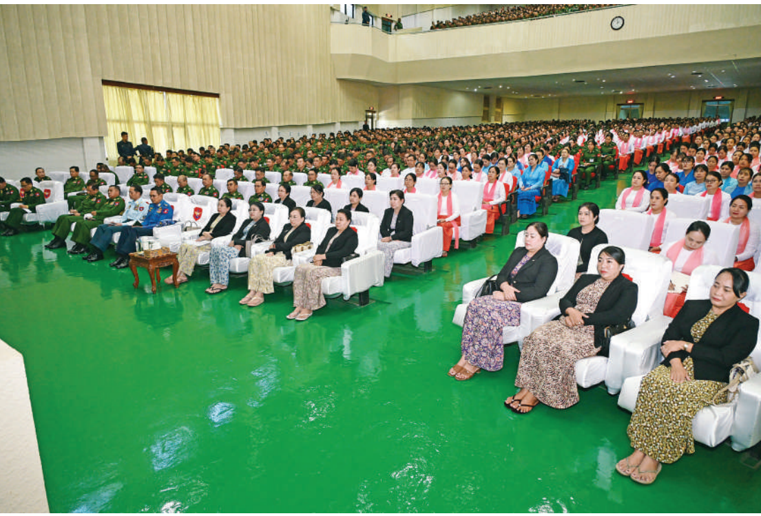
နိုင်ငံတော်လုံခြုံရေးနှင့် အေးချမ်းသာယာရေးကော်မရှင်ဥက္ကဋ္ဌ တပ်မတော်ကာကွယ်ရေးဦးစီးချုပ် ဗိုလ်ချုပ်မှူးကြီးမင်းအောင်လှိုင် ရန်ကုန်တိုင်းစစ်ဌာနချုပ်ကွပ်ကဲမှုအောက် တပ်နယ်အသီးသီးမှ အရာရှိ၊ စစ်သည်၊ မိသားစုများကို တွေ့ဆုံအမှာစကားပြောကြားစဉ်။

နေပြည်တော် ဒီဇင်ဘာ ၁၃ နိုင်ငံတော်လုံခြုံရေးနှင့် အေးချမ်းသာယာရေးကော်မရှင်ဥက္ကဋ္ဌ တပ်မတော်ကာကွယ်ရေးဦးစီးချုပ် ဗိုလ်ချုပ်မှူးကြီးမင်းအောင်လှိုင်သည် ယနေ့နံနက်ပိုင်းတွင် ရန်ကုန်တိုင်းစစ်ဌာနချုပ်ကွပ်ကဲမှုအောက် တပ်နယ်အသီးသီးမှ အရာရှိ၊ စစ်သည်၊ မိသားစုများကို တွေ့ဆုံအမှာစကားပြောကြားသည်။ အဆိုပါတွေ့ဆုံပွဲသို့ နိုင်ငံတော်လုံခြုံရေးနှင့် အေးချမ်းသာယာရေးကော်မရှင်ဥက္ကဋ္ဌ တပ်မတော်ကာကွယ်ရေးဦးစီးချုပ် နှင့်အတူ ဇနီး ဒေါ်ကြူကြူလှ၊ ကာကွယ်ရေးဦးစီးချုပ်(ရေ) ဗိုလ်ချုပ်ကြီးထိန်ဝင်း နှင့် ဇနီး၊ ကာကွယ်ရေးဦးစီးချုပ်(လေ) ဗိုလ်ချုပ်ကြီးထွန်းအောင်နှင့် ဇနီး၊ ကာကွယ်ရေးဦးစီးချုပ်ရုံး (ကြည်း)မှ အဆင့်မြင့်တပ်မတော်အရာရှိကြီးများနှင့် ဇနီးများ၊ ရန်ကုန်တိုင်းစစ်ဌာနချုပ်တိုင်းမှူး၊ ရန်ကုန်တိုင်းစစ်ဌာနချုပ်ကွပ်ကဲမှုအောက် တပ်နယ်အသီးသီးမှ အရာရှိ၊ စစ်သည်၊ မိသားစုများ တက်ရောက်ကြသည်။ နိုင်ငံတော်၏ နိုင်ငံရေးဖြစ်ပေါ်ပြောင်းလဲမှု ထိုသို့တွေ့ဆုံရာတွင် နိုင်ငံတော်လုံခြုံရေးနှင့် အေးချမ်းသာယာရေးကော်မရှင်ဥက္ကဋ္ဌ တပ်မတော်ကာကွယ်ရေးဦးစီးချုပ်က တပ်မတော်အနေဖြင့် ၂၀၂၀ ပြည့်နှစ် ရွေးကောက်ပွဲတွင် ဖြစ်ပေါ်ခဲ့သည့် မဲမသမာမှုများကြောင့် နိုင်ငံတော်တာဝန်များကို ဖွဲ့စည်းပုံအခြေခံဥပဒေ(၂၀၀၈ ခုနှစ်)နှင့်အညီ ထမ်းဆောင်ခဲ့ခြင်းဖြစ်ကြောင်း၊ စတင်တာဝန်ယူခဲ့ရသည့်အချိန်တွင် စာမျက်နှာ ၁၆ ကော်လံ ၁