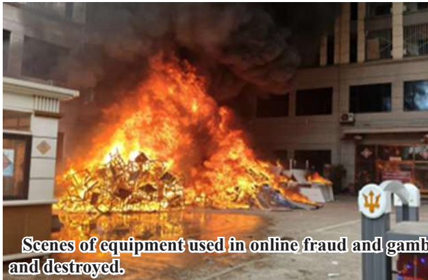
Scenes of equipment used in online fraud and gambling in Shwe Kokko, Myawady Township being burned and destroyed.