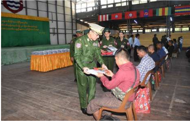
အနောက်တောင်တိုင်းစစ်ဌာနချုပ် တိုင်းမှူး ဗိုလ်ချုပ်စိုးကျော်ထက် နိုင်ငံ့သားကောင်း ရတနာများကို ဂုဏ်ပြုချီးမြှင့်ငွေများနှင့် အသုံးအဆောင်ပစ္စည်းများ ပေးအပ်စဉ်။

သတ်မှတ်နေရာများ၌ သွားရောက်တွေ့ဆုံကြသည်။ ဦးစွာ တိုင်းဒေသကြီးနှင့် ပြည်နယ် ဝန်ကြီးချုပ်များနှင့် တိုင်းမှူးများက အမှာစကားများ အသီးသီးပြောကြားကြပြီး ပြည်သူ့စစ်မှုထမ်းသင်တန်း အမှတ်စဉ် (၂၀)သို့ တက်ရောက်ကြမည့် နိုင်ငံ့သားကောင်းရတနာများအတွက် ဂုဏ်ပြုချီးမြှင့်ငွေများနှင့် အသုံးအဆောင်ပစ္စည်းများပေးအပ်ကြသည်။ ထို့နောက် တိုင်းဒေသကြီးနှင့် ပြည်နယ်ဝန်ကြီးချုပ်များ၊ တိုင်းမှူးများနှင့် တာဝန်ရှိသူများက နိုင်ငံ့သားကောင်းရတနာများကို ရင်းရင်းနှီးနှီးနှုတ်ဆက်အားပေးစကားပြောကြားပြီး လိုအပ်သည်များ ပေါင်းစပ်ညှိနှိုင်း ဆောင်ရွက်ပေးခဲ့ကြကြောင်း သတင်းရရှိသည်။ (၅၀၁)