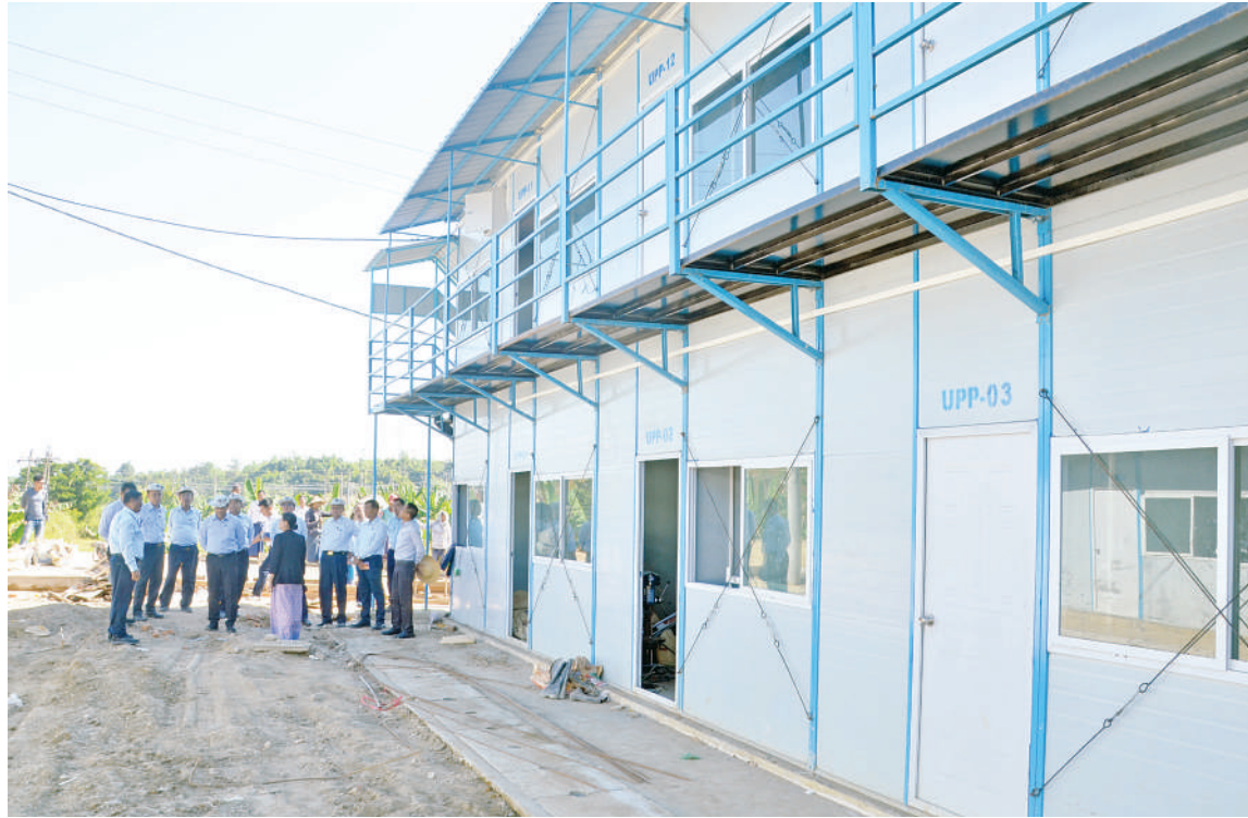
နေပြည်တော် ဒီဇင်ဘာ ၁၃ - လျှပ်စစ်စွမ်းအား ဝန်ကြီးဌာန ပြည်ထောင်စုဝန်ကြီး ဦးဉာဏ်ထွန်းသည် ဒုတိယဝန်ကြီး ဦးအေးကျော်၊ ဌာနဆိုင်ရာ တာဝန်ရှိသူများနှင့်အတူ ယနေ့နံနက်ပိုင်း တွင် မြို့သီရိမြို့နယ် ဗလသိဒ္ဓိရပ်ကွက် အတွင်းရှိ မန္တလေးလျှောက်ကြီးကြောင့် ထိခိုက်ပျက်စီးခဲ့ပြီး လိမ္မော်ရောင်အဆင့် သတ်မှတ်ထားသည့် လျှပ်စစ်စွမ်းအား