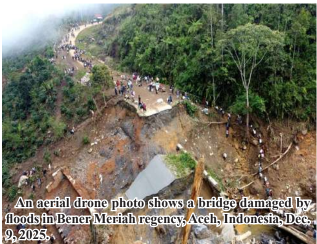
An aerial drone photo shows a bridge damaged by floods in Bener Meriah regency, Aceh, Indonesia, Dec. 9, 2025.

Jakarta December 13 The death toll from floods and landslides that struck three provinces on Indonesia's Sumatra Island has exceeded 1,000, with 218 people still missing, according to the latest data released Saturday by the National Disaster Management Agency (BNPB). The disasters have caused extensive infrastructure damage. BNPB