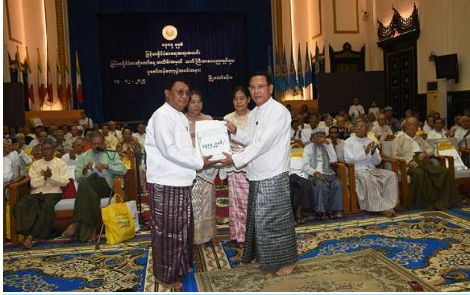
နိုင်ငံတော်ယာယီသမ္မတ နိုင်ငံတော်လုံခြုံရေးနှင့် အေးချမ်းသာယာရေးကော်မရှင်ဥက္ကဋ္ဌ တပ်မတော် ကာကွယ်ရေးဦးစီးချုပ် ဗိုလ်ချုပ်မှူးကြီးမင်းအောင်လှိုင်နှင့်ဇနီး ဒေါ်ကြူကြူလှတို့က လှူဒါန်းသည့် ငွေကျပ် ၁၄၅ သိန်းကျော်တန်ဖိုးရှိ အဝတ်အထည်နှင့် အသုံးအဆောင်ပစ္စည်းများကို ပြည်ထောင်စုဝန်ကြီး ဦးမောင်မောင်အုန်းက ပေးအပ်လှူဒါန်းစဉ်။

နိုင်ငံတော်ယာယီသမ္မတ နိုင်ငံတော်လုံခြုံရေးနှင့် အေးချမ်းသာယာရေးကော်မရှင်ဥက္ကဋ္ဌ တပ်မတော်ကာကွယ်ရေးဦးစီးချုပ် ဗိုလ်ချုပ်မှူးကြီးမင်းအောင်လှိုင်နှင့်ဇနီး ဒေါ်ကြူကြူလှတို့က ငွေကျပ် ၁၄၅ သိန်းကျော်တန်ဖိုးရှိ အဝတ်အထည်နှင့် အသုံးအဆောင်ပစ္စည်းများကို ပေးအပ်လှူဒါန်း