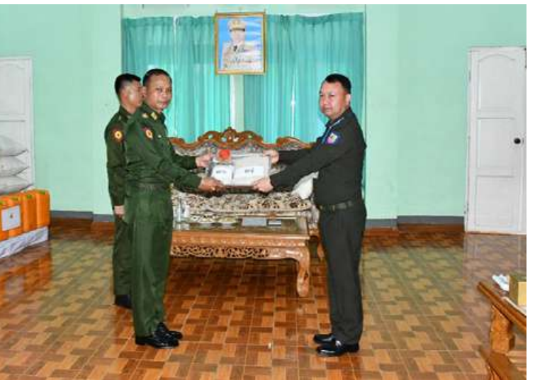
အရှေ့အလယ်ပိုင်းတိုင်းစစ်ဌာနချုပ် တိုင်းမှူး ဗိုလ်ချုပ်စိုးမြတ်ထွဋ် ပြည်သူ့စစ် (ဌာနေ)တပ်ဖွဲ့ဝင်များအတွက် အာဟာရဖြည့်စားသောက်ဖွယ်ရာများ ပေးအပ်စဉ်။

နေပြည်တော် ဒီဇင်ဘာ ၁၃ ရှိသူများက ပြည်သူ့စစ်(ဌာနေ)တပ်ဖွဲ့ဝင် ရှမ်းပြည်နယ်(တောင်ပိုင်း) မြို့နယ် များ၏တင်ပြချက်များအပေါ် လိုအပ်သည် အသီးသီးရှိ ပြည်သူ့စစ်(ဌာနေ)တပ်ဖွဲ့ဝင် များ ပေါင်းစပ်ညှိနှိုင်းဆောင်ရွက်ပေးပြီး များကို ယနေ့မွန်းလွဲပိုင်းတွင် အရှေ့ ပြည်သူ့စစ်(ဌာနေ)တပ်ဖွဲ့ဝင်များအတွက် အလယ်ပိုင်းတိုင်းစစ်ဌာနချုပ် တိုင်းမှူး အာဟာရဖြည့် စားသောက်ဖွယ်ရာများ ဗိုလ်ချုပ်စိုးမြတ်ထွဋ်နှင့် အဖွဲ့ဝင်များက နှင့် ဂုဏ်ပြုချီးမြှင့်ငွေများပေးအပ်ကာ ပြည်သူ့စစ်(ဌာနေ) တပ်ဖွဲ့ဝင်များကို တိုင်းစစ်ဌာနချုပ်ရှိ ခရေရိပ်သာ၌ တွေ့ဆုံသည်။ ရင်းရင်းနှီးနှီး လိုက်လံနှုတ်ဆက်ခဲ့ကြ ဦးစွာ တိုင်းမှူးက အမှာစကားပြော ကြောင်း သတင်းရရှိသည်။ (၅၀၁)