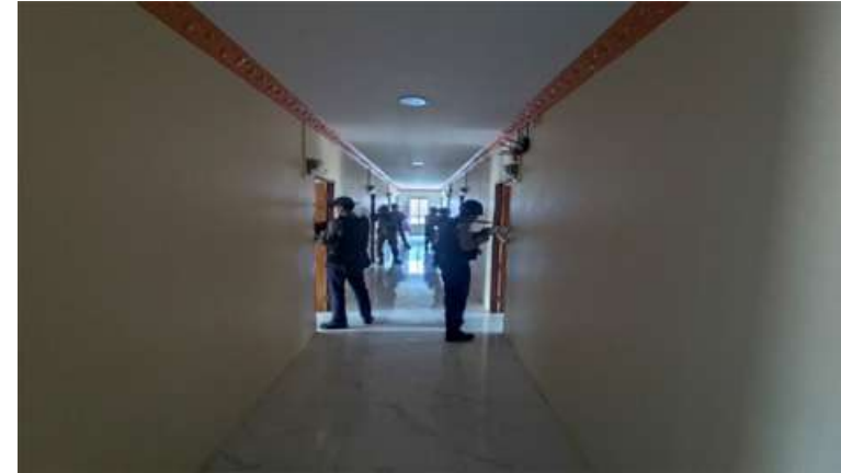
မြဝတီမြို့ အမှတ်(၅)ရပ်ကွက်အတွင်းမှ အွန်လိုင်းလိမ်လည်လောင်းကစားမှုဖြို လုပ်ရာတွင် အသုံးပြုသည့် ကွန်ပျူတာများ သိမ်းဆည်းရမိမှု မှတ်တမ်းဓာတ်ပုံ။