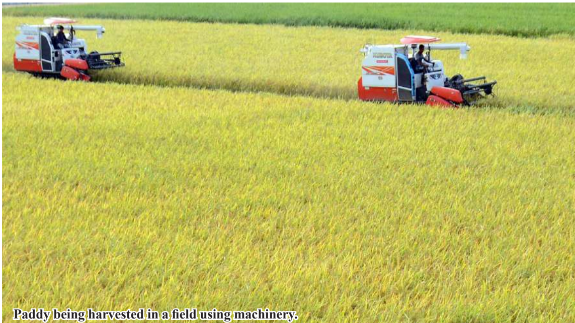
Paddy being harvested in a field using machinery.