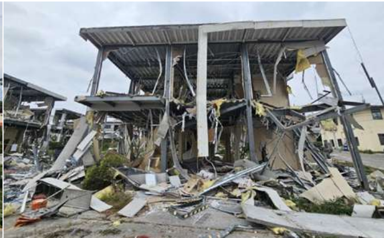
KK Park နယ်မြေ အပိုင်း(၃)တွင် တရားမဝင်ဆောက်လုပ်ထားသည့် နှစ်ထပ်တိုက် လူနေအဆောက်အအုံ မဖြိုဖျက်မီနှင့် ဖြိုဖျက်ပြီးစီးမှု မှတ်တမ်းဓာတ်ပုံ။