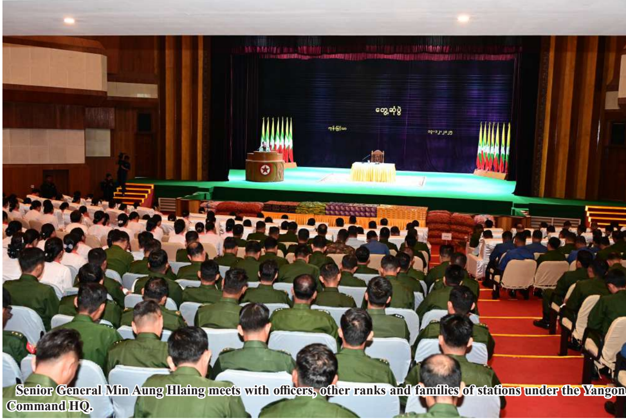
Senior General Min Aung Hlaing meets with officers, other ranks and families of stations under the Yangon Command HQ.