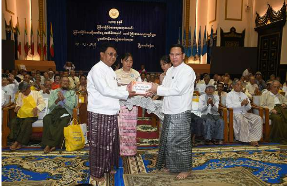
အမျိုးသားကာကွယ်ရေးနှင့် လုံခြုံရေးကောင်စီရုံးက လှူဒါန်းသည့် ငွေကျပ်သိန်း ၁၀၀နှင့် ပြန်ကြားရေး ဝန်ကြီးဌာနက လှူဒါန်းသည့် ငွေကျပ်သိန်း ၄၀ တို့ကို ပြည်ထောင်စုဝန်ကြီး ဦးမောင်မောင်အုန်းက ပေးအပ် လှူဒါန်းစဉ်။

ရန်ကုန် ဒီဇင်ဘာ ၁၃ မြန်မာနိုင်ငံ စာရေးဆရာအသင်း၏ ၁၃၈၇ ခုနှစ် စာဆိုတော်နေ့အထိမ်းအမှတ် သက်ကြီးစာပေပညာရှင်များ ပူဇော် ကန်တော့ပွဲ အခမ်းအနားကို ယနေ့နံနက် ၉ နာရီတွင် ရန်ကုန်မြို့ မြို့တော်ခန်းမ၌ ကျင်းပရာ နိုင်ငံတော်ယာယီသမ္မတ နိုင်ငံတော်လုံခြုံရေးနှင့်အေးချမ်းသာယာရေး ကော်မရှင်ဥက္ကဋ္ဌ တပ်မတော်ကာကွယ်ရေး ဦးစီးချုပ် ဗိုလ်ချုပ်မှူးကြီးမင်းအောင်လှိုင် နှင့်ဇနီး ဒေါ်ကြူကြူလှတို့က ငွေကျပ် ၁၄၅ သိန်းကျော်တန်ဖိုးရှိ အဝတ်အထည် နှင့် အသုံးအဆောင်ပစ္စည်းများကို လှူဒါန်းသည်။ အခမ်းအနားသို့ ပြန်ကြားရေးဝန်ကြီး ဌာန ပြည်ထောင်စုဝန်ကြီး ဦးမောင်မောင် အုန်း၊ ရန်ကုန်တိုင်းဒေသကြီးဝန်ကြီးချုပ်