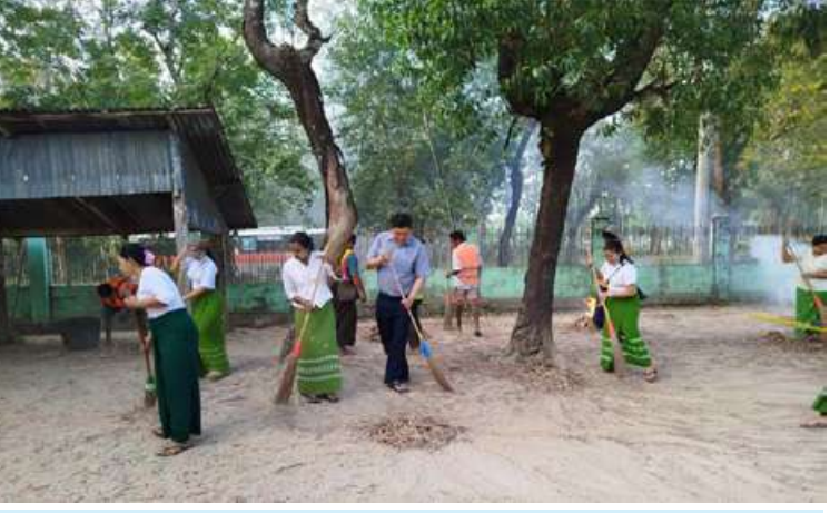
ရန်ကုန်တိုင်းဒေသကြီးရှိ မြို့နယ်များ၌ ဌာနဆိုင်ရာဝန်ထမ်းများ၊ ဒေသခံပြည်သူ များက စုပေါင်းသန့်ရှင်းရေးလုပ်ငန်းများ ဆောင်ရွက်ပေးစဉ်။ စုပေါင်းဆောင်ရွက်ကြသည်။ ရောက်ကြည့်ရှုအားပေးပြီး လိုအပ်သည် ယင်းသို့ ဆောင်ရွက်နေမှုများကို များ ညှိနှိုင်းဆောင်ရွက်ပေးခဲ့ကြောင်း သက်ဆိုင်ရာ တာဝန်ရှိသူများက သွား သတင်းရရှိသည်။ (၅၀၁)

မြို့နယ်၊ သုံးခွမြို့နယ်၊ ပုဇွန်တောင်မြို့နယ်၊ မင်္ဂလာတောင်ညွန့်မြို့နယ်၊ ဒဂုံမြို့သစ် (ဆိပ်ကမ်း)မြို့နယ်၊ ထန်းတပင်မြို့နယ် တို့ရှိ ဘုရားစေတီပုထိုးများ၊ ဆေးရုံများ၊ ဘိုးဘွားရိပ်သာများ၊ ဘာသာရေးကျောင်း များနှင့်လမ်းမကြီးတို့၌ နယ်မြေခံ တပ်မတော်သားများ၊ မြန်မာနိုင်ငံရဲတပ်ဖွဲ့ ဝင်များ၊ မီးသတ်တပ်ဖွဲ့ဝင်များ၊ ပြည်သူ့စစ် (ဌာနေ)တပ်ဖွဲ့ဝင်များ၊ ဌာနဆိုင်ရာဝန်ထမ်း များ၊ လူမှုရေးအသင်းအဖွဲ့များနှင့် ဒေသခံ ပြည်သူများပူးပေါင်း၍ ချုံနွယ်ပေါင်းမြက် များ ခုတ်ထွင်ရှင်းလင်းခြင်း၊ အမှိုက်များ ရှင်းလင်းခြင်း၊ ရေစီးရေလာကောင်းမွန် စေရေး ရေနုတ်မြောင်းများ တူးဖော်ပေး ခြင်း၊ ရေကန်များတွင် အဘိတ်ဆေးများ ခတ်ပေးခြင်း၊ ခြင်ခိုအောင်းနိုင်သည့် နေရာများအား ခြင်ဆေးဖျန်းခြင်းများကို