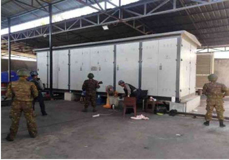
တရားမဝင်နိုင်ငံခြားသားများထားရှိနိုင်သည့် တစ်ထပ်တိုက်အဆောက်အအုံ ဝင်ရောက်ရှင်းလင်းနေမှုကို တွေ့ရစဉ်။

ကစားမှုများ အများဆုံးအခြေချလုပ်ကိုင် လျက်ရှိကြသည့် ရွှေကုက္ကိုလ်နယ်မြေနှင့် KK Park နယ်မြေတို့၌ လုံခြုံရေးတပ်ဖွဲ့ ဝင်များ၊ အုပ်ချုပ်ရေးအဖွဲ့အစည်းများနှင့် ဒေသတွင်း တာဝန်ရှိသူများအပါအဝင် အဖွဲ့စုံပါဝင်သည့် ပူးပေါင်းအဖွဲ့ဖြင့် တရားမဝင် အဆောက်အအုံများအတွင်း ဝင်ရောက်ရှင်းလင်းခြင်း၊ အွန်လိုင်း လိမ်လည်လောင်းကစားမှု လုပ်ငန်းစဉ် များတွင်အသုံးပြုခဲ့သည့် သိမ်းဆည်းရမိ