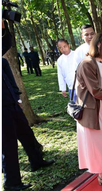
ပြည်ထောင်စုသမ္မတမြန်မာနိုင်ငံတော် ယာယီသမ္မတ နိုင်ငံတော်လုံခြုံရေးနှင့် အေးချမ်းသာယာရေးကော်မရှင်ဥက္ကဋ္ဌ ဗိုလ်ချုပ်မှူးကြီး မင်းအောင်လှိုင်အား အခမ်းအနားတက်ရောက်လာကြသည့် နိုင်ငံတကာမှသံတမန်များက ခရီးဦးကြိုဆိုနှုတ်ဆက်စဉ်။

ထို့နောက် နိုင်ငံတော်ယာယီသမ္မတ နိုင်ငံတော်လုံခြုံရေးနှင့် အေးချမ်းသာယာ ရေးကော်မရှင်ဥက္ကဋ္ဌနှင့် အဖွဲ့ဝင်များသည် ယခင်နက္ခတ်တာရာပြခန်းတွင် အသုံးပြုခဲ့ သော GOTO Planetarium Analog Projection System ကို ကြည့်ရှုလေ့လာ ကြသည်။