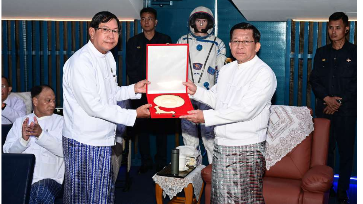
ပြည်ထောင်စုသမ္မတမြန်မာနိုင်ငံတော် ယာယီသမ္မတ နိုင်ငံတော်လုံခြုံရေးနှင့် အေးချမ်းသာယာရေးကော်မရှင်ဥက္ကဋ္ဌ ဗိုလ်ချုပ်မှူးကြီးမင်းအောင်လှိုင်ထံ ရန်ကုန်တိုင်းဒေသကြီးဝန်ကြီးချုပ် ဦးစိုးသိန်းက အာကာသပြတိုက်(ရန်ကုန်) ဖွင့်ပွဲအထိမ်းအမှတ်လက်ဆောင်ကို ဂါရဝပြုပေးအပ်စဉ်။

မျိုးဆက်သစ်လူငယ်များ အနေဖြင့် မျက်မှောက်ခေတ် အာကာသနယ်ပယ်၏ စိန်ခေါ်မှုနှင့် အခွင့်အလမ်းအသစ်များတွင် ပါဝင်ယှဉ်ပြိုင်နိုင်ပြီး စိတ်ကူးစိတ်သန်းများကိုမွေးဖွားကာအကောင်အထည်ဖော်ဆောင်ရွက်နိုင်စေရန်အတွက် အာကာသအသုံးချ နယ်ပယ်အသီးသီးတွင် နိုင်ငံတော်က ဂုဏ်ယူအားထားရမည့် သုတေသနပညာရှင်များ၊ အင်ဂျင်နီယာများ၊ အနေဖြင့် အာကာသယာဉ်မှူးများ၊ တက်စုံကဏ္ဍအလိုက် ကျွမ်းကျင်ပညာရှင်များနှင့် လူ့စွမ်းအားအရင်းအမြစ်များပေါ်ထွက်လာမည်ဟုလည်း ယုံကြည်ပါကြောင်းဖြင့် ပြောကြားသည်။ ၎င်းနောက် နိုင်ငံတော်ယာယီသမ္မတ နိုင်ငံတော်လုံခြုံရေးနှင့် အေးချမ်းသာယာရေးကော်မရှင်ဥက္ကဋ္ဌထံ ရန်ကုန်တိုင်းဒေသကြီး ဝန်ကြီးချုပ်က အာကာသပြတိုက် (ရန်ကုန်) ဖွင့်ပွဲအထိမ်းအမှတ်လက်ဆောင်