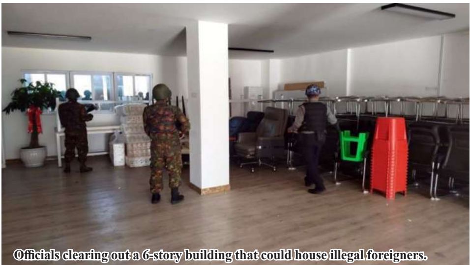
Officials clearing out a 6-story building that could house illegal foreigners.