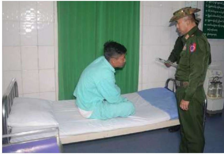
အနောက်မြောက်တိုင်းစစ်ဌာနချုပ် တိုင်းမှူး ဗိုလ်မှူးချုပ်ကျော်သူရ ဆေးကုသမှုခံယူ နေသူတစ်ဦးကို ရင်းရင်းနှီးနှီး မေးမြန်းအားပေးစကားပြောကြားစဉ်။ နေပြည်တော် နိုဝင်ဘာ ၃၀ ကုသမှုခံယူလျက်ရှိသော အရာရှိ၊ စစ်ကိုင်းတိုင်းဒေသကြီး ဟုမ္မလင်းမြို့ရှိ စစ်သည်၊ မိသားစုဝင်များ၊ ပြည်သူ့စစ်မှု တပ်မတော်ဆေးရုံ၌ တက်ရောက်ဆေး ထမ်းများ၊ စစ်မှုထမ်းဟောင်းအဖွဲ့ဝင်များ၊ ကြောင်း သတင်းရရှိသည်။ (၅၀၁)

မြန်မာနိုင်ငံရဲတပ်ဖွဲ့ဝင်များ၊ ပြည်သူ့စစ် (ဌာန)တပ်ဖွဲ့ဝင်များနှင့် ဒေသခံပြည်သူ များကို နိုဝင်ဘာ ၂၉ ရက်တွင် အနောက် မြောက်တိုင်းစစ်ဌာနချုပ် တိုင်းမှူး ဗိုလ်မှူးချုပ်ကျော်သူရနှင့် တာဝန်ရှိသူ များက သွားရောက်ကြည့်ရှုကြသည်။ ဦးစွာ တိုင်းမှူးနှင့် တာဝန်ရှိသူများက ဆေးရုံတက်လူနာတစ်ဦးချင်း၏ ရောဂါ ဖြစ်ပွားမှု၊ ဆေးဝါးကုသပေးထားမှုနှင့် ကျန်းမာရေး တိုးတက်ကောင်းမွန်မှု အခြေအနေများကို ရင်းရင်းနှီးနှီးမေးမြန်း အားပေးစကားပြောကြားပြီး အာဟာရ ဖြည့် စားသောက်ဖွယ်ရာများနှင့် ချီးမြှင့် ငွေများပေးအပ်သည်။ ထို့နောက် တိုင်းမှူး နှင့် တာဝန်ရှိသူများသည် ဆေးရုံအတွင်း လှည့်လည်ကြည့်ရှုစစ်ဆေး၍ လိုအပ် သည့်များ ညှိနှိုင်းဆောင်ရွက်ပေးခဲ့ ကြောင်း သတင်းရရှိသည်။ (၅၀၁)