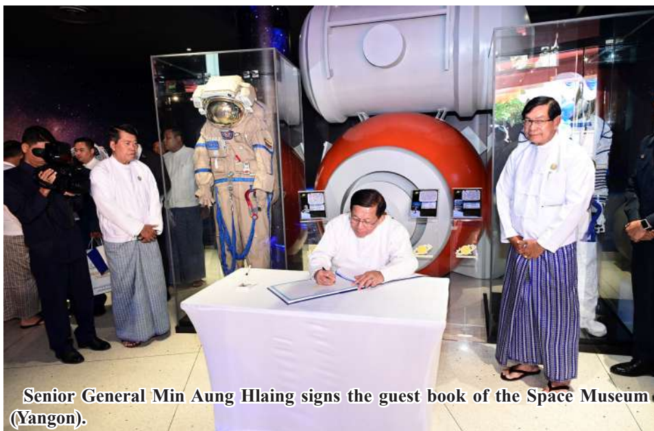
Senior General Min Aung Hlaing signs the guest book of the Space Museum (Yangon).

countries are collaborating competitively in space research activities that can benefit humanity. The outcomes of such research—space science, applied technologies, and satellite technologies—are being effectively utilized across various national sectors, including defense, security, economy, transportation and communications, social services, healthcare, and education. Therefore, to enable the nation to keep pace internationally in these crucial fields of space science and technology, and to develop and apply them efficiently, it is essential to nurture, train, and educate the younger generation.