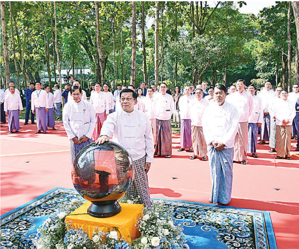
ပြည်ထောင်စုသမ္မတမြန်မာနိုင်ငံတော် ယာယီသမ္မတ နိုင်ငံတော်လုံခြုံရေးနှင့် အေးချမ်းသာယာရေးကော်မရှင်ဥက္ကဋ္ဌ ဗိုလ်ချုပ်မှူးကြီးမင်းအောင်လှိုင် အာကာသပြတိုက်(ရန်ကုန်)ဆိုင်းဘုတ်ကို စက်ခလုတ်နှိပ်ဖွင့်လှစ်ပေးစဉ်။

နေပြည်တော် နိုဝင်ဘာ ၃၀ ရန်ကုန်မြို့ ပြည်သူ့ရင်ပြင်ရှိအာကာသ ပြတိုက်(ရန်ကုန်) ဖွင့်ပွဲအခမ်းအနားကို ယနေ့နံနက်ပိုင်းတွင် ကျင်းပပြုလုပ်ရာ ပြည်ထောင်စုသမ္မတ မြန်မာနိုင်ငံတော် ယာယီသမ္မတ နိုင်ငံတော်လုံခြုံရေးနှင့် အေးချမ်းသာယာရေးကော်မရှင် ဥက္ကဋ္ဌ ဗိုလ်ချုပ်မှူးကြီးမင်းအောင်လှိုင် တက်ရောက်ဖွင့်လှစ်ပေးသည်။ အခမ်းအနားသို့ ကော်မရှင်အတွင်းရေးမှူး တွဲဖက်အမှုဆောင်ချုပ် ဗိုလ်ချုပ်ကြီးရဲဝင်းဦး၊ ပြည်ထောင်စုဝန်ကြီးများ၊ ရန်ကုန်တိုင်းဒေသကြီးဝန်ကြီးချုပ်၊ ကာကွယ်ရေးဦးစီးချုပ်ရုံးမှ အဆင့်မြင့် တပ်မတော်အရာရှိကြီးများ၊ ရန်ကုန်တိုင်း စစ်ဌာနချုပ် တိုင်းမှူး၊ တရုတ်ပြည်သူ့ သမ္မတနိုင်ငံ၊ ရုရှားဖက်ဒရေးရှင်းနိုင်ငံ၊ အိန္ဒိယနိုင်ငံနှင့် ဘယ်လာရစ်နိုင်ငံတို့မှ သံအမတ်ကြီးများနှင့် သံရုံးယာယီတာဝန်ခံ များ၊ ရန်ကုန်မြို့တော်ဝန်၊ ဖိတ်ကြားထား သည့် ဧည့်သည်တော်များ၊ ကျောင်းသား၊ ကျောင်းသူများတက်ရောက်ကြသည်။ ဦးစွာ နိုင်ငံတော်ယာယီသမ္မတ နိုင်ငံ တော်လုံခြုံရေးနှင့် အေးချမ်းသာယာရေး ကော်မရှင်ဥက္ကဋ္ဌသည် ဖွင့်ပွဲအခမ်းအနား ကျင်းပပြုလုပ်မည့်နေရာသို့ ရောက်ရှိ ကြရာ နိုင်ငံတကာသံတမန်များ၊ တာဝန်ရှိ သူများနှင့် ကျောင်းသား၊ ကျောင်းသူများ က ခရီးဦးကြိုဆိုနှုတ်ဆက်ကြသည်။