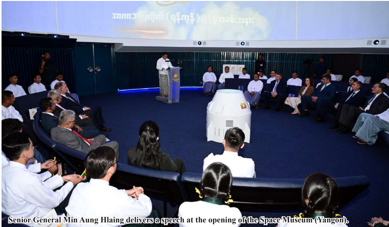
Senior General Min Aung Hlaing delivers a speech at the opening of the Space Museum (Yangon).