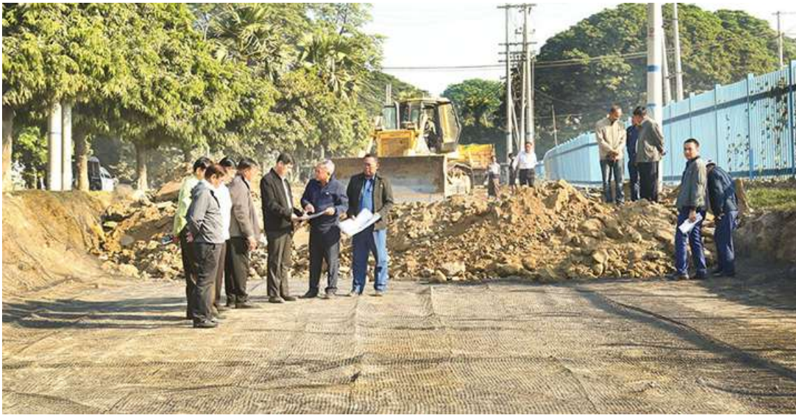
အတွင်း မြေလွှာလျှော့ပြတ်၍ ပပ်ကြား ရာခိုင်နှုန်းရရှိရန် အလွှာလိုက် ခင်းကြိတ် ခြင်း၊ Liquefaction၊ Sand Boil နှင့် Geo Material များ အသုံးပြုခြင်း၊ ကြည့်ရှုစစ်ဆေးခဲ့ကြောင်း သတင်း လမ်းလယ်ကျွန်းဧရိယာအတွင်း မလွတ် ရရှိသည်။ မျိုးကျော်

မန္တလေး နိုဝင်ဘာ ၃၀ မန္တလေးတိုင်းဒေသကြီးဝန်ကြီးချုပ် ဦးမျိုးအောင်သည် တိုင်းဒေသကြီး ဝန်ကြီးများနှင့် တာဝန်ရှိသူများလိုက်ပါပြီး ယနေ့နံနက်ပိုင်းက မန္တလေးငလျင်ကြီး ကြောင့်ပျက်စီးခဲ့သည့် အမရပူရမြို့နယ် နှင့်ချမ်းမြသာစည်မြို့နယ်ရှိ မန္တလေးမြို့ တော်စည်ပင်သာယာရေးကော်မတီ ရေဆိုး စုပ်ထုတ်စက်ရုံအမှတ်(၂) (ရွှေခဲ)နှင့် ရှမ်းကလေးကျွန်းကြား မြို့ပတ်လမ်း (ကမ်းနားလမ်း) လမ်းပိုင်းပျက်စီးမှုကို ပြင်ဆင်နေမှု၊ လမ်းလယ်ကျွန်းများ ပြုပြင်နေမှုများကို ကြည့်ရှုစစ်ဆေးသည်။ ထိုသို့ ကြည့်ရှုစစ်ဆေးစဉ် တိုင်းဒေသကြီးဝန်ကြီးချုပ်ကို တိုင်းဒေသ ကြီး စည်ပင်သာယာရေးဝန်ကြီးနှင့် တာဝန်ရှိသူများက လမ်းလွှာတည် ဆောက်မည့် အောက်အနက် လေးပေ