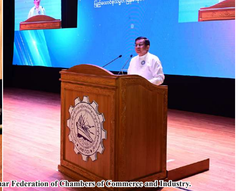
Senior General Min Aung Hlaing addresses the 34 th annual plenary session of the Union of Myanmar Federation of Chambers of Commerce and Industry.