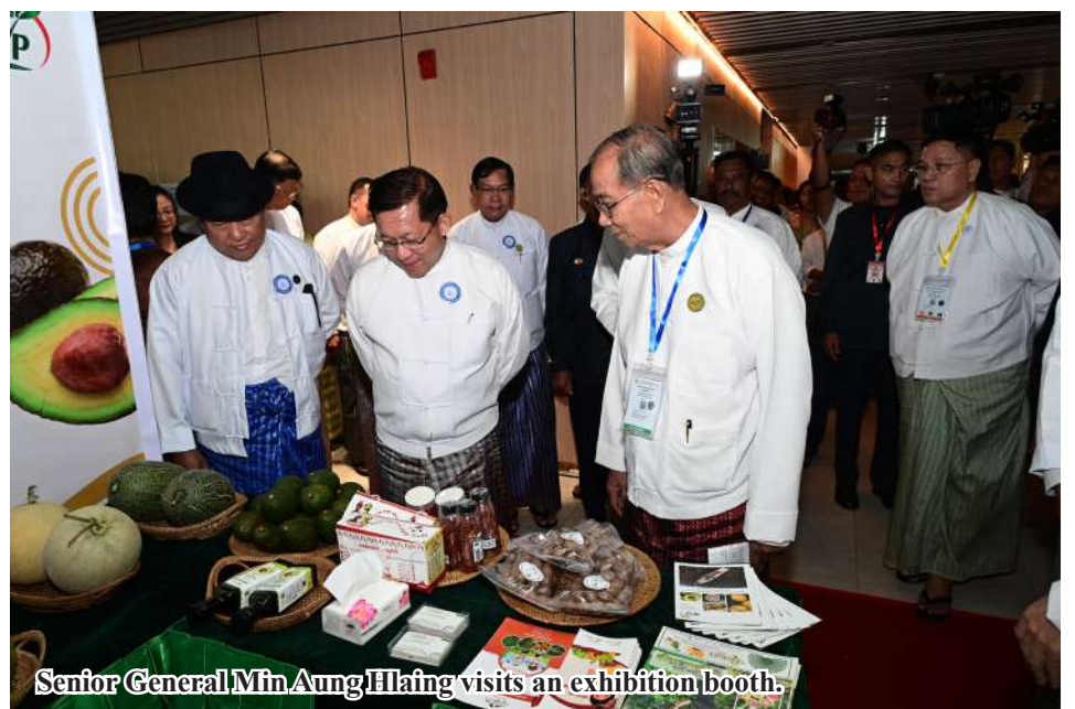
Senior General Min Aung Hlaing visits an exhibition booth.

government is always ready to overcome hardships and solve the problems private entrepreneurs face in practically materializing the policies and work programs. The private entrepreneurs should represent the majority in presenting their problems, policy suggestions sector wise. Only then will the gov-