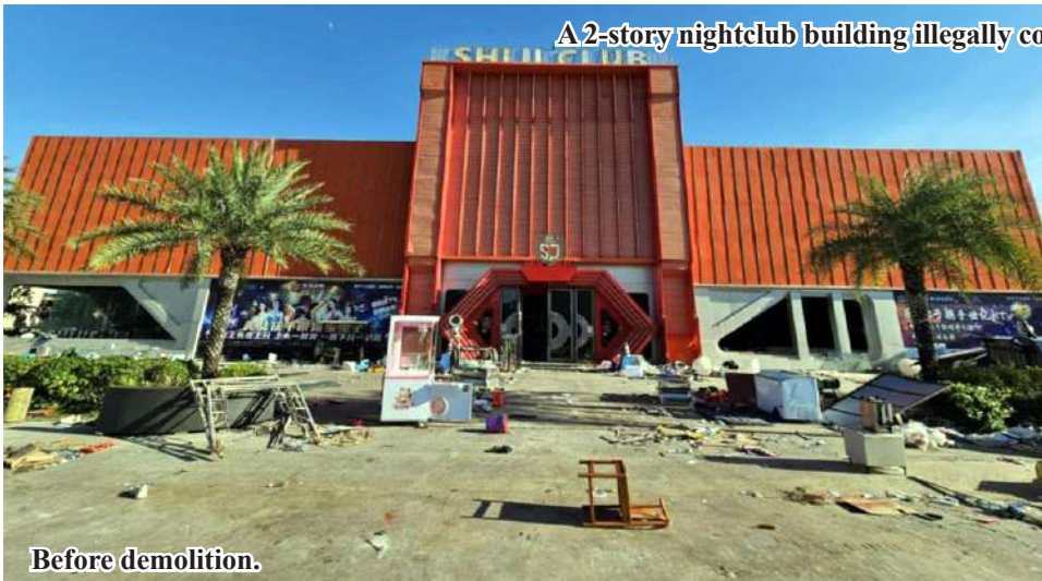
A 2-story nightclub building illegally constructed in section (3) of KK Park area