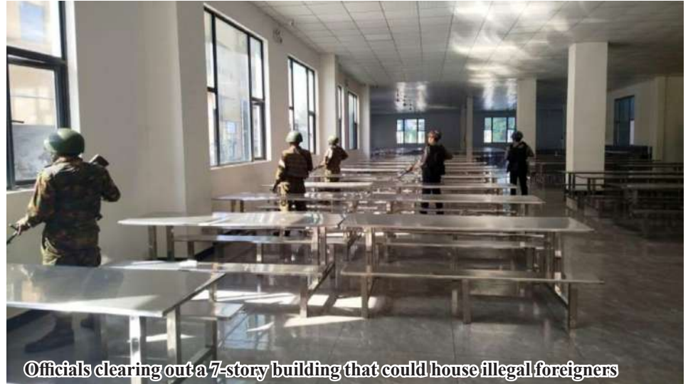
Officials clearing out a 7-story building that could house illegal foreigners