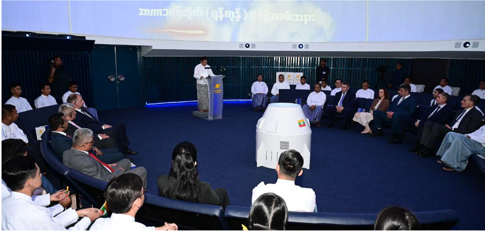
ပြည်ထောင်စုသမ္မတမြန်မာနိုင်ငံတော် ယာယီသမ္မတ နိုင်ငံတော်လုံခြုံရေးနှင့် အေးချမ်းသာယာရေးကော်မရှင်ဥက္ကဋ္ဌ ဗိုလ်ချုပ်မှူးကြီးမင်းအောင်လှိုင် အာကာသပြတိုက်(ရန်ကုန်) ဖွင့်ပွဲအခမ်းအနားတွင် မိန့်ခွန်းပြောကြားစဉ်။

နိုင်ငံတော်လုံခြုံရေးနှင့်အေးချမ်းသာယာရေးကော်မရှင်ဥက္ကဋ္ဌနှင့် အခမ်းအနားတက်ရောက်လာကြသူများသည် အာကာသနှင့် နက္ခတ်တာရာဆိုင်ရာ Dome Video Clip ကို ကြည့်ရှုကြသည်။