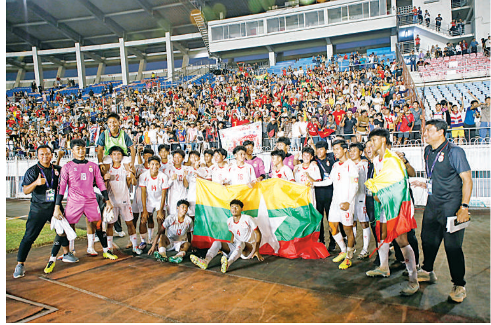
၂၀၂၆ ခုနှစ် အာရှဖလား ခြေစစ်ပွဲ အောင်မြင် ခဲ့သည့် မြန်မာ U-17 အသင်းကို တွေ့ရစဉ်။

ကျောနံပါတ်(၁၈) ထက်ဝေယံ၊ ကျော နံပါတ်(၁၉) ရဲနိုင်အောင်တို့က အကြိတ် အနယ်ယှဉ်ပြိုင်ကစားခဲ့ပြီး ဒုတိယပိုင်း ၄၅ မိနစ်တွင် ကျောနံပါတ်(၁၉) ရဲနိုင် အောင် အစား ကျောနံပါတ်(၉) ဒီဝေယံ ခန့်တို့ကို လဲလှယ်ယှဉ်ပြိုင်ကစားခဲ့ကြ ကလည်းကောင်း၊ ကျောနံပါတ်(၁၆) ချန် လန်တီန့် အစား ကျောနံပါတ်(၂) ပိုင်စိုး ကျော်ကလည်းကောင်း၊ ကျောနံပါတ်(၁၀) ညီညီသန့်အစား ကျောနံပါတ်(၂၃) ကောင်း ခန့်တို့ကို လဲလှယ်ယှဉ်ပြိုင်ကစားခဲ့ကြ