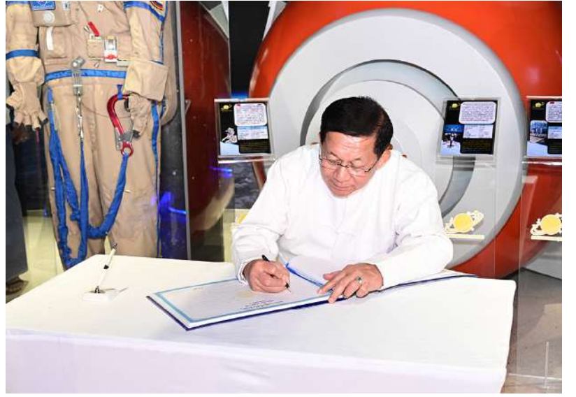
ပြည်ထောင်စုသမ္မတမြန်မာနိုင်ငံတော် ယာယီသမ္မတ နိုင်ငံတော်လုံခြုံရေးနှင့်အေးချမ်းသာယာရေးကော်မရှင်ဥက္ကဋ္ဌ ဗိုလ်ချုပ်မှူးကြီးမင်းအောင်လှိုင် အာကာသပြတိုက်(ရန်ကုန်) ဧည့်သည်တော်မှတ်တမ်းစာအုပ်တွင် မှတ်တမ်းတင်လက်မှတ်ရေးထိုးစဉ်။

ကို ဂါရဝပြုပေးအပ်သည်။ ထို့နောက် ရန်ကုန်တိုင်းဒေသကြီး ဝန်ကြီးချုပ်က တက်ရောက်လာသည့် နိုင်ငံတကာမှ သံတမန်များကို အမှတ်တရ လက်ဆောင်ပစ္စည်းများ ပေးအပ်သည်။ ယင်းနောက် နိုင်ငံတော်ယာယီသမ္မတ