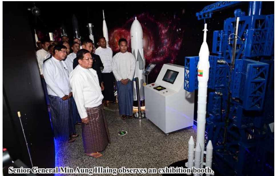
Senior General Min Aung Hlaing observes an exhibition booth.

museum, topics related to space knowledge they have read about in books or seen on television. This includes