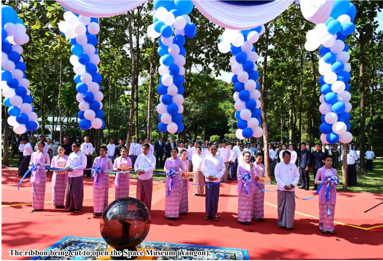
The ribbon being cut to open the Space Museum (Yangon).