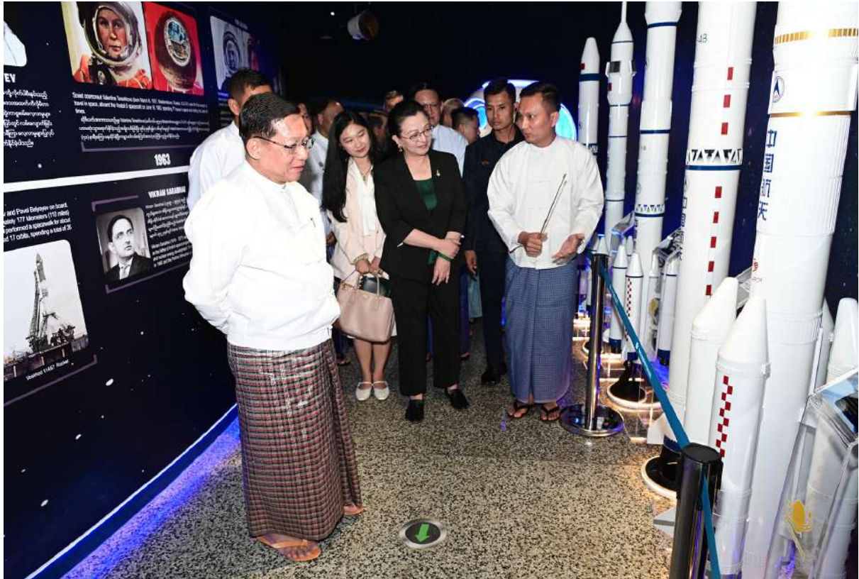
ပြည်ထောင်စုသမ္မတမြန်မာနိုင်ငံတော် ယာယီသမ္မတ နိုင်ငံတော်လုံခြုံရေးနှင့် အေးချမ်းသာယာရေးကော်မရှင်ဥက္ကဋ္ဌ ဗိုလ်ချုပ်မှူးကြီးမင်းအောင်လှိုင် ရှုရှားဖက်ဒရေးရှင်းနိုင်ငံ၊ တရုတ်ပြည်သူ့သမ္မတနိုင်ငံ၊ အိန္ဒိယနိုင်ငံနှင့် အမေရိကန်နိုင်ငံတို့မှ အာကာသတွင်းသို့ ခေတ်အဆက်ဆက်လွှတ်တင်ခဲ့သည့် ခုံးပျံများနှင့် အာကာသယာဉ်ပုံစံငယ်များကို လိုက်လံကြည့်ရှုစဉ်။

အဆိုပါ အာကာသပြတိုက်(ရန်ကုန်) သည် ရန်ကုန်မြို့၊ ပြည်သူ့ရင်ပြင်တွင်တည်ရှိပြီး ယခင်နက္ခတ်တာရာပြခန်းကို ခေတ်နှင့်အညီဖြစ်စေရေးအတွက် အဆင့်မြှင့်တင်ပြန်လည်မွမ်းမံခြင်းလုပ်ငန်းများကို ဆောင်ရွက်၍ အာကာသပြတိုက်(ရန်ကုန်)အဖြစ် ဖွင့်လှစ်ခဲ့ခြင်းဖြစ်ကြောင်း၊ ပြတိုက်အတွင်း Deep Space Exploration ပြခန်း၊ Space Station ပြခန်းနှင့် အာကာသတွင်းစေလွှတ်ခွဲသည့် ခုံးပျံများအာကာသတွင် လှည့်ပတ်သွားလာလျက်ရှိသည့် ဂြိုဟ်တုများ၊ အာကာသတွင်းစူးစမ်းလေ့လာသည့် အာကာသယာဉ်နှင့်ယာဉ်မှူးများ၊ ဂြိုဟ်များ၊ နက္ခတ်တာရာများအစရှိသည့် အာကာသဆိုင်ရာများကို ကြည့်ရှုလေ့လာနိုင်မည်ဖြစ်ကြောင်း သတင်းရရှိသည်။ (၅၀၁)