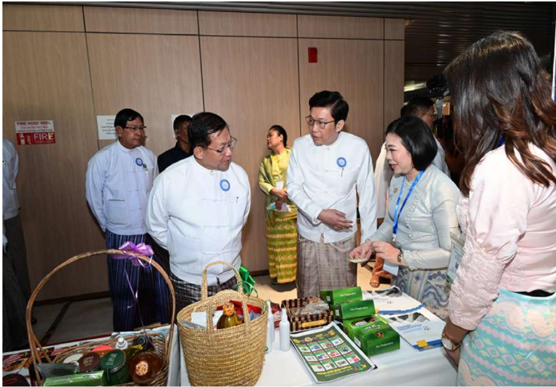
ပြည်ထောင်စုသမ္မတမြန်မာနိုင်ငံတော် ယာယီသမ္မတ နိုင်ငံတော်လုံခြုံရေးနှင့် အေးချမ်းသာယာရေးကော်မရှင်ဥက္ကဋ္ဌ ဗိုလ်ချုပ်မှူးကြီးမင်းအောင်လှိုင် ခင်းကျင်းပြသထားသည့် ပြခန်းများကို ပြခန်းတစ်ခုချင်းစီအလိုက် လိုက်လံကြည့်ရှုအားပေးစဉ်။

စာမျက်နှာ ၁၈ မှအဆက် ကဏ္ဍအသီးသီး၊ နယ်ပယ်အသီးသီးကို ကိုယ်စားပြုသည့် ညီနောင်အသင်းအဖွဲ့များအနေဖြင့်လည်း ကုန်သည်စက်မှုအသင်းချုပ်၏ ဦးဆောင်မှုအောက်တွင် စုစည်းစည်း ညီညီညွတ်ညွတ်ဖြင့် လက်တွဲဆောင်ရွက်ပေးကြရန် ပြောကြားလိုကြောင်း။