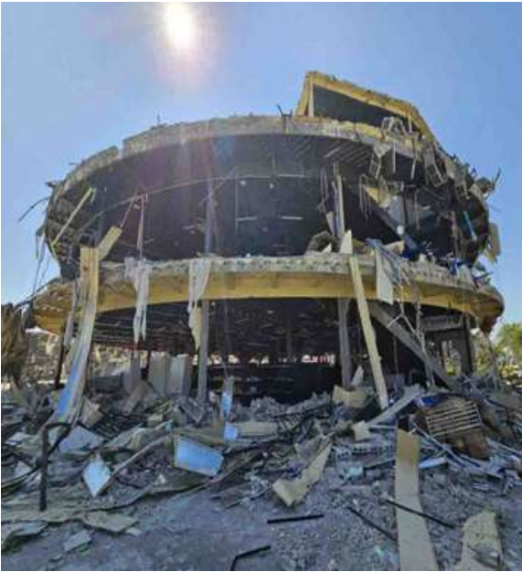
KK Park နယ်မြေအပိုင်း (၃) တွင် တရားမဝင်ဆောက်လုပ်ထားသည့် နှစ်ထပ်ဈေးဝယ်စင်တာ အဆောက်အအုံမဖြိုဖျက်မီနှင့် ဖြိုဖျက်ပြီးစီးမှု မှတ်တမ်းဓာတ်ပုံ။