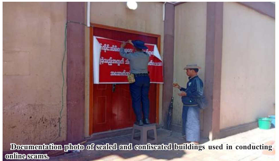
Documentation photo of sealed and confiscated buildings used in conducting online scams.