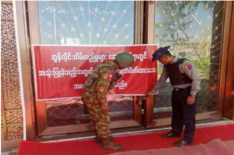
အွန်လိုင်းလိမ်လည်မှုများဆောင်ရွက်ရာတွင် အသုံးပြုခဲ့သည့် အဆောက်အအုံများကို ချိပ်ပိတ်သိမ်းဆည်းမှု မှတ်တမ်းဓာတ်ပုံ။

များ၊ ဈေးဆိုင်ခန်းများ၊ စတိုးဆိုင်များနှင့် အဆောက်အအုံ ၁၈ လုံးကို ထပ်မံချိပ်ပိတ်သိမ်းဆည်းနိုင်ခဲ့ပြီး တရားမဝင် အဆောက်အအုံ စုစုပေါင်း ၁၁၉ လုံး ချိပ်ပိတ်သိမ်းဆည်းပြီး ဖြစ်ကြောင်း သိရသည်။ ရွှေကုက္ကိုလ်နယ်မြေအတွင်း စုစုပေါင်း ဖော်ထုတ်ရှင်းလင်းမှုများအရ ယနေ့ထိ မြန်မာနိုင်ငံအတွင်းသို့ တရားမဝင် ဝင်ရောက်နေထိုင်သည့် ပြည်ပနိုင်ငံသား စုစုပေါင်း ၁၉၅၄ ဦးနှင့် အွန်လိုင်းလိမ် လည်လောင်းကစားမှု ကျူးလွန်ရာတွင် အသုံးပြုသည့် ကွန်ပျူတာအလုံး ၃၃၀၀၊ မိုဘိုင်းဖုန်းအလုံး ၂၀၈၇၀၊ Star Link ဗန်း ၁၀၂ လုံး၊ Router ၂၂ လုံးနှင့် လုပ်ငန်းသုံး ပစ္စည်းအများအပြားကို စိစစ်တွေ့ရှိ ဖမ်းဆီးရမိခဲ့ပြီး သိမ်းဆည်းရမိပစ္စည်းများ ကို စနစ်တကျဖျက်ဆီးရှင်းလင်းခဲ့ ကြောင်းနှင့် ဖော်ထုတ်ရှင်းလင်းခြင်း များ ဆက်လက်ဆောင်ရွက်သွားမည်ဖြစ်