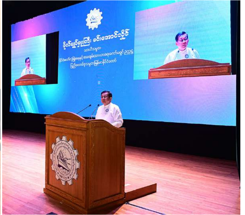
ပြည်ထောင်စုသမ္မတမြန်မာနိုင်ငံတော် ယာယီသမ္မတ နိုင်ငံတော်လုံခြုံရေးနှင့် အေးချမ်းသာယာရေးကော်မရှင်ဥက္ကဋ္ဌ ဗိုလ်ချုပ်မှူးကြီးမင်းအောင်လှိုင် ကုန်သည်များနှင့် စက်မှုလက်မှုလုပ်ငန်းရှင်များအသင်းချုပ် ၃၄ ကြိမ်မြောက် နှစ်ပတ်လည်အသင်းသားစုံညီအစည်းအဝေးတွင် အမှာစကားပြောကြားစဉ်။