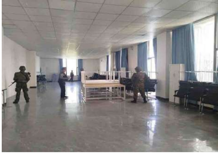
တရားမဝင်နိုင်ငံခြားသားများထားရှိနိုင်သည့် သုံးထပ်တိုက်အဆောက်အအုံ ဝင်ရောက်ရှင်းလင်းနေမှုကို တွေ့ရစဉ်။

ကစားမှုများ အများဆုံးအခြေချလုပ်ကိုင် လျက်ရှိကြသည့် ရွှေကုက္ကိုလ်နယ်မြေနှင့် KK Park နယ်မြေတို့၌ လုံခြုံရေးတပ်ဖွဲ့ ဝင်များ၊ အုပ်ချုပ်ရေးအဖွဲ့အစည်းများနှင့် ဒေသတွင်း တာဝန်ရှိသူများအပါအဝင် အဖွဲ့စုံပါဝင်သည့် ပူးပေါင်းအဖွဲ့ဖြင့် တရားမဝင် အဆောက်အအုံများအတွင်း ဝင်ရောက်ရှင်းလင်းခြင်း၊ အွန်လိုင်း လိမ်လည်လောင်းကစားမှု လုပ်ငန်းစဉ် များတွင်အသုံးပြုခဲ့သည့် သိမ်းဆည်းရမိ