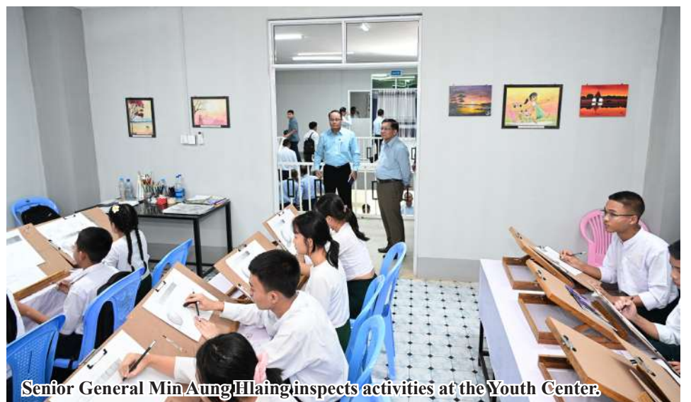
Senior General Min Aung Hlaing inspects activities at the Youth Center.

Later, the Senior General visited the construction site of the Zwegabin Indoor Stadium in Hlakamyin Kawt Thit. In a briefing room, a responsible person explained the status of the stadium’s construction progress by fiscal year, the status of the layout and construction