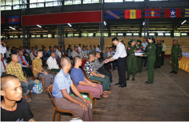
ဧရာဝတီတိုင်းဒေသကြီးဝန်ကြီးချုပ် ဦးတင်မောင်ဝင်း နိုင်ငံ့သားကောင်းရတနာများကို အဝတ်အထည်များပေးအပ်စဉ်။

နေပြည်တော် နိုဝင်ဘာ ၁၅ (၁၉)သို့ တက်ရောက်မည့် ဒေသကြီးအတွင်းမှ နိုင်ငံ့သားကောင်းရတနာများကို ယနေ့နံနက်ပိုင်းတွင် တိုင်းဒေသကြီးဝန်ကြီးချုပ် ဦးတင်မောင်ဝင်း၊ အနောက်တောင်တိုင်းစစ်ဌာနချုပ် တိုင်းမှူး ဗိုလ်ချုပ်စိုးကျော်ထက်နှင့် တာဝန်ရှိသူများက ပုသိမ်တပ်နယ် အားကစားခန်းမ၌ သွားရောက်