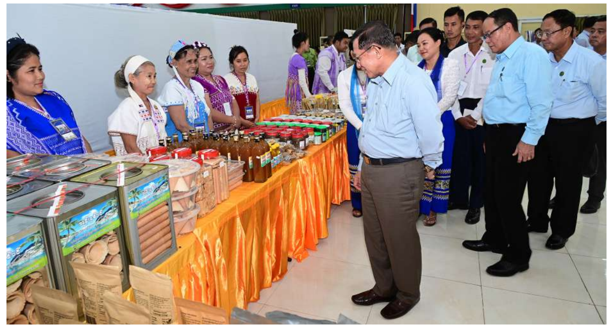
ပြည်ထောင်စုသမ္မတမြန်မာနိုင်ငံတော် ယာယီသမ္မတ နိုင်ငံတော်လုံခြုံရေးနှင့် အေးချမ်းသာယာရေးကော်မရှင်ဥက္ကဋ္ဌ ဗိုလ်ချုပ်မှူးကြီးမင်းအောင်လှိုင် ခင်းကျင်းပြသထားသည့် ကရင်ပြည်နယ်အတွင်းရှိ အသေးစား၊ အငယ်စားနှင့် အလတ်စားစီးပွားရေး (MSME) လုပ်ငန်းများက ထွက်ရှိသည့် ထုတ်ကုန်ပစ္စည်းများကို စိတ်ပါဝင်စားစွာဖြင့် လှည့်လည်ကြည့်ရှုစဉ်။

ရေလျှံမှုလျော့နည်းစေရေး လိုအပ်သည့် မြစ်ကြောင်းနေရာများကို သောင်တူးဖော်ရေးလုပ်ငန်းများဆောင်ရွက်ရန် စီစဉ်ဆောင်ရွက်လျက်ရှိမှု၊ ဘားအံမြို့အား ရေကြီးရေလျှံမှုလျော့ပါးစေရေး ရေထိန်းတံခံများတည်ဆောက်ရန်အတွက် လျာထားဆောင်ရွက်လျက်ရှိမှုအခြေအနေများကို ဖြည့်စွက်ရှင်းလင်းတင်ပြကြသည်။ ရှင်းလင်းတင်ပြမှုများနှင့် ပတ်သက်၍ နိုင်ငံတော်ယာယီသမ္မတ နိုင်ငံတော်လုံခြုံရေးနှင့် အေးချမ်းသာယာရေးကော်မရှင်ဥက္ကဋ္ဌ က နေရောင်ခြည်စွမ်းအင်သုံးလျှပ်စစ်ဓာတ်အားထုတ်လုပ်မှုနှင့်ပတ်သက်၍ ဘားအံမြို့၏ လျှပ်စစ်ဓာတ်အားလိုအပ်ချက်နှင့် အခြားမြို့များ၏ လျှပ်စစ်ဓာတ်အားလိုအပ်ချက်များကိုတွက်ချက်၍ ဆောင်ရွက်သွားရန်လိုကြောင်း၊ ဘားအံမြို့ရေကြီးရေလျှံမှုနှင့် ပတ်သက်၍ အထက်ပိုင်းဒေသတွင် မိုးများစွာရွာသွန်းသည့်အချိန်နှင့် ဒီဂရေတက်သည့်