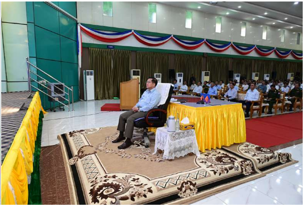
ပြည်ထောင်စုသမ္မတမြန်မာနိုင်ငံတော် ယာယီသမ္မတ နိုင်ငံတော်လုံခြုံရေးနှင့် အေးချမ်းသာယာရေးကော်မရှင်ဥက္ကဋ္ဌ ဗိုလ်ချုပ်မှူးကြီးမင်းအောင်လှိုင်အား ကရင်ပြည်နယ်အတွင်း ရွေးကောက်ပွဲကျင်းပပြုလုပ်ရန်အတွက် ကြိုတင်ပြင်ဆင်ဆောင်ရွက်လျက်ရှိမှု၊ ပြည်နယ်ဆိုင်ရာအချက်အလက်များနှင့် စိုက်ပျိုးရေးလုပ်ငန်းများဆောင်ရွက်လျက်ရှိမှုအခြေအနေများနှင့်စပ်လျဉ်း၍ တာဝန်ရှိသူတစ်ဦးက ရှင်းလင်းတင်ပြစဉ်။