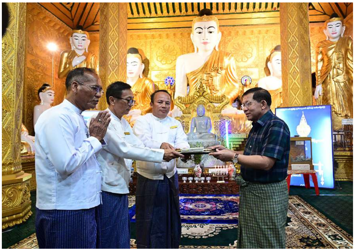
ပြည်ထောင်စုသမ္မတမြန်မာနိုင်ငံတော် ယာယီသမ္မတ နိုင်ငံတော်လုံခြုံရေးနှင့်အေးချမ်းသာယာရေးကော်မရှင်ဥက္ကဋ္ဌ ဗိုလ်ချုပ်မှူးကြီးမင်းအောင်လှိုင် ကျိုက်သလွံစေတီတော်မြတ်ကြီးအတွက် အလှူငွေများ ပေးအပ်လှူဒါန်းစဉ်။

အဖွဲ့က လက်ခံရယူပြီး ဂုဏ်ပြုမှတ်တမ်း လွှာပြန်လည်ပေးအပ်သည်။ အလားတူ ယနေ့ညနေပိုင်းတွင် နိုင်ငံတော်ယာယီသမ္မတ နိုင်ငံတော်လုံခြုံရေးနှင့်အေးချမ်းသာယာရေးကော်မရှင်ဥက္ကဋ္ဌ နှင့်အဖွဲ့ဝင်များသည် မော်လမြိုင်ကမ်းနားလမ်းသို့ ရောက်ရှိပြီး ကမ်းနားလမ်းရှိ ညဈေးတန်း၌ ဒေသရိုးရာအစားအသောက်များ၊ ဈေးဆိုင်ခန်းများဖွင့်လှစ်ရောင်းချနေမှုများကို လိုက်လံကြည့်ရှုပြီး ဈေးရောင်းချနေသူများနှင့် လာရောက်စားသုံးကြသည့် ပြည်သူလူထုများကို ရင်းရင်းနှီးနှီး နှုတ်ဆက်သည်။ ထို့နောက် ကမ်းနားလမ်း မြစ်ကမ်းဘက်ခြမ်း၌ အားကစားပြုလုပ်ရန်နှင့် အပန်းဖြေရန်နေရာများ ပြုလုပ်သွားရန်နှင့် လမ်းအဆင့်မြှင့်တင်ဆောင်ရွက်သွားနိုင်မည့် အခြေအနေများ၊ ကမ်းနားလမ်းတစ်လျှောက် သန့်ရှင်းသာယာလှပရေး ဆောင်ရွက်သွားရန် လိုအပ်သည့်အခြေအနေများနှင့်ပတ်သက်၍ တာဝန်ရှိသူများကို လမ်းညွှန်မှာကြားခဲ့ကြောင်း သတင်းရရှိသည်။ (၅၀၁)