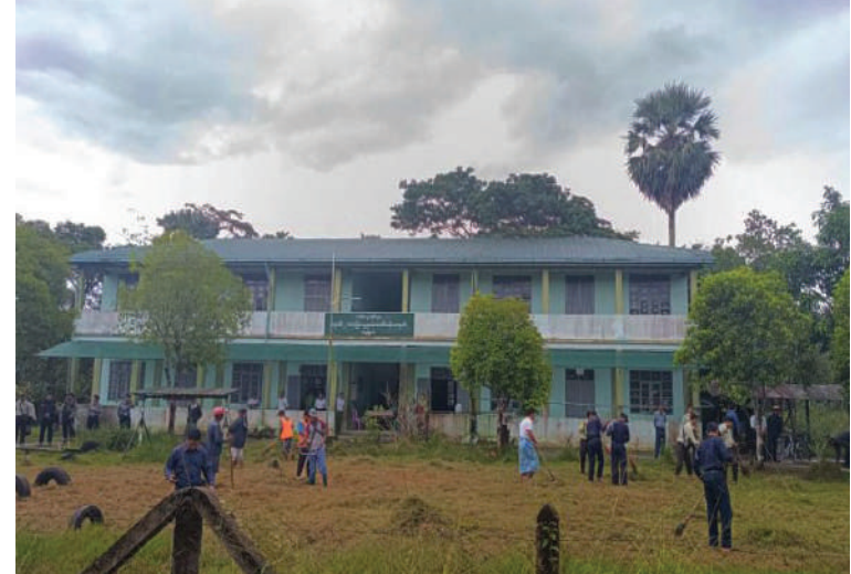
ရန်ကုန်တိုင်းဒေသကြီး အခြေခံပညာကျောင်း၌ စုပေါင်းသန့်ရှင်းရေးလုပ်ငန်း များ ဆောင်ရွက်ကြစဉ်။

အသင်းအဖွဲ့များနှင့် ဒေသခံပြည်သူများက အခြေခံပညာကျောင်းများ အတွင်း၊ အပြင် ရှိ ချုံနွယ်ပေါင်းမြက်များ ခုတ်ထွင်ရှင်းလင်း ခြင်း၊ အမှိုက်များရှင်းလင်းခြင်း၊ ရေစီး ရေလာကောင်းမွန်စေရေး ရေနုတ်မြောင်း များ တူးဖော်ပေးခြင်း၊ ရေကန်များတွင် အဘိတ်ဆေးများခတ်ပေးခြင်း၊ ခြင်ခို အောင်းနိုင်သည့် နေရာများကို ခြင်ဆေး