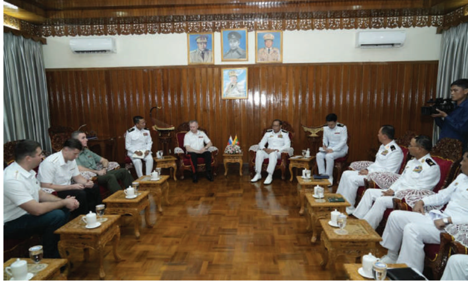
တပ်မတော်(ရေ)မှ စစ်ဦးစီးအရာရှိချုပ်(ရေ) ဒုတိယဗိုလ်ချုပ်ကြီးအေးမင်းထွေးနှင့် ရုရှားရေတပ်မှ ဒုတိယရေတပ်ဦးစီးချုပ် ဒုတိယဗိုလ်ချုပ်ကြီး Aleksei Anatolievich Kiiashko ဦးဆောင်သော ကိုယ်စားလှယ်အဖွဲ့တို့ တွေ့ဆုံဆွေးနွေးစဉ်။

နိုင်ငံတော်သမ္မတရုံးဝန်ကြီးဌာန(၂) ပြည်ထောင်စုဝန်ကြီး ဦးကိုကိုလှိုင်သည် ယမန်နေ့ညပိုင်းတွင် လေကြောင်းခရီးဖြင့် ရန်ကုန်မြို့သို့ပြန်လည်ရောက်ရှိခဲ့ကြောင်း သတင်းရရှိသည်။ (သတင်းစဉ်)