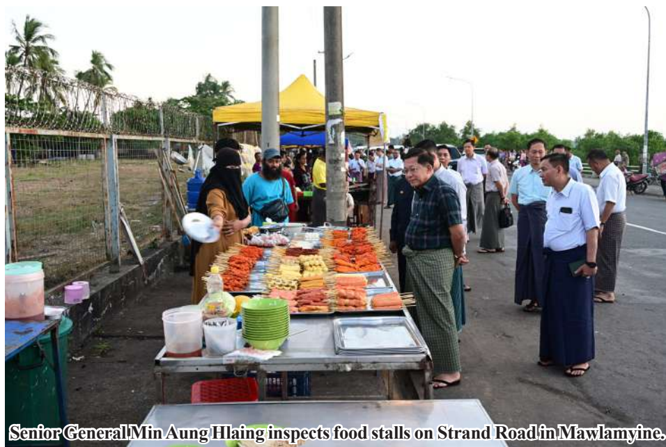
Senior General Min Aung Hlaing inspects food stalls on Strand Road in Mawlamyine.