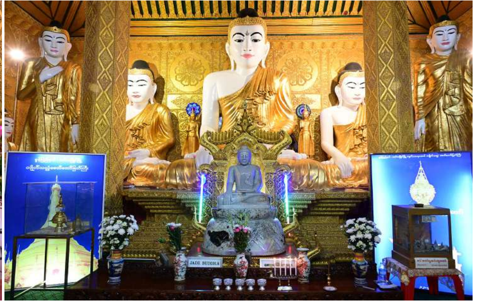
ပြည်ထောင်စုသမ္မတမြန်မာနိုင်ငံတော် ယာယီသမ္မတ နိုင်ငံတော်လုံခြုံရေးနှင့်အေးချမ်းသာယာရေးကော်မရှင်ဥက္ကဋ္ဌ ဗိုလ်ချုပ်မှူးကြီးမင်းအောင်လှိုင် မွန်ပြည်နယ် မော်လမြိုင်မြို့ ကျက်သရေဆောင် ကျိုက်သလွံစေတီတော် မြတ်ကြီးရှိ ဗုဒ္ဓရုပ်ပွားတော်မြတ်အား ဖူးမြော်ကြည်ညို၍ ပန်း၊ ရေချမ်း၊ ဆီမီးများ ကပ်လှူပူဇော်စဉ်။

နေပြည်တော် နိုဝင်ဘာ ၁၅ ပြည်ထောင်စုသမ္မတမြန်မာနိုင်ငံတော် ယာယီသမ္မတ နိုင်ငံတော်လုံခြုံရေးနှင့် အေးချမ်းသာယာရေးကော်မရှင် ဥက္ကဋ္ဌ ဗိုလ်ချုပ်မှူးကြီးမင်းအောင်လှိုင်သည် ခရီးစဉ်တွင် လိုက်ပါလာသည့် အဖွဲ့ဝင်များနှင့် အတူ ယနေ့ညနေပိုင်းတွင် မွန်ပြည်နယ် မော်လမြိုင်မြို့ ကျက်သရေဆောင် ကျိုက်သလွံစေတီတော်မြတ်ကြီးသို့ သွားရောက် ဖူးမြော်ကြည်ညိုသည်။ ဦးစွာ နိုင်ငံတော်ယာယီသမ္မတ နိုင်ငံတော်လုံခြုံရေးနှင့် အေးချမ်းသာယာရေး ကော်မရှင်ဥက္ကဋ္ဌနှင့် အဖွဲ့ဝင်များအား ဂေါပကအဖွဲ့ဝင်များက ကြိုဆိုနှုတ်ဆက် ကြသည်။ ထို့နောက် စေတီတော်မြတ်ကြီးအား လက်ယာရစ်လှည့်လည်ဖူးမြော် ကြည့်ညို၍ မော်လမြိုင်မြို့ ညနေနေဝင် ချိန်ရှခင်းကို ကြည့်ရှုသည်။ ထို့နောက် စေတီတော်မြတ်ကြီးရှိ ဗုဒ္ဓရုပ်ပွားတော်မြတ်အား ဖူးမြော်ကြည်ညို၍ ပန်း၊ ရေချမ်း၊ ဆီမီးများ ကပ်လှူပူဇော်ပြီး အလှူငွေများ ပေးအပ်လှူဒါန်းရာ ဂေါပက