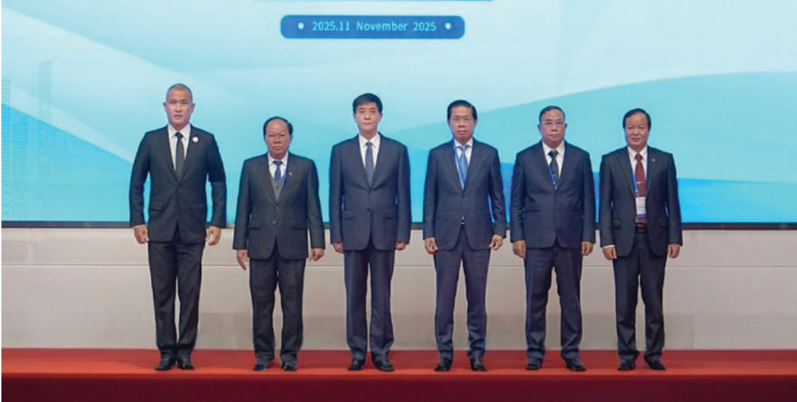
တရုတ်-မြန်မာ-ထိုင်း-ကမ္ဘောဒီးယား-လာအိုနှင့် ဗီယက်နမ်နိုင်ငံတို့အကြား ပထမအကြိမ် အွန်လိုင်းလိမ်လည်မှုပူးပေါင်း တိုက်ဖျက်ရေးဆိုင်ရာ ဝန်ကြီးအဆင့်အစည်းအဝေး တက်ရောက်လာကြသူများ စုပေါင်းမှတ်တမ်းတင်ဓာတ်ပုံရိုက်စဉ်။

နေပြည်တော် နိုဝင်ဘာ ၁၅ တရုတ်-မြန်မာ-ထိုင်း-ကမ္ဘောဒီးယား- လာအို၊ ဗီယက်နမ်နိုင်ငံတို့အကြား ပထမ အကြိမ် အွန်လိုင်းလိမ်လည်မှု ပူးပေါင်း တိုက်ဖျက်ရေးဆိုင်ရာ ဝန်ကြီးအဆင့် အစည်းအဝေးကို နိုဝင်ဘာ ၁၄ ရက် နံနက် ၉ နာရီမှ ညနေ ၅ နာရီထိ တရုတ် ပြည်သူ့သမ္မတနိုင်ငံ ကူမင်းမြို့ရှိ Hai Geng (ဟိုင်ဂင်)ဟိုတယ်၌ ကျင်းပပြုလုပ် ခဲ့သည်။ အစည်းအဝေးသို့ မြန်မာနိုင်ငံ ပြည်ထဲရေးဝန်ကြီးဌာန ဒုတိယဝန်ကြီး