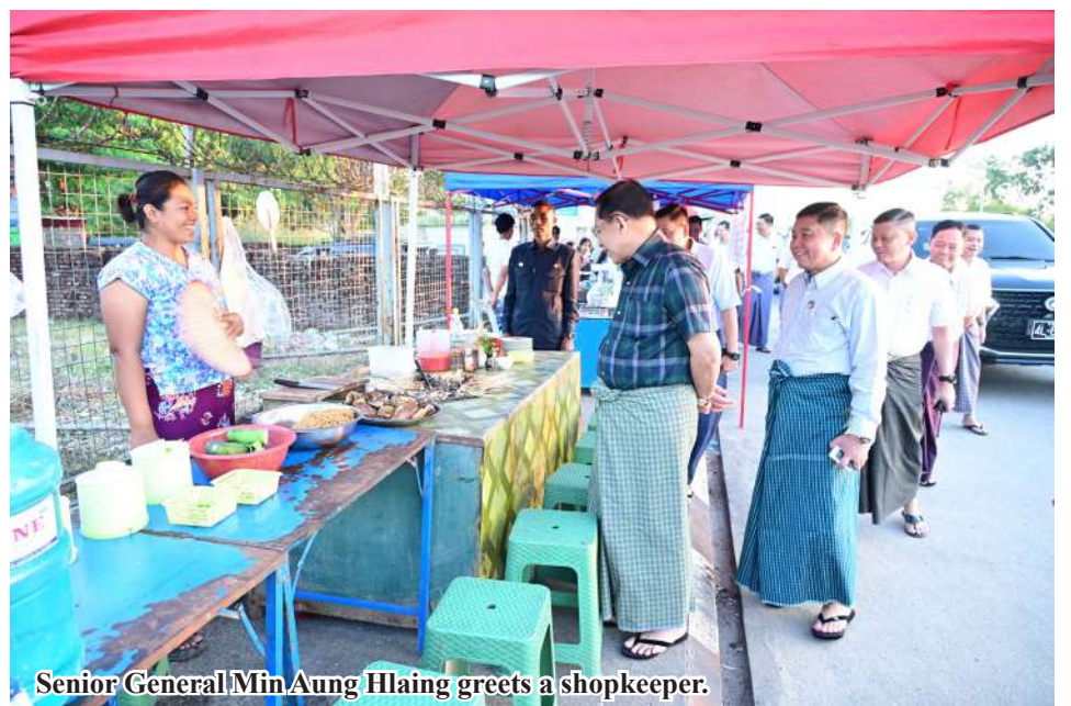
Senior General Min Aung Hlaing greets a shopkeeper.