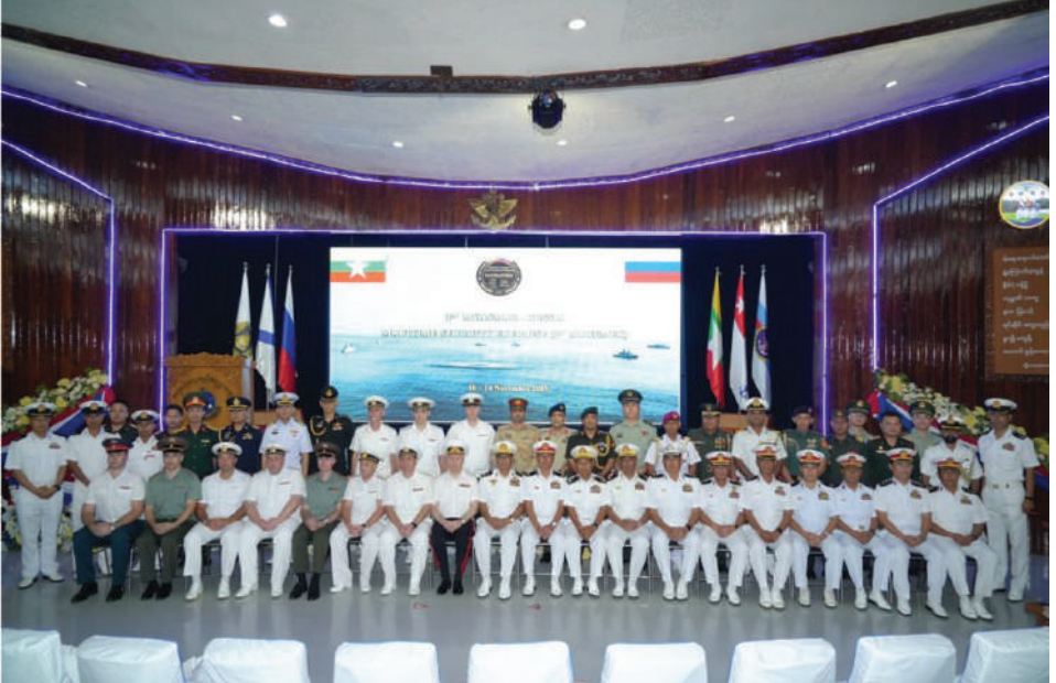
တတိယအကြိမ် မြန်မာ-ရုရှား ရေကြောင်းလုံခြုံရေးဆိုင်ရာ လေ့ကျင့်ခန်းဖွင့်ပွဲအခမ်းအနားတွင် အမှတ်တရပေါင်းဓာတ်ပုံရိုက်စဉ်။

ရင်းနှီးပွင့်လင်းစွာ အမြင်ချင်းဖလှယ်ဆွေးနွေးကြပြီး ဆွေးနွေးပွဲအပြီးတွင် အမှတ်တရပေါင်းဓာတ်ပုံရိုက်ကြသည်။ ထို့ပြင် တတိယအကြိမ် မြန်မာ-ရုရှား ရေကြောင်းလုံခြုံရေးဆိုင်ရာ လေ့ကျင့်ခန်းဖွင့်ပွဲအခမ်းအနားကို နိုဝင်ဘာ ၁၂ ရက်နံနက်ပိုင်းတွင် ရေတပ်လေ့ကျင့်ရေးဌာနချုပ် သီရိမဟာဇေယျကျော်ထင်ခန်းမ၌ ကျင်းပပြုလုပ်ရာ တပ်မတော်(ရေ)မှ စစ်ဦးစီးအရာရှိချုပ်(ရေ)နှင့် အရာရှိစစ်သည်များ၊ ရုရှားရေတပ်မှ ဒုတိယရေတပ်ဦးစီးချုပ်နှင့် အရာရှိ စစ်သည်များ၊ မြန်မာနိုင်ငံဆိုင်ရာ ရုရှားစစ်သံမှူး၊ လေ့လာသူများအဖြစ်ဖိတ်ကြားထားသည့် တရုတ်၊ အိန္ဒိယ၊ ကမ္ဘောဒီးယား၊ အင်ဒိုနီးရှား၊ လာအို၊ ဖိလစ်ပိုင်၊ ထိုင်း၊ ဗီယက်နမ်၊ ဘင်္ဂလားဒေ့ရှ်၊ ပါကစ္စတန်နိုင်ငံတို့မှ မြန်မာနိုင်ငံဆိုင်ရာစစ်သံမှူးများ တက်ရောက်ကြပြီး ဖွင့်ပွဲအခမ်းအနားအပြီးတွင် အမှတ်တရပေါင်းဓာတ်ပုံရိုက်ကြသည်။ အဆိုပါစစ်ရေယာဉ်များ ရန်ကုန်မြို့သို့ရောက်ရှိနေစဉ်အတွင်း ချစ်ကြည်ရေးဘောလုံးပြိုင်ပွဲ၊ ဘော်လီဘောပြိုင်ပွဲ၊ ဘတ်စကက်ဘောပြိုင်ပွဲ၊ ရေကူးပြိုင်ပွဲနှင့်