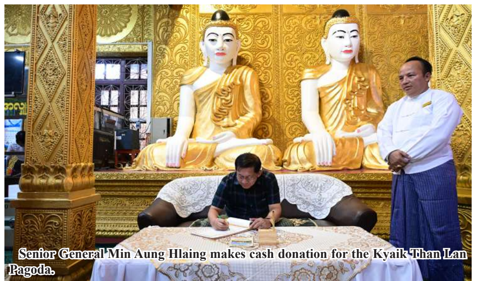
Senior General Min Aung Hlaing makes cash donation for the Kyaik Than Lan Pagoda.

to Strand Road in Mawlamyine and inspected stalls selling regional traditional food and other shops before cordially greeting shopkeepers and customers. Then, the Senior General gave instructions on construction of sites for sports and recreation on the riverside of the road, upgrading tasks of the road and the needs to take measures for cleanliness and pleasantness along the road to responsible officials. 100