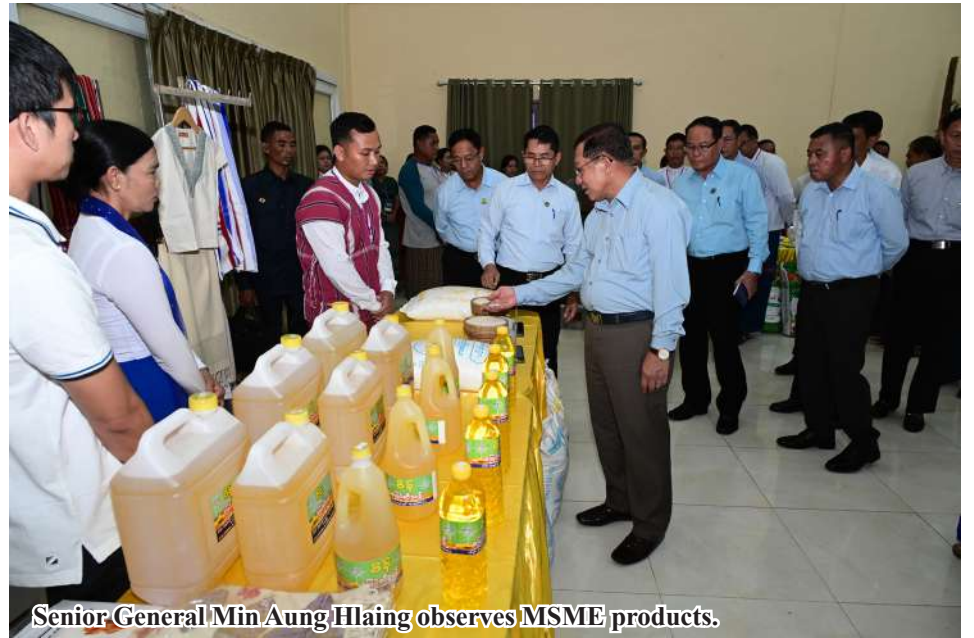
Senior General Min Aung Hlaing observes MSME products.

Local elders and entrepreneurs presented a report on food and other necessary aid provided by the Union government and Kayin State government for victims of floods triggered by Thanlwin River in Hpa-an, the need to carry out drainage activities to prevent further river floods in Hpa-an, extra loans for livestock breeding, provision of inputs for paddy cultivation, efforts for further development of hotels and tourism business, more finan-