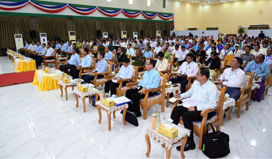
ပြည်ထောင်စုသမ္မတမြန်မာနိုင်ငံတော် ယာယီသမ္မတ နိုင်ငံတော်လုံခြုံရေးနှင့်အေးချမ်းသာယာရေးကော်မရှင်ဥက္ကဋ္ဌ ဗိုလ်ချုပ်မှူးကြီးမင်းအောင်လှိုင် ကရင်ပြည်နယ် ဘားအံမြို့ရှိ ပြည်နယ်အဆင့် ဌာနဆိုင်ရာတာဝန်ရှိသူ များနှင့် မြို့မိမြို့ဖများကို တွေ့ဆုံ၍ ဒေသဖွံ့ဖြိုးတိုးတက်ရေးဆိုင်ရာများ ဆွေးနွေးပြောကြားစဉ်။

နေပြည်တော် နိုဝင်ဘာ ၁၅ ဆိုင်ရာတာဝန်ရှိသူများနှင့် မြို့မိမြို့ဖများ ဆောင်ချုပ် ဗိုလ်ချုပ်ကြီးရဲဝင်းဦး၊ ဘားအံမြို့ရှိ ပြည်နယ်အဆင့်ဌာနဆိုင်ရာ ကြိုတင်ပြင်ဆင်မှုများ ဆောင်ရွက်လျက် ပြည်ထောင်စုသမ္မတမြန်မာနိုင်ငံတော် ကို ယနေ့နံနက်ပိုင်းတွင် တွေ့ဆုံ၍ ဒေသ ပြည်ထောင်စုဝန်ကြီးများ၊ ကာကွယ်ရေး တာဝန်ရှိသူများ၊ မြို့မိမြို့ဖများ၊ MSME ရှိမူ၊ ပြည်နယ်ဆိုင်ရာအချက်အလက်များ၊ ယာယီသမ္မတ နိုင်ငံတော်လုံခြုံရေးနှင့် ဖွံ့ဖြိုးတိုးတက်ရေးဆိုင်ရာများ ဆွေးနွေး ပြောကြားသည်။ အဆိုပါ တွေ့ဆုံပွဲအခမ်းအနားသို့ ချုပ် ဦးစောမြင့်ဦး၊ အရှေ့တောင်တိုင်းစစ် ဌာနချုပ် တိုင်းမှူး၊ ဒုတိယဝန်ကြီးများ၊ ဦးစွာ ကရင်ပြည်နယ်ဝန်ကြီးချုပ်က ရွေးကောက်ပွဲ ကျင်းပပြုလုပ်ရန်အတွက် တရားမဝင်ကုန်ပစ္စည်းများ ဖမ်းဆီးရမိမှု နှင့် တရားမဝင်ကုန်သွယ်မှုတို့ကိုဖျက်ရေး လုပ်ငန်းများဆောင်ရွက်လျက်ရှိမူ၊ စာမျက်နှာ ၁၆ ကော်လံ ၁ ပုံ