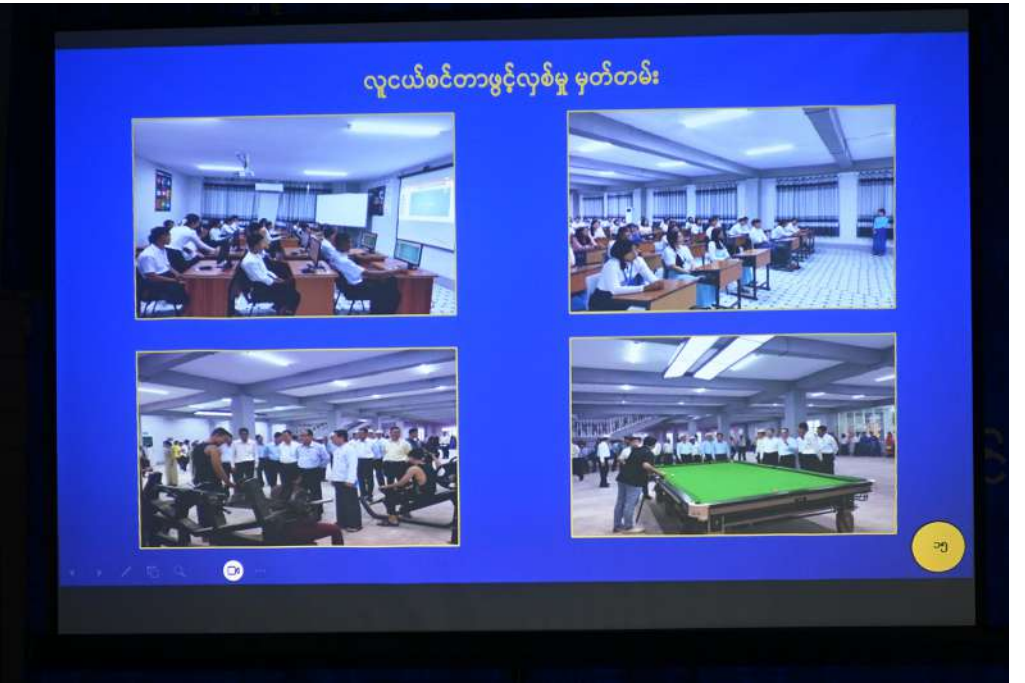
ပြည်ထောင်စုသမ္မတမြန်မာနိုင်ငံတော် ယာယီသမ္မတ နိုင်ငံတော်လုံခြုံရေးနှင့် အေးချမ်းသာယာရေးကော်မရှင်ဥက္ကဋ္ဌ ဗိုလ်ချုပ်မှူးကြီးမင်းအောင်လှိုင်အား ပြည်နယ်လူမှုရေးရာဝန်ကြီးက လူငယ်စင်တာတည်ဆောက်မှုဆိုင်ရာ များ၊ သင်တန်းများဖွင့်လှစ်ခဲ့မှုနှင့် နည်းပညာရပ်ဆိုင်ရာဟောပြောပွဲများ ပို့ချပေးခဲ့မှုအခြေအနေများ၊ ဆက်လက်ဆောင်ရွက်သွားမည့်အစီအမံများနှင့်ပတ်သက်၍ ရှင်းလင်းတင်ပြစဉ်။

အတွင်း ရွေးကောက်ပွဲကျင်းပပြုလုပ်တော့ မည်ဖြစ်ကြောင်း၊ ရွေးကောက်ပွဲပြီးဆုံးပြီးချိန် တွင် ရွေးကောက်ခံကိုယ်စားလှယ်များနှင့် အစိုးရအသစ်ဖြင့် နိုင်ငံတော်တာဝန်ကို ဆောင်ရွက်သွားရမည်ဖြစ်ကြောင်း၊ မိမိတို့ အနေဖြင့် ပြည်သူများလိုလားချက်ဖြစ်သည့် ပါတီစုံဒီမိုကရေစီစနစ်ပေါ်တွင် ဆက်လက် လျှောက်လှမ်းသွားမည်ဖြစ်ကြောင်း၊ ကောင်းမွန်သည့် ရွေးကောက်ခံကိုယ်စားလှယ်များ ဖြင့် ကောင်းမွန်သည့်နိုင်ငံရေးလမ်းကြောင်းကို ဆောင်ရွက်သွားရမည်ဖြစ်ကြောင်း၊ နယ်မြေတည်ငြိမ်အေးချမ်းမှုရှိသည့် ဒေသများတွင် တိုးတက်မှုများရရှိနိုင်မည်ဖြစ် သကဲ့သို့ တည်ငြိမ်အေးချမ်းမှုမရှိသည့် ဒေသများတွင် မည်သည့်နိုင်ငံရေးစနစ်ကို ကျင့်သုံးသည်ဖြစ်စေ ဖွံ့ဖြိုးတိုးတက်မှုများ ရရှိနိုင်မည်မဟုတ်ကြောင်း။