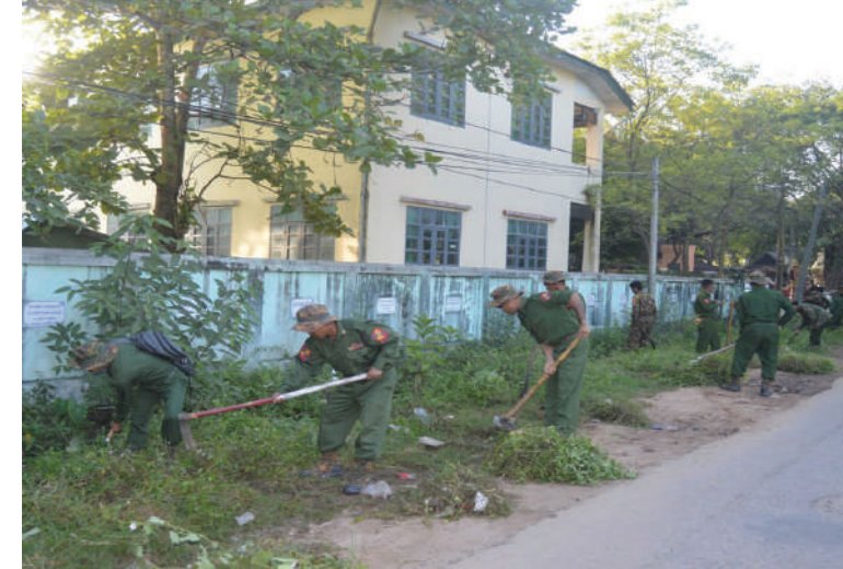
တောင်ပိုင်းတိုင်းစစ်ဌာနချုပ်မှ နယ်မြေခံတပ်မတော်သားများက စုပေါင်း သန့်ရှင်းရေးလုပ်ငန်းများ ဆောင်ရွက်ကြစဉ်။

နေပြည်တော် နိုဝင်ဘာ ၁၅ ၂၀၂၅-၂၀၂၆ ပညာသင်နှစ်တွင် တက် ရောက်သင်ကြားလျက်ရှိသည့် ကျောင်း သား၊ ကျောင်းသူများ အဆင်ပြေချောမွေ့ စွာ ပညာသင်ကြားနိုင်ရေးနှင့် တက္ကသိုလ် များ၊ ပညာရေးကောလိပ်များနှင့် စာသင် ကျောင်းများ ဥပမာရုပ်ကောင်းမွန်စေရေး အတွက် တိုင်းဒေသကြီးနှင့် ပြည်နယ် အသီးသီးရှိ အခြေခံပညာကျောင်းများ၌ ကျောင်းပတ်ဝန်းကျင် သန့်ရှင်းသာယာ လှပရေးကို နယ်မြေခံတပ်မတော်သား များ၊ ဌာနဆိုင်ရာဝန်ထမ်းများ၊ လူမှုရေး အသင်းအဖွဲ့များနှင့် ဒေသခံပြည်သူများက စုပေါင်းသန့်ရှင်းရေးလုပ်ငန်းများ ဆောင် ရွက်လျက်ရှိသည်။