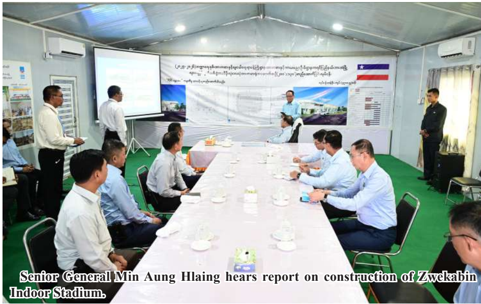
Senior General Min Aung Hlaing hears report on construction of Zwegabin Indoor Stadium.