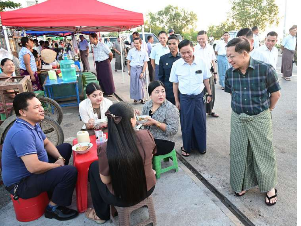
ပြည်ထောင်စုသမ္မတမြန်မာနိုင်ငံတော် ယာယီသမ္မတ နိုင်ငံတော်လုံခြုံရေးနှင့်အေးချမ်းသာယာရေးကော်မရှင်ဥက္ကဋ္ဌ ဗိုလ်ချုပ်မှူးကြီးမင်းအောင်လှိုင် မော်လမြိုင် ကမ်းနားလမ်းရှိ ညဈေးတန်း၌ ဒေသရိုးရာ အစားအသောက်များ၊ ဈေးဆိုင်ခန်းများဖွင့်လှစ်ရောင်းချနေမှုများကို လိုက်လံကြည့်ရှုပြီး ဈေးရောင်းချနေသူများနှင့် လာရောက်စားသုံးကြသည့် ပြည်သူလူထုများကို ရင်းရင်းနှီးနှီးနှုတ်ဆက်စဉ်။