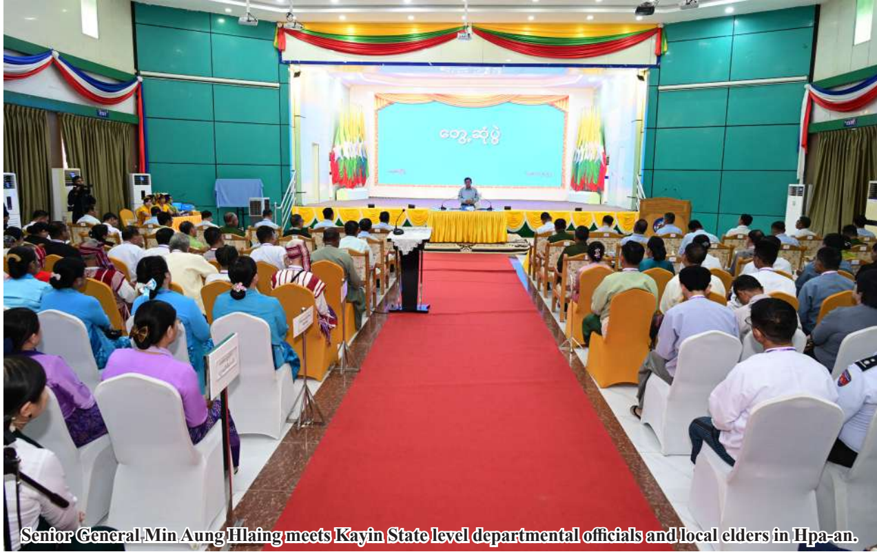
Senior General Min Aung Hlaing meets Kayin State level departmental officials and local elders in Hpa-an.

control floods. The project will generate electricity for the area and reduce natural floods to a certain degree. Hence, local people should collectively render a helping hand towards the success of the project. As Kayin State is a pleasant place, local and foreign tourists are showing interest in visiting it. The place needs extra progress, and the visitors should be attracted with activities to beautify the areas in and around Hpa-an and fresh and clean local cuisines. Tourism is a beneficial business for a region as its income is high. The collective involvement of the people is required as its extra development calls for area peace and stability.