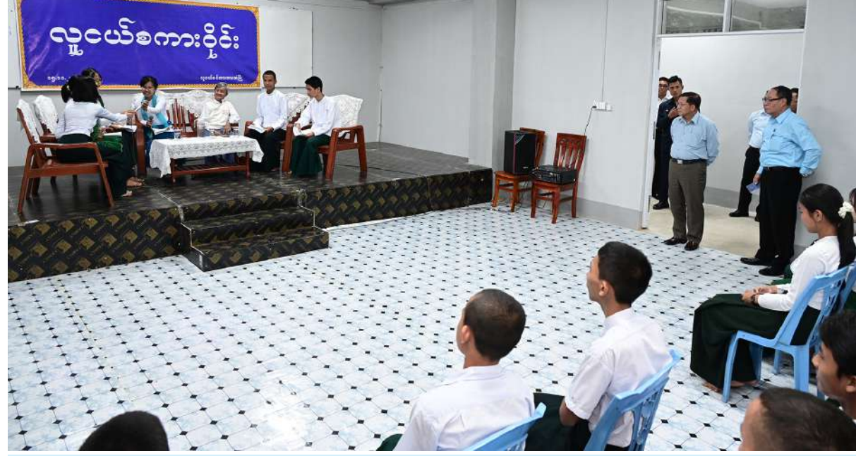
ပြည်ထောင်စုသမ္မတမြန်မာနိုင်ငံတော် ယာယီသမ္မတ နိုင်ငံတော်လုံခြုံရေးနှင့် အေးချမ်းသာယာရေးကော်မရှင်ဥက္ကဋ္ဌ ဗိုလ်ချုပ်မှူးကြီး မင်းအောင်လှိုင် လူငယ်စင်တာအတွင်း လူငယ်စင်ကားဝိုင်းပြုလုပ်နေမှုကို ကြည့်ရှုစစ်ဆေးစဉ်။

ကရင်ပြည်နယ်အတွင်း ပညာရည် မြင့်မားစေရေးအတွက် တန်းစဉ်ကျေးပြောင်း မှုများမြင့်မားနေရန်လိုကြောင်း၊ မိမိတို့နိုင်ငံ တွင် အကြောင်းအမျိုးမျိုးအရ တန်းစဉ် ကျေးပြောင်းမှုများ နည်းပါးနေသေးကြောင်း၊ ပညာရေးကို အားပေးမှသာ ဒေသဖွံ့ဖြိုး တိုးတက်ရေးနှင့် နိုင်ငံဖွံ့ဖြိုးတိုးတက်ရေးကို ဆောင်ရွက်နိုင်မည်ဖြစ်ကြောင်း၊ အထက် တန်းပညာအဆင့် ပြီးဆုံးအောင်သင်ကြားနိုင် မှုမရှိသူများအတွက်လည်း အလုပ်အကိုင် များရရှိရေး ဆောင်ရွက်ပေးသွားရန်လို ကြောင်း၊ ရှိပြီးသားလူသားအရင်းအမြစ်များ လုပ်ငန်းခွင်များတွင် အလုပ်လုပ်ကိုင်နိုင်စေ ရေးသင်တန်းများ ဖွင့်လှစ်ဆောင်ရွက်ပေး သွားကြရန်လိုကြောင်း၊ ခရိုင်များအလိုက် စိုက်ပျိုးရေး၊ မွေးမြူရေးနှင့် စက်မှုအထက် တန်းကျောင်းများကို ဖွင့်လှစ်သင်ကြားပေး လျက်ရှိကြောင်း၊ ထိုသို့ဆောင်ရွက်ခြင်းဖြင့် မိမိတို့နိုင်ငံ၏ စိုက်ပျိုးမွေးမြူရေးလုပ်ငန်းများ ကို များစွာအထောက်အကူပြုစေမည်ဖြစ် ကြောင်း၊ စိုက်ပျိုးမွေးမြူရေး ကုန်ထုတ် လုပ်ငန်းများကို ပိုမိုတိုးတက်အောင်ဆောင် ရွက်နိုင်ခြင်းဖြင့် အထွက်နှုန်းများတိုးတက် လာပြီး တောင်သူတစ်ဦးချင်း၏ ဝင်ငွေများ တိုးတက်လာမည်ဖြစ်ကြောင်း၊ ထို့ကြောင့် ကရင်ပြည်နယ်အတွင်း ပညာရည်ဖွံ့ဖြိုး တိုးတက်စေရေး အားလုံးက ဝိုင်းဝန်းဆောင် ရွက်သွားကြရန်လိုကြောင်း။