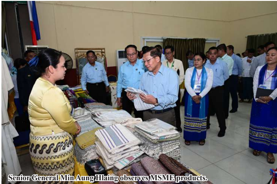
Senior General Min Aung Hlaing observes MSME products.