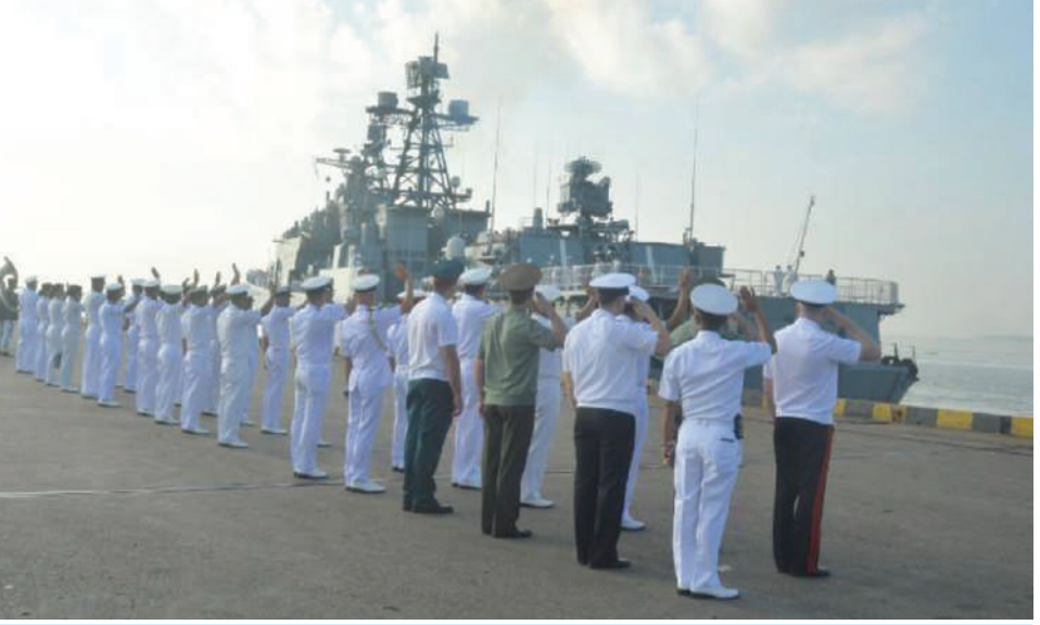
ရုရှားရေတပ် Pacific Fleet မှ စစ်ရေယာဉ် သုံးစီးကို တပ်မတော်(ရေ)မှ အရာရှိကြီးများ၊ အရာရှိ စစ်သည်များ၊ ရုရှားဒုတိယရေတပ်ဦးစီးချုပ်၊ မြန်မာနိုင်ငံဆိုင်ရာ ရုရှားစစ်သံမှူးနှင့် တာဝန်ရှိသူများက ပို့ဆောင်နှုတ်ဆက်စဉ်။

လွန်ခဲ့ပြီပွဲများ ကျင်းပပြုလုပ်ခြင်း၊ ညစာစားပွဲကျင်းပခြင်းနှင့် ဆိပ်ကမ်းအခြေပြုလေ့ကျင့်ခြင်းများ ဆောင်ရွက်ကြသည်။ ဠင်းနောက် နိုဝင်ဘာ ၁၃ ရက်နှင့် ၁၄ ရက်တို့တွင် ရုရှားရေတပ်မှစစ်ရေယာဉ်များသည် တပ်မတော်(ရေ)မှ စစ်ရေယာဉ်များနှင့်အတူ ပင်လယ်ပြင်၌ ရေကြောင်းလုံခြုံရေးဆိုင်ရာ လေ့ကျင့်ခန်းများ လက်တွေ့ပူးပေါင်းဆောင်ရွက်ခဲ့ကြောင်းနှင့် နိုဝင်ဘာ ၁၄ ရက် ညပိုင်းတွင် စစ်ရေယာဉ်(မှတ္တမ)ပေါ်၌ လေ့ကျင့်ခန်းပြန်လည်သုံးသပ်ခြင်းနှင့် ပိတ်ပွဲအခမ်းအနားကျင်းပပြီး ပြန်လည်ထွက်ခွာသွားကြောင်း သတင်းရရှိသည်။ (၅၀၁)