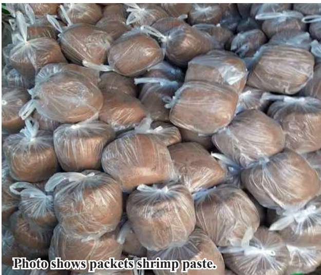
Photo shows packets of shrimp paste.