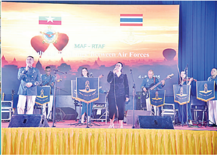
စစ်ဦးစီးအရာရှိချုပ်(လေ) ဒုတိယဗိုလ်ချုပ်ကြီးဇော်ဝင်းမြင့် ထိုင်းဘုရင့်လေတပ်မှ ဖျော်ဖြေရေးအဖွဲ့ဝင်များ၏ ဖျော်ဖြေတင်ဆက်မှုကို ကြည့်ရှုအားပေးစဉ်။

ကမ္ဘာအေးစေတီတော်တို့သို့ သွားရောက် ဖူးမြော်ကြည့်ခဲ့ကြပြီး ရန်ကုန်မြို့ရှိ Time City၊ ဗိုလ်ချုပ်အောင်ဆန်းဈေး၊ Junction City နှင့် အထင်ကရနေရာများသို့ သွားရောက် လေ့လာလည်ပတ်ကြည့်ရှုခဲ့ ကြကြောင်း သိရှိရသည်။ ထိုင်းဘုရင့်လေတပ်မှ အုပ်အဆင့် အပြန်အလှန်လေ့လာရေးအဖွဲ့ဝင်များနှင့် ဖျော်ဖြေရေးအဖွဲ့ဝင်များသည် ယနေ့ ညနေပိုင်းတွင် ရန်ကုန်မြို့မှ ထိုင်းနိုင်ငံသို့ ထိုင်းဘုရင့်လေတပ်မှ လေယာဉ်ဖြင့် ပြန်လည်ထွက်ခွာကြရာ တပ်မတော် (လေ)မှ တာဝန်ရှိသူများက မင်္ဂလာခွံ လေတပ်စခန်းဌာနချုပ်၌ ပို့ဆောင် နှုတ်ဆက်ခဲ့ကြကြောင်း သတင်း ရရှိသည်။ (၅၀၁)