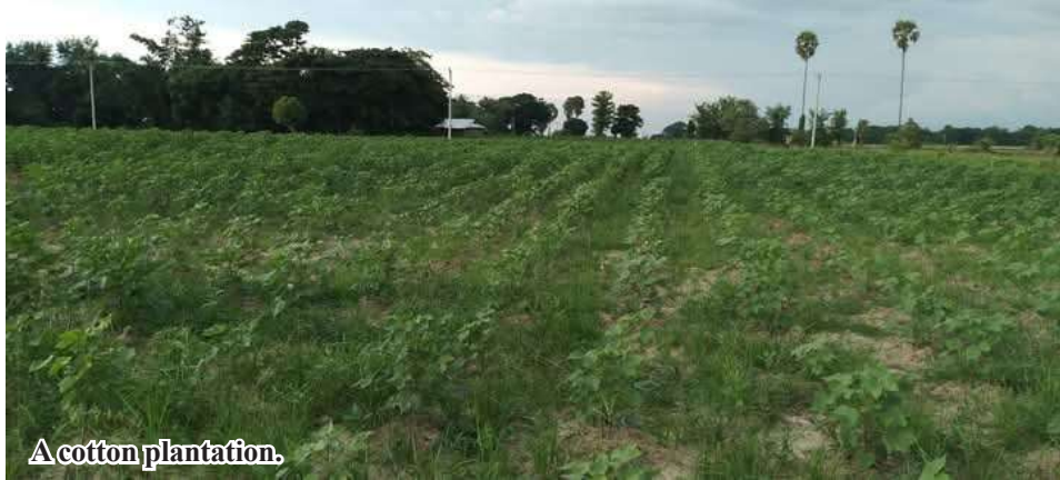
A cotton plantation.

Sagaing August 5 According to Sagaing Township Agriculture Department, local farmers have planted 4,548 acres of cotton plantations as monsoon crops in Sagaing Township of Sagaing Region. For the 2025-2026 monsoon crop season, a total of 16,821 acres of cotton crops are planned to be cultivated