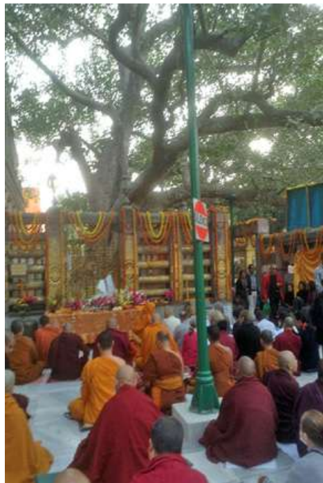
စစ်ကိုင်းမင်း၏ အလှူတော်ကျောက်စာပေးပို့ခဲ့သည့် မဟာဗောဓိမဏ္ဍိုင်ကို တွေ့ရစဉ်။

ဗုဒ္ဓဘုရားရှင်ပွင့်ထွန်းခဲ့သည့် အိန္ဒိယနိုင်ငံနှင့် မြန်မာနိုင်ငံသည် ရှေးနှစ်ပေါင်းများစွာကပင် ဒေသနှစ်ခုကြား ဆက်သွယ်မှုများရှိခဲ့သည်။ ဗုဒ္ဓဝင်ကျမ်းများအလိုအရ ဘုရားရှင်ပွင့်တော်မူချိန်ကတည်းက မြန်မာများနှင့် အိန္ဒိယတိုင်းသားများသည် အပြန်အလှန်ဆက်သွယ်မှုများရှိခဲ့သည်။ အထူးသဖြင့် တပုဿနှင့် ဘလ္လိကကုန်သည်ညီနောင်က ဘုရားရှင်ကို ဖူးမြင်ခဲ့သည့်ဇာတ်လမ်းသည် အများယုံကြည်လက်ခံထားသည့် ဗုဒ္ဓဝင်ဖြစ်တော်စဉ်တစ်ခုဖြစ်ပေသည်။