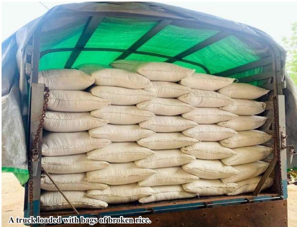
A truck loaded with bags of broken rice.